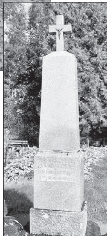
Могила Андрея Кантиника.