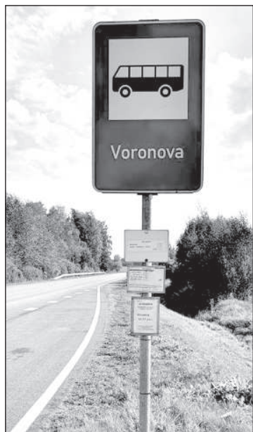
Автобусная остановка на шоссе А12.

Франциса Кемпса многие считают главным оппонентом Франциса Трасунса во времена Первого Латгальского конгресса, строителем так называемого альтернативного конгресса в те же дни. Не знаю, было ли это запланировано заранее или это был план Б, или же это был всего лишь экспромт, когда вышедшие из кинотеатра «Diana» в Резекне устроили свой конгресс, приняли резолюции, сделали общее фото 7 на память. На заднем плане – кирпичное здание, с левой