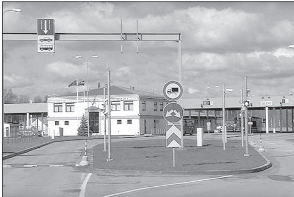
На Фото КПП в Патерниеки.

● лица, которые перенесли заболевание «Covid-19» и с даты взятия