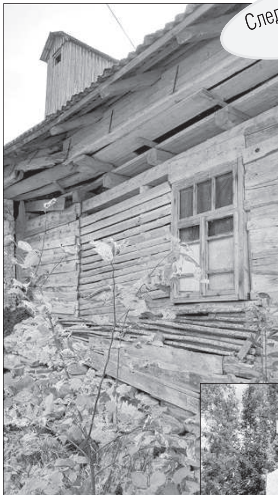
Останки мельничного комплекса.

Если перейдем мост Тауринки и пойдем дальше, то скоро