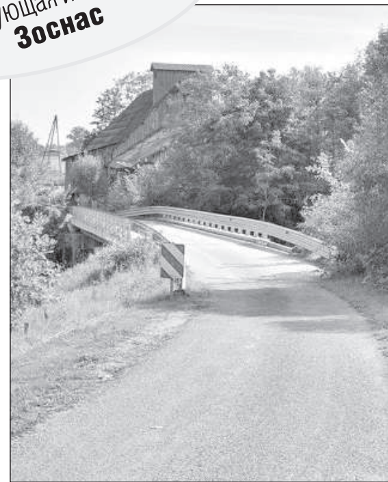
Мост и бывшая мельница.