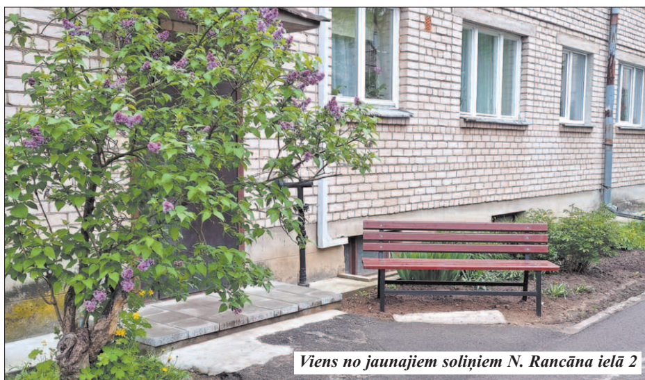
Viens no jaunajiem soliņiem N. Rancāna ielā 2

Dzīvokļu īpašniekus aicinām izturēties saudzīgi pret kopīpašumu, saudzīgi atvērt un aizvērt durvis, nebojāt apgaismes ķermeņus un slēdzus, rūpēties par tīrību kāpņu telpās. Tikai darbojoties savstarpējā cieņā un sapratnē iespējama veiksmīga daudzdzīvokļu dzīvojamo māju apsaimniekošana!