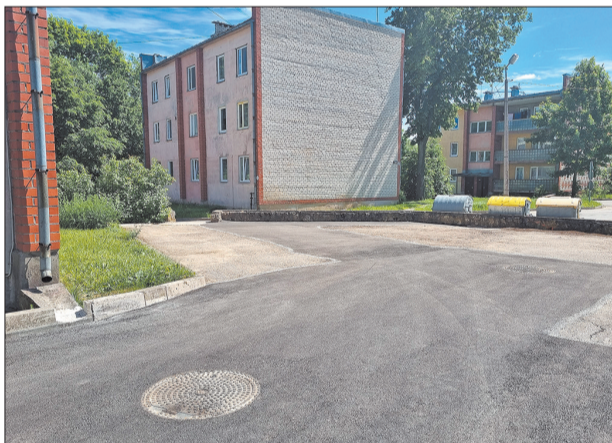
Atjaunotais asfalta segums Pils ielā 8a