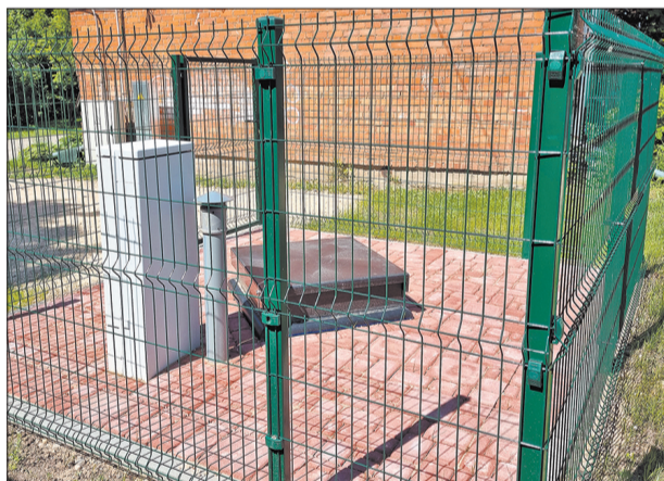
Kanalizācijas sūkņu stacija Pils ielā 12a

2021. gada maijā noslēgušies ūdensvada un kanalizācijas tīklu atjaunošanas būvdarbi Mehanizatoru-Pils ielu mikrorajonā, Preiļos. Līgumus par darbu veikšanu 2019. gada novembrī SIA «PREIĻU SAIMNIEKS» noslēdza ar SIA «PREIĻU SANTEHNIĶIS».