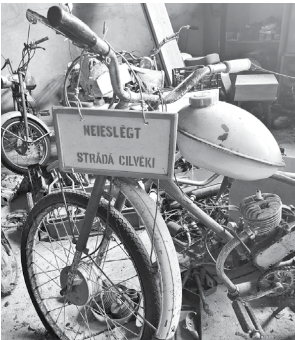
Cilvēkus neieslēgsim. Bet vai mopēdus drīkst?