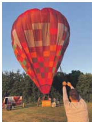
Balons piepūsts ar gaisu, lai var sagatavoties lidošanai virs zemes.

Virs Kuldīgas ik pa laikam redzams slīdam skaists balons. Diez kas ar to nodarbojas? Un viens otrs domā, vai arī viņš varētu pamēģināt. Kurzemnieka žurnālistei bija šī iespēja redzēt pilsētu no putna lidojuma.