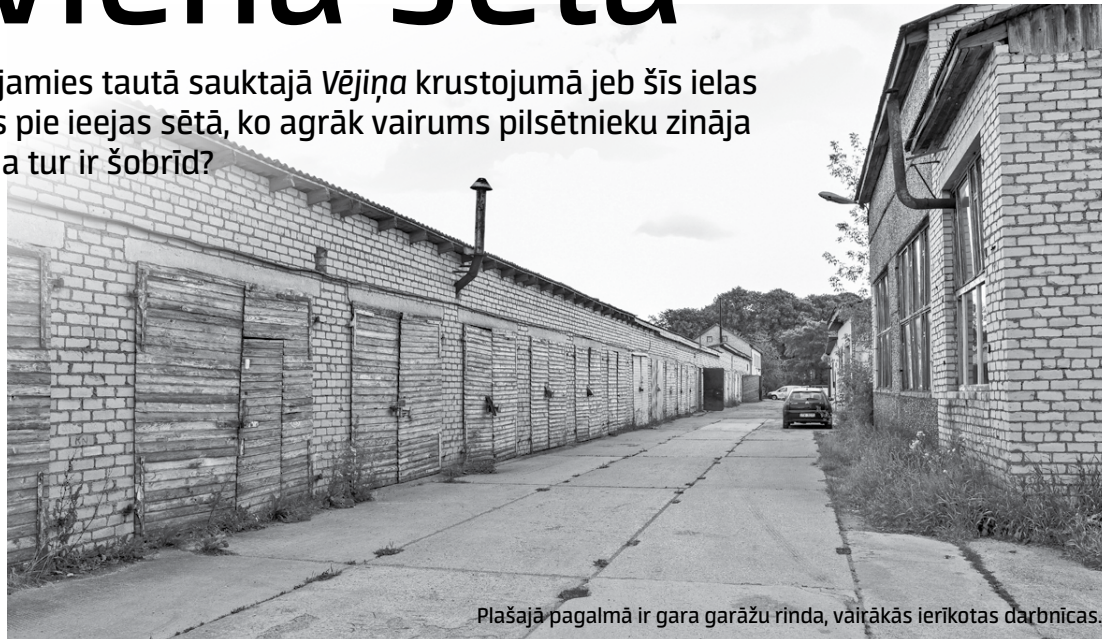
Plašajā pagalmā ir gara garāžu rinda, vairākās ierīkotas darbnīcas.