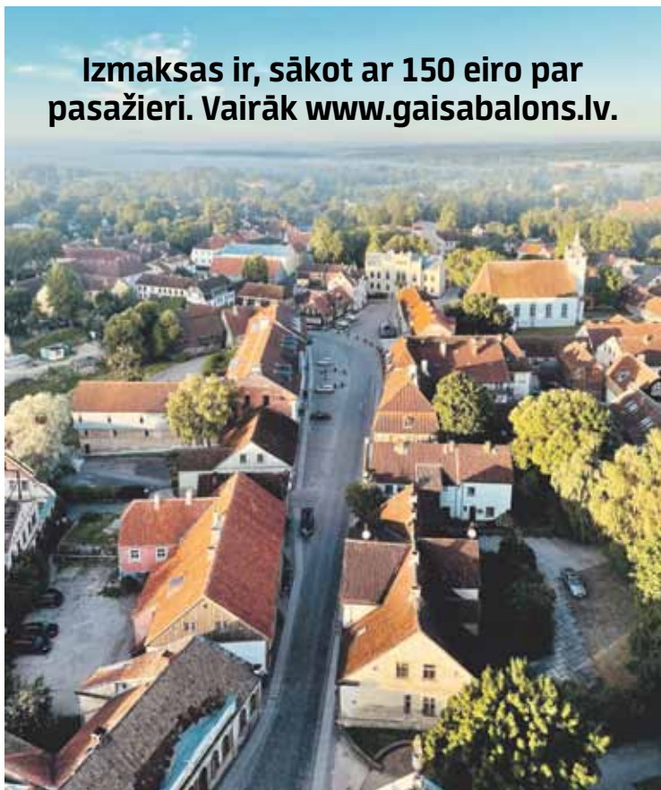
Pats pilsētas centrs ar novada pašvaldības ēku galā.

Izmaksas ir, sākot ar 150 eiro par pasažieri. Vairāk www.gaisabalons.lv .