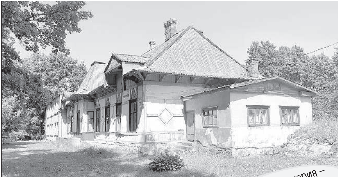
Бывшее Зосненское поместье, бывшая Зосненская школа.