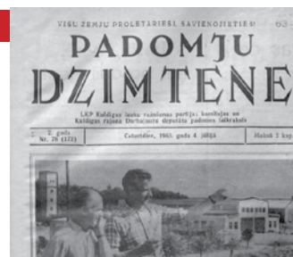
Padomju Dzimtene 1963. gada 4. jūlijā