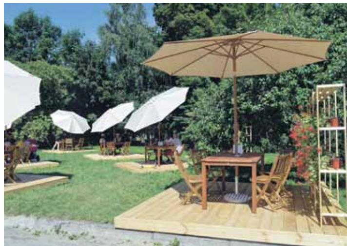
Skats uz dārza terasi Skolas ielā.

Ja laika apstākļi ļaus, terase darbosies līdz oktobrim.