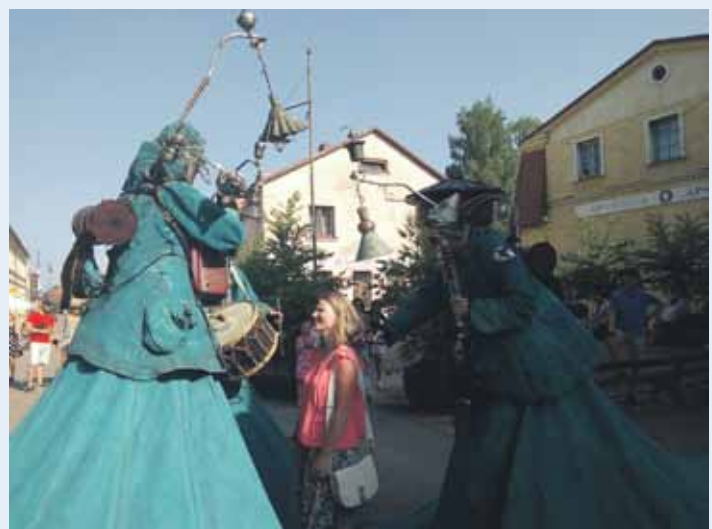
Muzikālā ielu teātra grupa Celestroj Kuldīgā viesojas ar izrādi Parēģojumi . Tajā darbojas trīs garkāji, kuri neparastā manierē ar pašgatavotiem mūzikas instrumentiem atskaņoja savdabīgus parēģojumus.