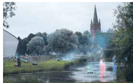
Pilsētas svētku reportāža.