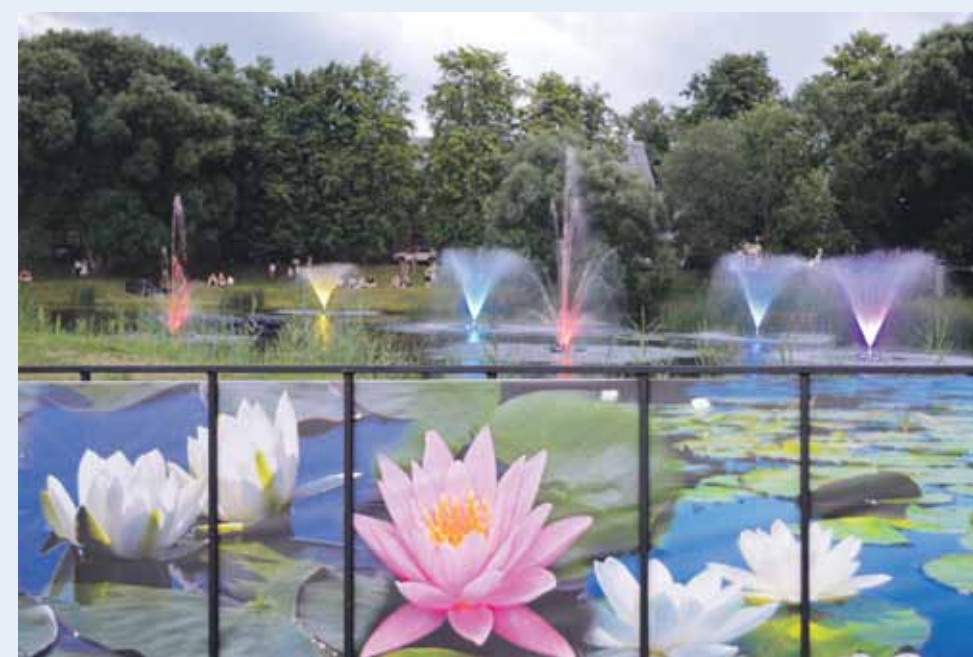
Reibinoši veldzējošs Māras diķa SPA – ūdenslāšu rotaļas vieglā mūzikas pavadijumā.