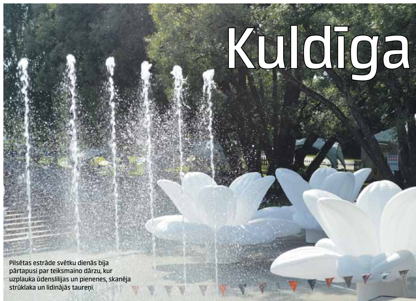
Pilsētas estrādē svētku dienās bija pārtapusi par teiksmaino dārzu, kur uzplauka ūdenslilijas un pienešes, skanēja strūklaka un lidinājās taureņi.