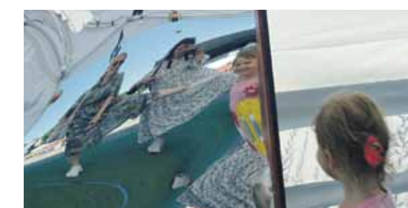
Smieklu šaltis skanēja no teltīm, kur bija novietoti greizie spoguļi, jautrībai jāvāmiēs arī mēs.

Lai arī visiem tik ierastais festivāls Dzīres Kuldīgā pandēmijas dēļ nenotiek otro gadu, Kuldīgas kultūras centrs jūlija trešajā nedēļā kuldīdzniekiem un pilsētas viesiem piedāvāja baudīt vides objektu parādi jeb pilsētas defilē Taureņiem tik savādiem . Līdz 25. jūlijam Liepājas ielā vēl varēs apskatīt taureņkrēslus, par kuriem bija stāsts 16. jūlija Kurzemniekā .