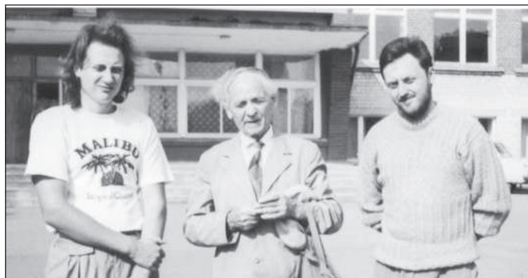
Около 5-й средней школы.

го здания. В нем будут административные службы предприятия, рабочие кабинеты, залы для заседаний, красный уголок, кафетоловая, комнаты отдыха. Административный корпус с производственными цехами соединит галерея. В здании будет работать лифт. Для отделки здания будут использовать керамическую плитку, декоративные кирпичи». 9