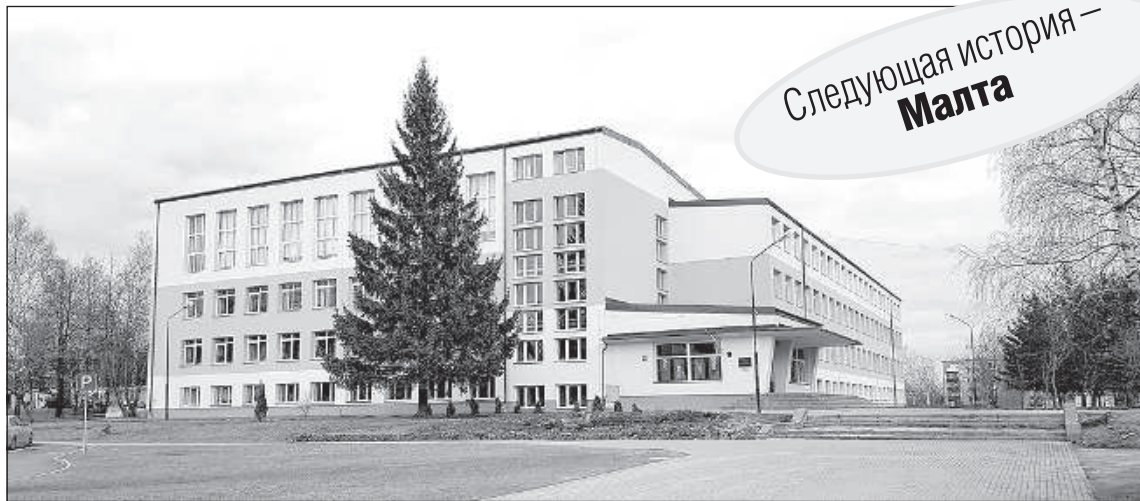
Резекненская 5-я средняя школа (2019).