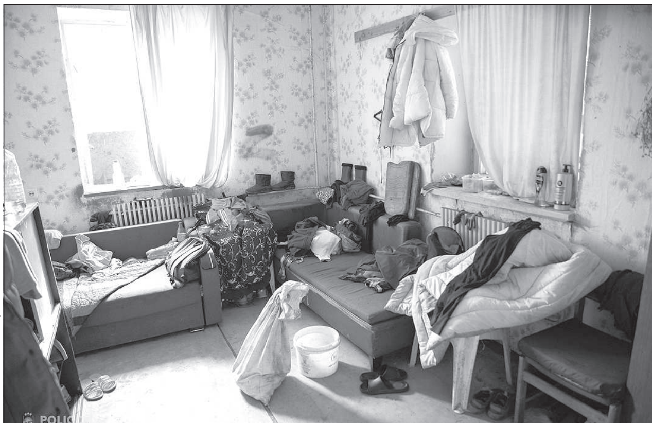
В таких условиях под Балви проживали современные рабы.