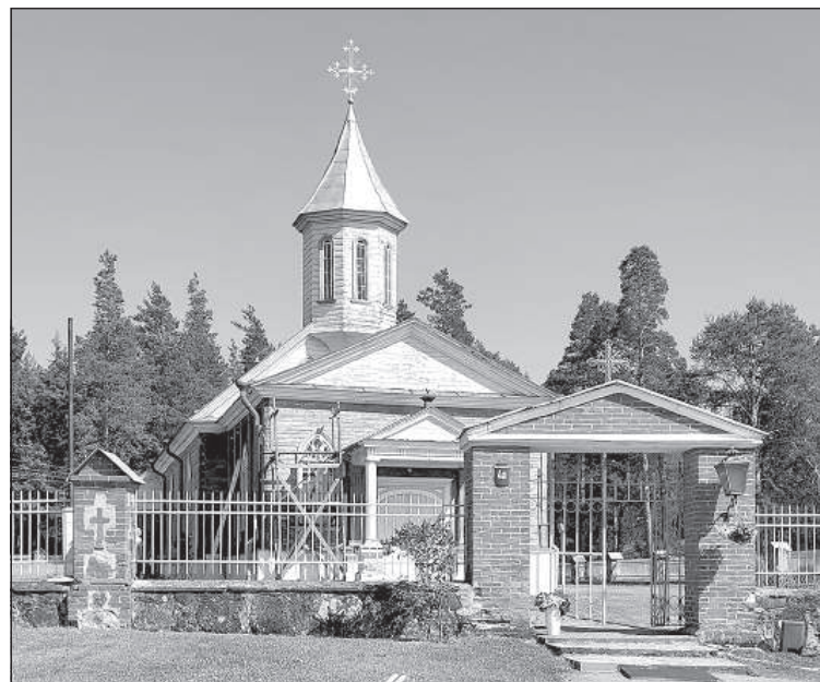
Розентовский костел (2020).