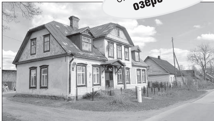
Вид домов, характерных для Малты и Вертукушне.

Антонопольская станция в 19-м веке «последние десятилетия это было простое деревянное здание, вблизи которого находился Вейнштоковский трактир. Дальше до самого шоссе простирался лес, уводящий к не-