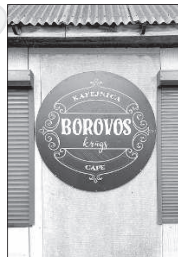
Старые названия живы!

Малта протекает под дорогой высшей категории А13, раньше было населенное место, называемое Мостовой. Реки раньше имели большее значение для хозяйства, чем сейчас. Да и реки в то время были настоящими реками – по ним спускали деревья, в лодках переплавали грузы, воду брали для производства. Во времена Улманиса у края моста была мельница, а ближе к железной дороге – кирпичное производство.