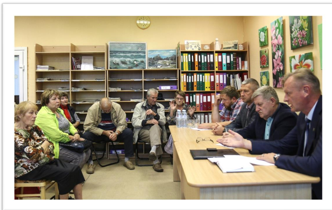
Foto: Noslēdzošā iedzīvotāju un pašvaldības pārstāvju tikšanās notika 30. septembrī Edvarta Virzas Iecavas bibliotēkā.

Septembrī notika jau ierastās pašvaldības vadības pārstāvju tikšanās ar iedzīvotājiem novada bibliotēkās Iecavā, Dimzukalnā, Zorģos, Zālītē, Rosmē un Audrupos. Tikšanās ar iedzīvotājiem ir viens no veidiem, kā informēt sabiedrību par pašvaldības darbu un apzināt primāri risināmās problēmas pievilcīgākas dzīves telpas veidošanai.