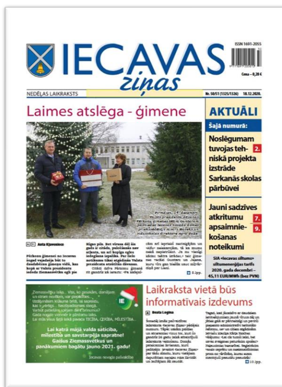
Foto: Pēdējais laikraksta «Iecavas Ziņas» numurs iznāca 2020. gada 18. decembrī.

2020. gada 18. novembrī stājās spēkā Saeimas apstiprinātie grozījumi likumā «Par presi un citiem masu informācijas līdzekļiem», saskaņā ar kuriem papildināta likuma 8. panta pirmā daļa un ir šādā redakcijā: «Tiesības dibināt un izdot masu informācijas līdzekļus ir juridiskajām un fiziskajām personām, kā arī personālsabiedrībām, izņemot pašvaldības un to iestādes.» Tāpēc Iecavas novada pašvaldības deputāti 1. decembrī nolēma pārtraukt pašvaldības laikraksta «Iecavas Ziņas» darbību, sākot ar 2020. gada 21. decembri, un no 2021. gada 1. janvāra izdot pašvaldības informatīvo izdevumu «Iecavas Ziņas».