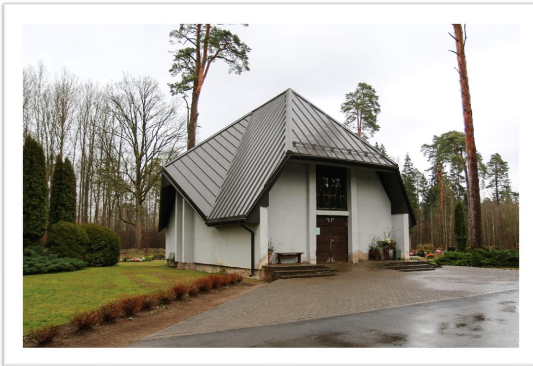
Foto: Sila kapu kapličiai nomainīts jumta segums.

2020. gadā pašvaldības teritoriju apsaimniekošanai kopā izlietoti 314 538 eiro . Bez ārējā finansējuma piesaistes izveidots bērnu rotaļu laukums Grāfa laukumā par 18 783 eiro un rotaļu ierīces novada ciematos par 11 216 eiro . Par 24 096 eiro nomainīts jumta segums Sila kapu kapličiai. Ir uzsākta Iecavas parka attīstības koncepcijas izstrāde, kam 2020. gadā izlietoti 4 166 eiro .