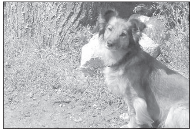
Пес Дружок привел к раненому хозяину.