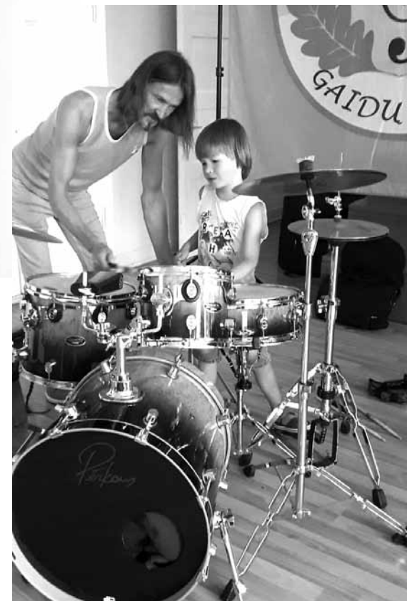
Ikars juniors pie Ikara seniora Aizputes mūzikas skolas 1. klasē mācās sitamos instrumentus. Tēvs priecējās par juniora nozīmīgo sasniegumu pavasarī – 1. vietu starptautiskā konkursā Kazahstānā.

nogurums: savlaicīgi jāierodas, jāuzstāda aparatūra, pēc koncerta un balles gaismu un skaņas tehnikā jānovāc.