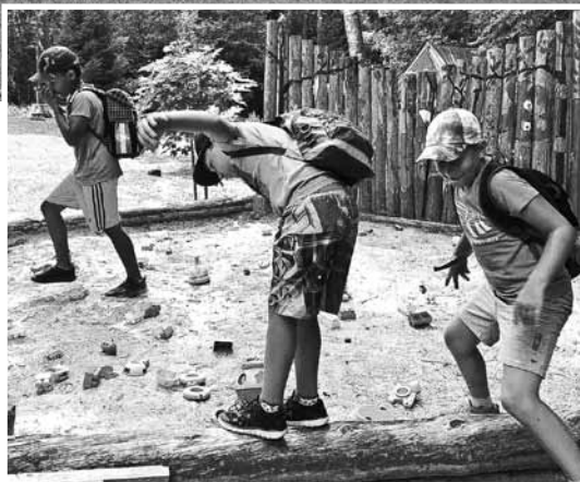
Sporta nometnes aktivitātes.

Katru dienu izmēģināt kādu jaunu vieglatlētikas disciplīnu, uzzināt par slaveniem Latvijas un pasaules vieglatlētiem un veicināt bērnu savstarpēju saliedēšanos – tāds bija mērķis Kuldīgas novada sporta skolas organizētajai nometnei bērniem.