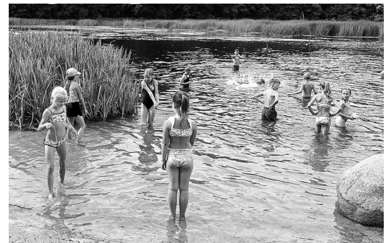
Bērni mācās, kā pareizi peldēt.