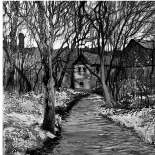
Novembra krāšņums. Nami ar piemājas dārziem, ko upes lokos sargā lieli koki. Māksliniece piemin, ka viņas mīļākais gada mēnesis ir novembris un ka daba mēdz šajā laikā mainīties.

„Ja ir vēlme gleznot, tad tas noteikti jādara, jo bērnam jāizvēlas, ko darīt savā dzīvē. Labāk izmēģināt un saprast, ka nepatīk, nevis pēcāk nožēlot.”