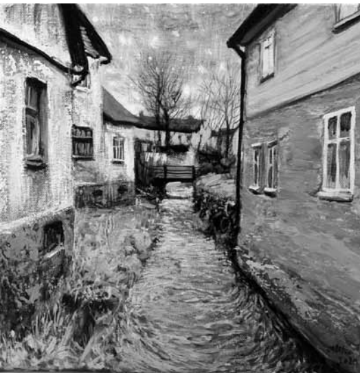
Pirmās vakara zvaigznes. Aleksūpītē redzamas līdzīgas nianse kā Venēcijas kanālu tīklojumā, izņemot izteiktu ūdensaugu klātbūtni un staltos koku siluetus distancē.