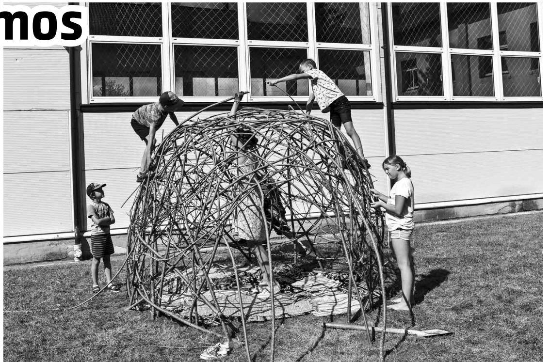
Nometnē izveidoto klūgu māju Vilgāles skolas audzēkņi varēs izmantot visa gada garumā.

vas mazās saimes, kurā kopā ar skolotāju pārrunāja iepriekšējo dienu piedzīvojumus, dalījās ar savām sajūtām un to, kas varētu sagaidīt turpmākajās dienās. Tad sākās radošās aktivitātes, piemēram, klūgu mājas celtniecība, kurā bērni iemācījās, ko nozīmē sadarbība un uzticēšanās. Precizitāti un radošumu dalībnieki varēja attīstīt skolas sienu apgleznošanā, bet mazo rokdarbu darbnīcas telpā bērnu sarunas papildināja āmuru skaņas, jo ikkatram bija iespēja iemēģināt savu roku, veidojot gleznas no naglām un dzijas. Pēcpusdienā visi steidzās izkustēties kopīgās sporta spēlēs. Liela uzmanība visās aktivitātēs tika vērsta uz pārļu meklēšanu sevī – labo vērtību izcelšanu un parādīšanu