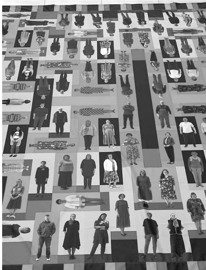
Fragments no fotokolāžas Kuldīgas gobelēns .

Daiga Bitinieca, Ievas Lindkvistes arhīva foto