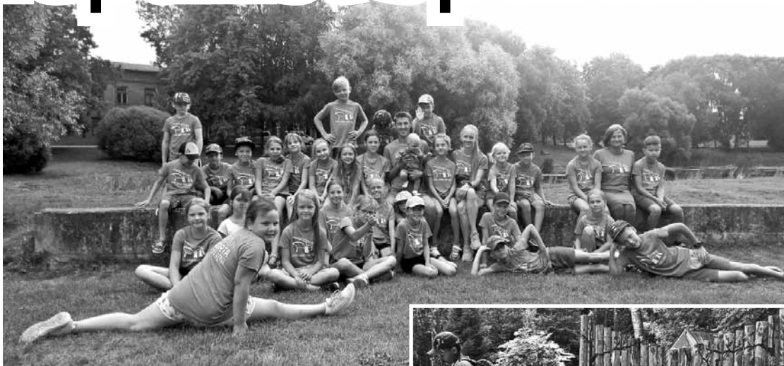
Nometnes dalībnieku un pasniedzēju kopbilde.

Katru dienu izmēģināt kādu jaunu vieglatlētikas disciplīnu, uzzināt par slaveniem Latvijas un pasaules vieglatlētiem un veicināt bērnu savstarpēju saliedēšanos – tāds bija mērķis Kuldīgas novada sporta skolas organizētajai nometnei bērniem.