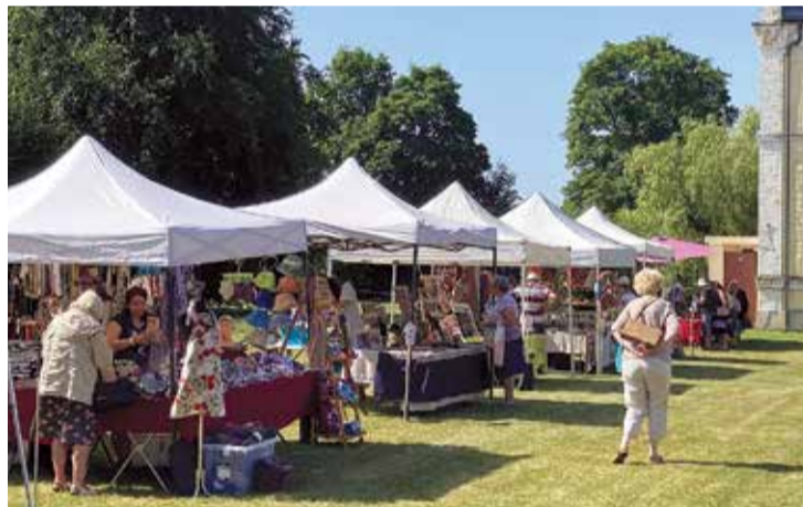
Tirdziņš aizvadīts jaukā un sirsnīgā atmosfērā.

3. jūlijā Salaspils novada tūrisma informācijas centrs sadarbībā ar Daugavas muzeju organizēja pirmo Doles muižas tirgu, lai kaut nedaudz dotu iespēju gan vietējiem, gan novada viesiem izjust un baudīt pasākuma atmosfēru, satikšanos, iepirkšanās prieku, kā arī tirgotājiem – amatniekiem un mājažotājiem – dotu iespēju "izcelt saulītē" savus veikumus un darinājumus.