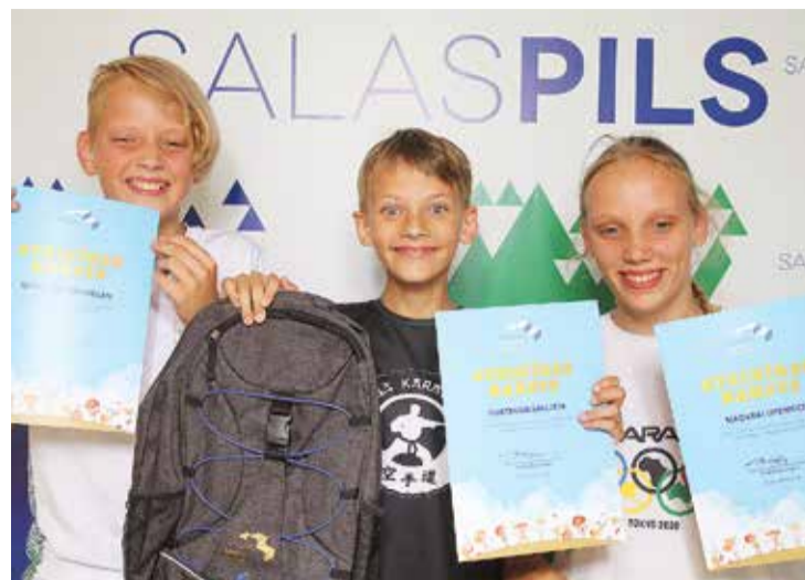
Mazie karatisti ir lepmi un priecīgi ar saviem sasniegumiem.