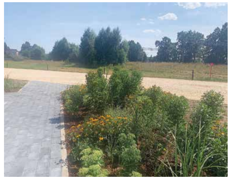
Bērni palīdzēja kopt arī apstādījumus pie jaunās stāvvietas Miera ielā.