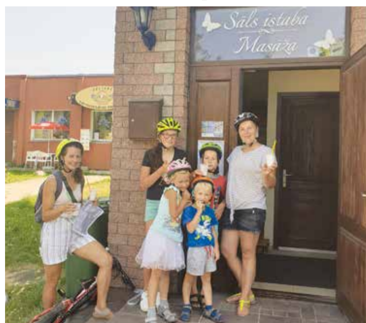
Piedzīvojumā devās gan bērni, gan pieaugušie.

EXIT RĪGA "Tūristu dienu" ietvaros norisinājās arī dažādi pasākumi – 17. jūlijā Nacionālā botāniskā dārza teritorijā norisinājās Rožu dienas gadatirgus, Salaspils Dievmātes Rožukroņa karalienes Romas katoļu baznīcas dārzā varēja piedalīties spēlēs, kas bija saistītas ar Salaspils novada vēsturi, īpaši ar 12.-13. gadsimtu, kad Salaspils teritorijā darbojās lībiešu valdnieks Ako un svētais Meinards, bīskaps Alberts u.c., tāpat arī tieši šajā brīvdienā Tūrisma informācijas centrs pulcināja pastaigu mīļotājus, organizējot pārgājieni uz kūdras purvu