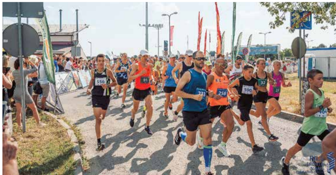
Cīņā par uzvarām un labākajiem rezultātiem.