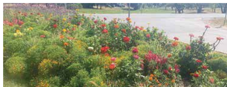
Lai skaistās ziedu dobēs priecētu mūsu acis, ir jāveic augu aizsardzības pasākumi.

Teju visā pilsētas teritorijā varam sastapt ziedu krāšņumu, kas priecē gan salaspiliešus, gan pilsētas viesus. Par skaistajām puķu dobēm, ziedu kastēm, piekaramajiem puķu podiem un citiem vides objektiem ik dienas rūpējas Komunālā dienesta darbinieki. Liels paldies par ieguldījumu puķu dobju kopšanā!