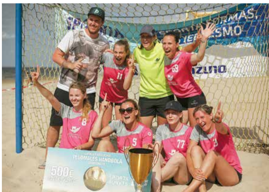
Smiltis, pludmale un uzvara – lieliska diena Salaspils handbolistēm.