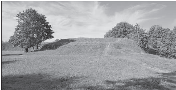
Гора Масленникова со стороны озера (2018).

«При осмотре Резекне каждый турист должен взобраться на гору Масленникова, где раньше был замок первого старшины города барона М. Корфа. Отсюда открываются красивые виды во все стороны», 1 - такой призыв был опубликован в 1943 году.