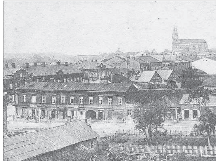
Если в царские времена смотреть с горы на шоссе.

Масленникова, можно было видеть, как кто-то смотрит на тебя в окно на верхнем этаже этого дома. Я был внутри в этих двух домах, видел, как там все выглядит. Это были очень интересные постройки!