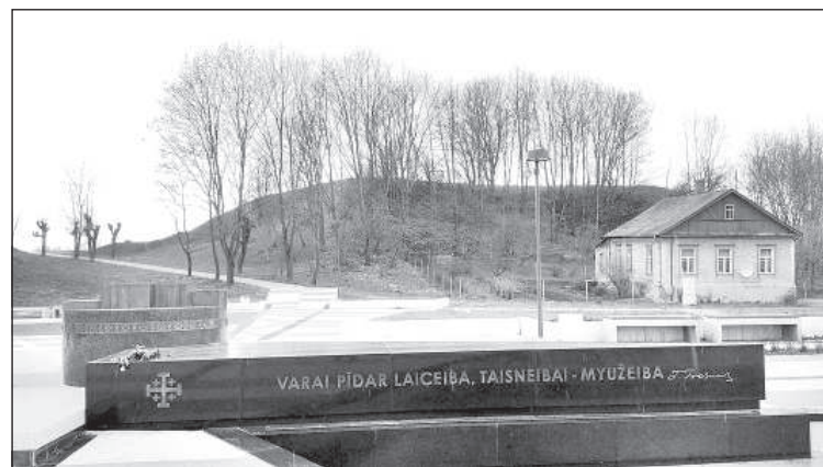
Гора в осеннем наряде (2018).

В кустах за магазином, названным «Viktorija», были старые каменные стены, какие-то погребки. Весь склон горы Масленникова со стороны бывшей красивой улицы Вокзальной был с какими-то фундаментами и остатками стен, с недавно построенными деревянными сараями и огороженными различными способами цветника-