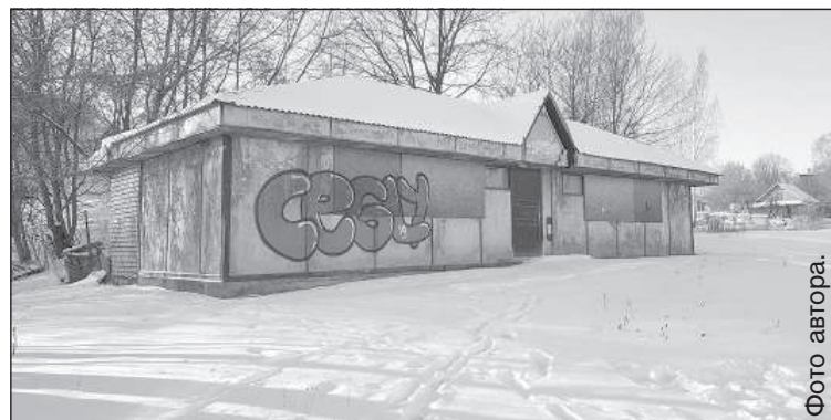
В 90-е годы здесь кипела жизнь.

Позже ели на этом холме не устанавливали, но на вершине остался электрический деревянный столб с толстым черным проводом. Многие недоумевали, что это такое, даже высказывали версии, что раньше здесь был дом и так далее. Со стороны улицы Бривибас на горе Масленникова раньше было