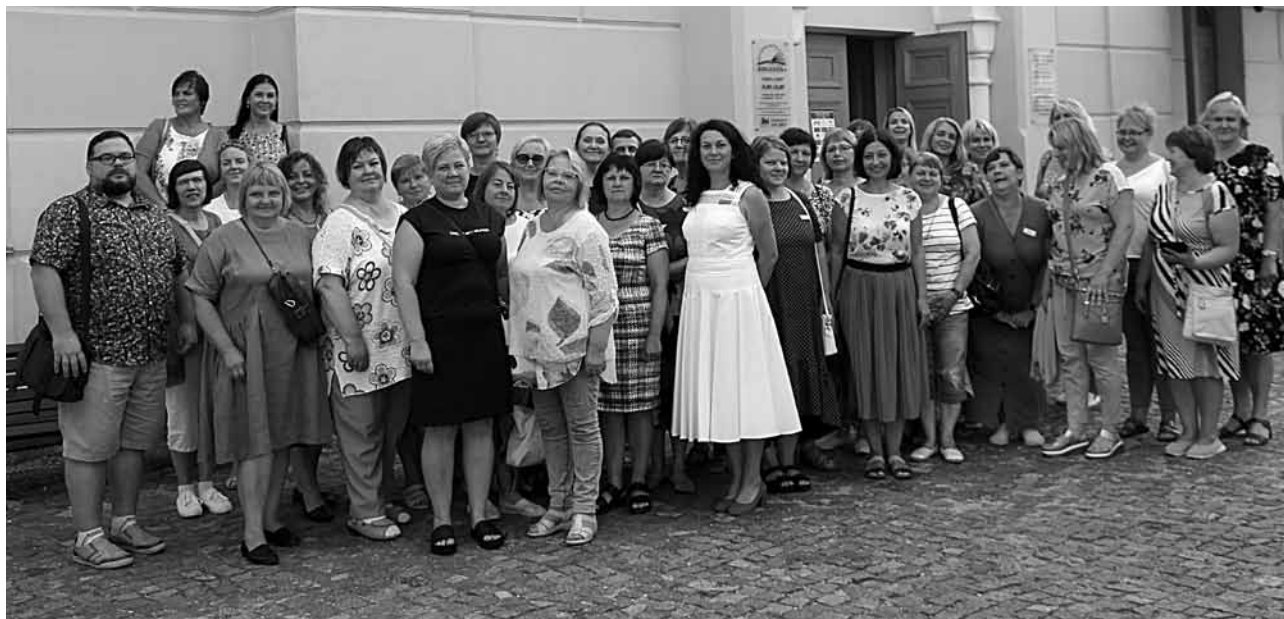
Kurzemes bibliotekāri sapulcējušies pie Kuldīgas galvenās bibliotēkas, lai dotos ekskursijā pa ēku.