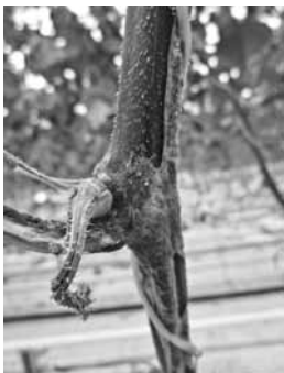
Gurķu stublāja puve var sabojāt visu stādu.

Vēsums un mitrums var veicināt dažādas slimības. Šobrīd naktīs siltumnīcās tiek aizvērtas lūkas, lai saglabātu siltumu, bet gaisa mitrums gan gurķiem, gan tomātiem var attīstīt dažādas slimības.