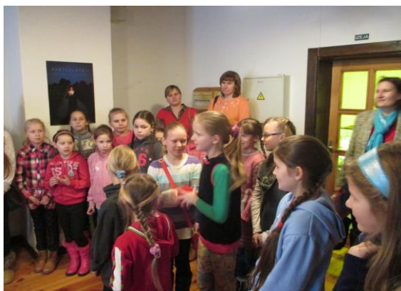
Bērnu žūrijas grāmatu lasīšanas eksperti pasākumā Raiņa mājā Berķenele

audzinātāja. Nīcgales pagasta bērnudārza vadītāja 2015. gadā ieguva godpilno titulu “Lasīšanas vēstnese Latgalē”. Tas ir ļoti augsts novērtējums bibliotēkas un sabiedrības sadarbībai lasītprīka veicināšanā Nīcgalē. Līksnas, Nīcgales, Vaboles pagastu bibliotēku grāmatu lasīšanas eksperti bija uzaicināti un piedalījās Bērnu žūrijai veltītajā pasākumā Raiņa mājā Berķenele. Bērniem piedalīšanās šādā pasākumā bija ļoti nozīmīga un viņi to augsti vērtē.