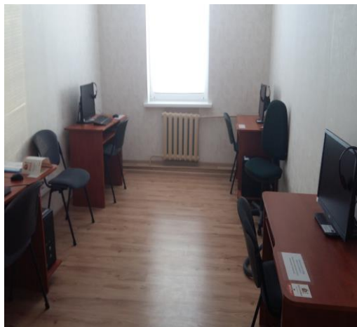
Jaunā datorklase Tabores pagasta bibliotēkā

Labas mūsdienīgas telpas ir Medumu, Biķernieku, Laucesas pagastu bibliotēkās u.c.