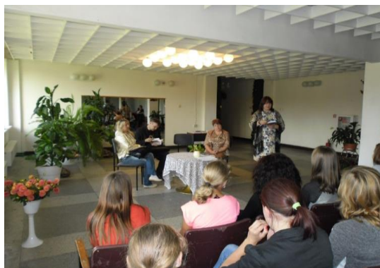
Tikšanās ar dzejniekiem Salienas pagasta bibliotēkā

Pieaugot sabiedrības informacionālajām vajadzībām un interesēm, bibliotēkas nepārtraukti attīsta un pilnveido savus piedāvātos pakalpojumus. Pieaug nepieciešamība informēt sabiedrību par bibliotēkas aktualitātēm un pasākumiem un tāpēc ļoti nozīmīga darbības joma ir bibliotēkas publicitāte. Informācija par novada bibliotēku darbību pieejama Daugavpils novada mājas lapā, pagastu pārvalžu mājas lapās, avīzēs „Daugavpils novada vēstis”, “Latgales Laiks”, “Latvijas Avīze”, www.kulturkarte.lv un www.biblioteka.lv . Pagastu bibliotēkām ir izveidojusies ļoti laba sadarbība ar skolām, skolotājiem, skolēniem. Pagastu bibliotēkas centušās pagasta sabiedrisko dzīvi bagātināt ar dažādiem izglītojošiem pasākumiem un citādām aktivitātēm. Lai informētu un piesaistītu lietotājus tiek rīkoti dažādi pasākumi: jaunieguvumu un tematiskie grāmatu apskati, pārrunas. Bērniem tiek organizētas literatūras izstādes un skates, bibliotekārās stundas, ekskursijas un dažādi tematiski pasākumi: literāras pēcpusdienas, konkursi, vēstures stundas, bērnu jaunrades konkursi un izstādes, videofilmu seansi. Novada pašvaldību bibliotēkās tika izveidotas 518 izstādes un rīkoti 336 tematiski pasākumi. Materiālus izstādēm veido grāmatas, raksti no periodiskajiem izdevumiem, materiāli no tematiskajām mapēm un interneta. Nozīmīgākās bija dažādas tematiskās izstādes, kas veltītas ievērojamu cilvēku jubilejām,