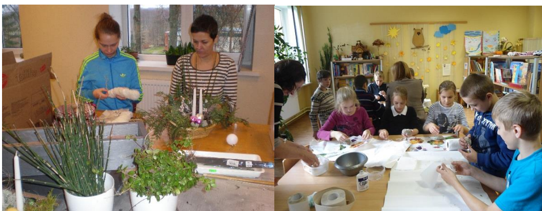
Radošās darbnīcas Ambeļu un Medumu pagasta bibliotēkās