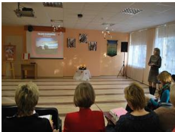
Fotoizstādes prezentācija “Nezināmā Naujene...”