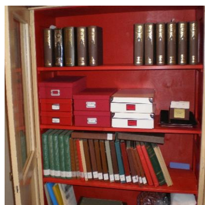
Novadpētniecības materiāli Ambeļu pagasta bibliotēkā

Medumu pagasta bibliotēka cieši sadarbojās ar Medumu pamatskolas muzeju novadpētniecības jomā. Balstoties uz bibliotēkas krājuma un muzeju materiāliem, skolēniem un studentiem tika sniegta palīdzība zinātniski pētniecisko darbu izstrādē. Bibliotēka sadarbojās ar skolas muzeju paaudžu kultūras saglabāšanā, īpaši nacionālo kultūru saglabāšanā. Bibliotēkas un muzeja sadarbības galvenie virzieni novadpētniecības jomā bija saistīti ar pagasta vēsturi, novadnieku apzināšanu, materiālu vākšanu un apkopošanu. Regulāri tika papildinātas ar materiāliem jau esošās tematiskās mapes: „Personība un sabiedrība”, „Dzimtā novada daba”, „Novada vēsture”, „Tūrisms”, „Kultūra un reliģija”, „Izglītība un zinātne”, Medumu pamatskolas novadpētnieciskā rokasgrāmata.