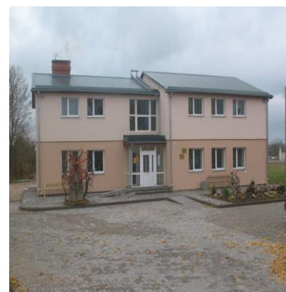
Medumu, Biķernieku, Laucesas pagastu bibliotēkas