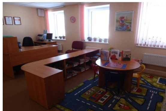
Bērnu stūrīši Ambeļu, Biķernieku pagastu bibliotēkās

Ambeļu pagasta bibliotēkā darbojas bērnu interešu klubs „Čaklās rociņas”. Bibliotēku apmeklē ļoti aktīvi bērni, kuru intereses un spējas dažkārt sniedzas ārpus bibliotēkas piedāvāto tradicionālo pakalpojumu un pasākumu robežām. Daudzi no viņiem lieliski zīmē, nodarbojas ar rokdarbu darināšanu, pašdarbību.