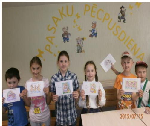
“Pasaku pēcpusdiena 2015” Līksnas pagasta bibliotēkā

tika rīkoti dažādi pasākumi. Lai piesaistītu jaunākos bibliotēkas apmeklētājus Līksnas pagasta bibliotēkā notika pasākums “Pasaku pēcpusdiena 2015”, kurā aktīvi piedalījās mazie pasaku mīļotāji. Sākotnēji tika izvērtēta pasaku lasīšanas nozīme, secinot, ka tautas pasakas apslēptā veidā satur sevī daudz dzīves gudrību, tikai jāprot tās saskatīt. Pasākuma dalībnieki veica dažādus uzdevumus, kuru izpildei bija nepieciešams “atsaukt” atmiņā kādreiz lasītās pasakas. Pēc lasītajiem pasaku fragmentiem, bija jāatmin to nosaukumi, jāsaliek pasaku attēli, kas sastāvēja no atsevišķām daļām. “Pasaku pēcpusdiena 2015” noslēgumā notika tās dalībnieku apbalvošana.