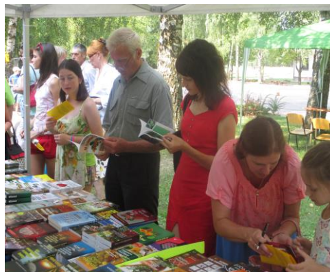
Daugavpils novada 14. Grāmatu svētki Naujenē