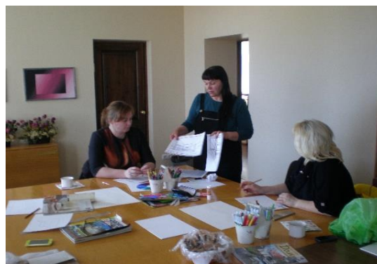
Interešu klubs "Čaklās rociņas" Ambeļu pagasta bibliotēkā

Novada pagastu bibliotēkās vasaras brīvlaika garumā tiek sastādīts skolēniem paredzētu pasākumu plāns, lai nodrošinātu nodarbības bērniem visā vasaras brīvlaika periodā. Šajā laikā iespējams nodarboties ar lasīšanu, zīmēšanu, galda spēlēm, skatīties diafilmas. Skolēniem tiek rīkoti dažādi pasākumi. Mūsdienu dzīves ritmā bērniem un jauniešiem ir grūti vienmērīgi sadalīt savus spēkus mācībās un sabiedriskajā dzīvē. Novada pagasta bibliotēkās cenšas rast netradicionālas formas darbam ar bērniem. Radošās nodarbības ir viens no aspektiem, kas izraisa bērnu un jauniešu interesi par bibliotēku. Šādās nodarbībās bērni mācās komunicēties, iepazīst cits citu tuvāk, un tas, savukārt, veicina bērnu saliedētību un interešu vienotību. Bērni sāk apzināties savas radošās spējas, un rodas vēlme tās pielietot. Pasākumu rīkošanā tiek izmantota dažāda literatūra, tādēļ bērni tiek uzmanīgi piesaistīti grāmatu lasīšanai, rodas interese par bibliotēku kopumā.