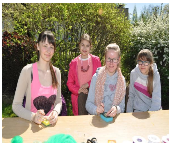
„Ģimeņu diena Līksnā”

Lai veicinātu ģimeņu saliedētību, jau piekto gadu pēc kārtas Līksnas pagasta bibliotēka sadarbībā ar Līksnas pagasta pārvaldi un kultūras namu organizēja pasākumu „Ģimeņu diena Līksnā”. Tā ietvaros dalībnieki piedalījās dažādās un ļoti interesantās atrakcijās, kurās bija vērojama ģimeņu saliedētība katra uzdevuma veikšanā. Pasākuma galvenais mērķis – radīt jauku atpūtu ģimenēm, jo ģimene ir cilvēka galvenā vērtība. Pasākumu „Ģimeņu diena Līksnā” apmeklēja 156 cilvēki.