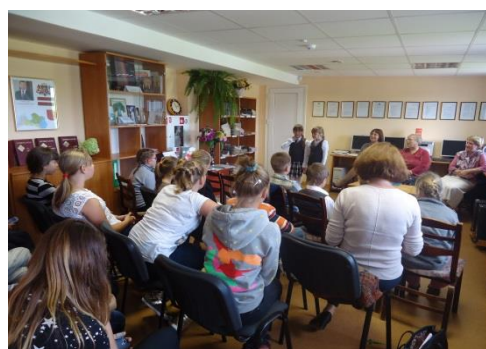
Tikšanās ar dzejniekiem Medumu un Biķernieku pagasta bibliotēkās

Medumu pagasta bibliotēkā regulāri tika piedāvātas rakstnieku un dzejnieku jubilejām veltītas grāmatu izstādes un apskati: „Raiņa un Aspazijas dzīve un daiļrade”, „Rakstniekam Mārim Rungulim – 65”, „Džanni Rodāri – 95” u.c. Oktobrī vienam no ievērojamākajiem 20. gadsimta bērnu rakstniekiem Džanni Rodāri apritētu 95 gadi. Šā notikuma ietvaros skolēni skatījās animācijas filmas, darbojās radošajā darbnīcā „Sīpoliņš un viņa draugi”, veidojot pasakas varoņus gan papjēmašē tehnikā, gan no augļiem un dārzeņiem. Noslēguma pasākumā „Ceļojums Džanni Rodāri pasaku pasaulē” piedalījās