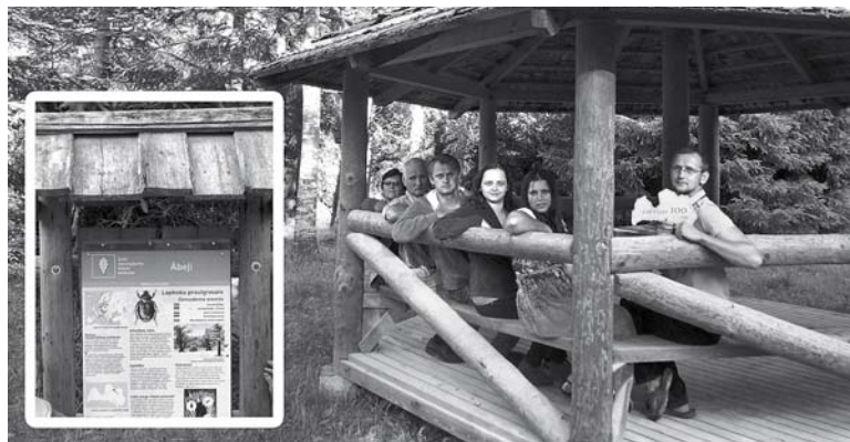
Kudlišku ģimene atpūtas vietā “Sēnīte” līdzās dabas liegumam “Ābeļi”

Esam saņēmuši bildes no Kudlišku ģimenes Ābeļu pagastā un Namiņu ģimenes Dignājas pagastā.