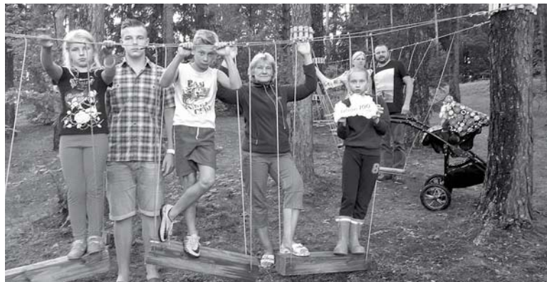
Namiņu ģimene pie meža kaķa trases Dignājas parkā

Kudlišku ģimene ir viena no retajām ģimenēm, kas dzīvo dabas lieguma “Ābeļi” teritorijā: „Izvēlējamies arī to popularizēt. Dabas liegums ir izveidots tāpēc, kad šeit ir sastopama lielākā dzeņu un dzilnu populācija Baltijā. Uz šejieni brauc ļoti daudz ogotāju un sēņotāju, kas isti neapzinās kādas dabas bagātības teritorijā te atrodas. Mēs fotogrāfējamies vienā no atpūtas vietām, kas atrodas lieguma teritorijā. Agrāk šī “Sēnīte” kalpoja arī kā pietura autobusam. Mūsu ikdiena aizrit dzīvojot šīnā dabas krāšņumā.”