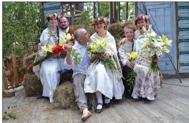
Vella kalpi un viņu daiļavas Smiltēnē