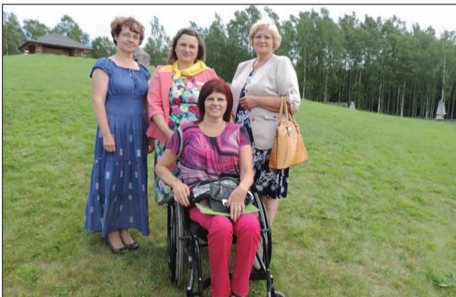
Novada bibliotekāres LBB Vidzemes nodaļas 19. saietā