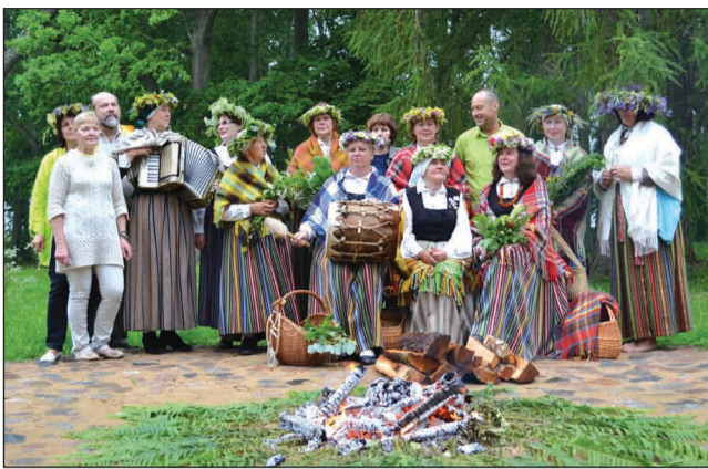
Garāko līgodziesmu ieskandina folkloras kopa "Mežābele"