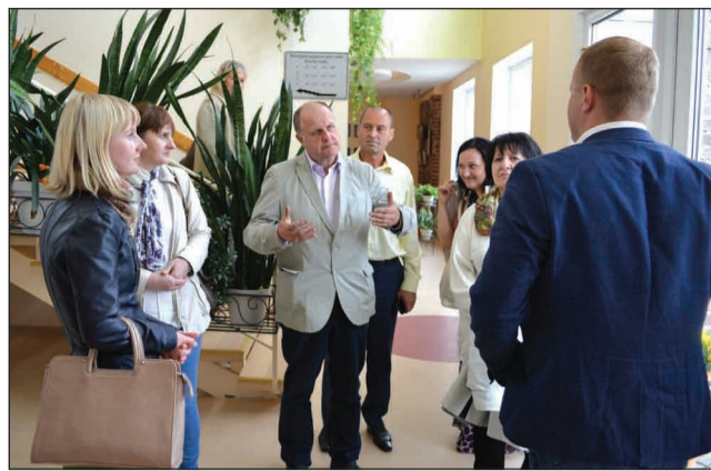
Ciemos Beverīnas novadā