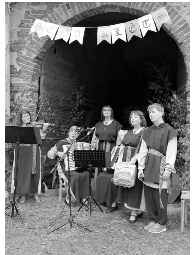
Kapela Pēterogas no Brocēniem.

Saietā 7. augustā piedalījās deviņas kapelas, uzstājoties uz trīs skatuvēm – Hāna muižā, Senajā klētī un Zaļajā pļavā. Pēc kapelu sadziedāšanās sākās jautrais tirgus pagasta estrādē. Tirgoties bija sabraukuši gan pašu, gan kaimiņu pagastu mājražotāji un amatnieki, un sanākušie varēja priecāties par Zemuru trušīšiem, Pilskalnu aitiņām, Magonu kaziņām un putniem. Visi, kuri vēlējās, varēja vizināties zirga pajūgā, ko nodrošināja biedrība Eguss . Tirgus atmosfēru jautrāku radīja Ābrams un čigānietes – ikviens varēja savu nākotni izziļēt vai kādu lakatiņu nopirkt. Stiprākie vīri pēc dāvanām varēja rāpties stabā. Fonā skanēja