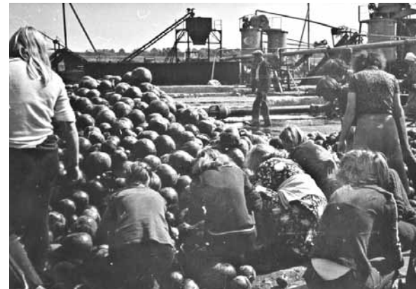
Kuldīgas 2. vidusskolas jaunie novadpētnieki Ukrainā Hersonas apgabalā Latviešu sarkano strēlnieku vārdā nosauktajā kolhozā palīdz ražas novākšanā.