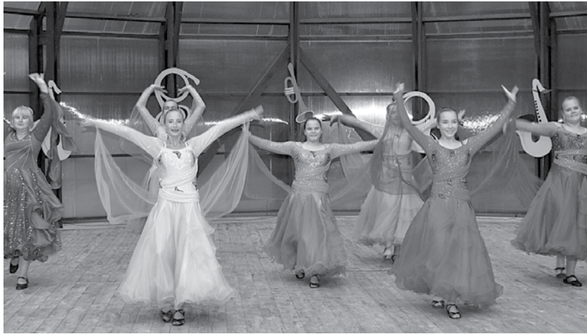
Kuldīgas Jautrie zābaciņi Turlavas estrādē uzstājās skaistajās valša kleitās.