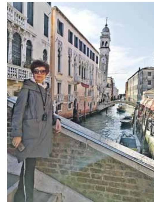
Kur nu bez ceļojumiem! Šoreiz Venēcija.