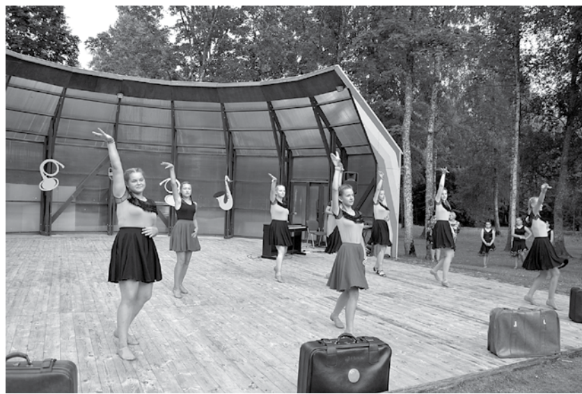
Dejotprieku ar aicinājumu nākt un piedalīties izrāda Turlavas jauniešu līnijdeju kolektīvs.