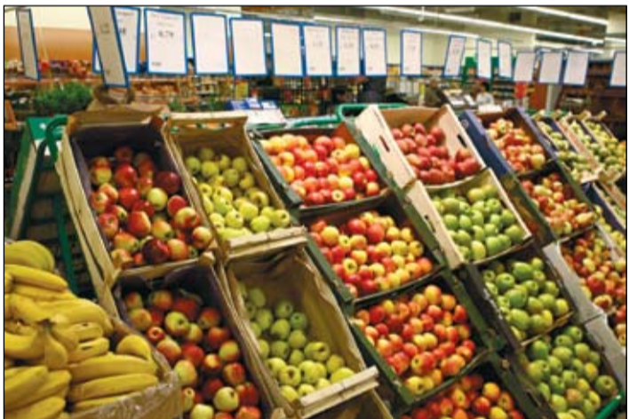
Pirmās šķiras augļi pircēju vidū ir krietni pieprasītāki par augstākā labuma. Tas tādēļ, ka tiem ir zemāka cena, taču garšas ziņā neatšķiras. Būtiskākā atšķirība – augļu izmērs.