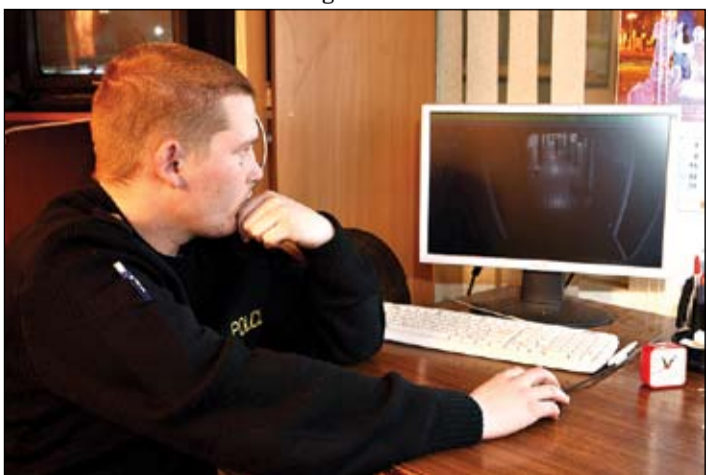
Pašvaldības policisti cauru diennakti monitoros seko līdzī nokošajam Stacijas ielas 13. namā.