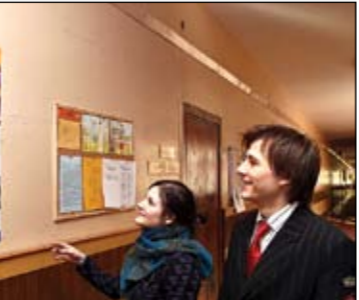
Ari valsts domā par jauniešu karjeru, skolās izvietojot informāciju par dažādām profesijām.

Ja domājāt, ka reizē apmeklējot Karjeras pakalpojumu kabinetu, kāds no speciālistiem jums pateiks: tu būsi medmāsa, pārdevējs vai frizieris, rūgti maldāties. Izrādās, ka tur var noskaidrot, kas tevī interesē un uz ko būtu vērts tiekties, taču izvēle par nākamo profesiju jāizdara pašam.