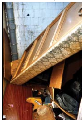
Koplietošanas telpa Stacijas ielā 13.

esot labi. Vārdos viņi pateicīgi pašvaldībai, jo apzinās, ka paši saviem spēkiem neizķepurotos, taču darbos rāda pretējo. Vienā no stāviem sastaptā sieviete, jautāta par pagājušās nakts jandāliņu, tikai atsaka: jā, dzirdēju tādu mazliet skaļāku mūziku. Pati uzdzīvē nav piedalījies, taču istos nakts miera traucētājus arī neatklāj. Pašvaldības policists atzīst, ka arī tā te ir ikdiena – viens otru nenodod, un tas pamatīgi traucē policijas darbu. Kāds kādam draud, uzbrūk, policija rīkojas, taču cietušais visbiežāk atsakās rakstīt iesniegumu policijā. Uz jautājumu, ja jau viņi paši nav