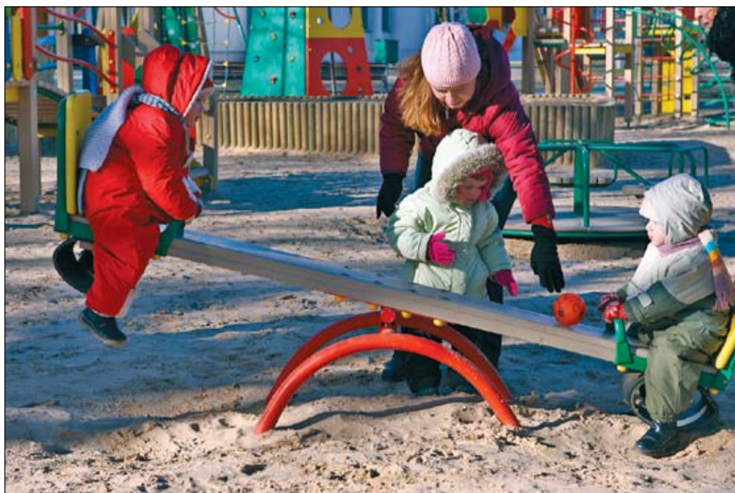
Jauki, ja dienu kopā ar bērnu māmiņa var pavadīt pati, taču dažādu apstākļu dēļ nereti vecāki spiesti mazuli uzticēt auklītei. Viņi ir vienprātīgi – bērna pieskatīšanā priekšroka noteikti būtu auklei ar atbilstošu prasmju apliecināšanu dokumentu.