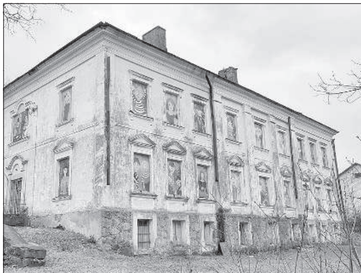
Вилянское поместье (2019).

зом Матросова. В Вилянах ставили палатку и что-то делали. Что уже не помню, помню только название - остров Лакстигалу!