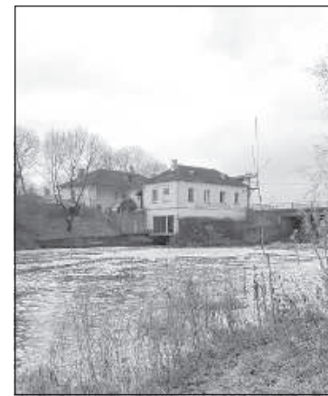
Река Малта и Вилянская ГЭС.

О жизни в Вилянском монастыре рассказывает священник Болеслав Звейсалникс (1927–1993) в своей книге «Потерянные годы». 3 После Второй мировой войны его приняли