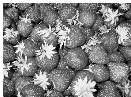
Latvijas gardās zemenes.

vietās ar saviem priekšnesumiem uzstājās ne tikai latvieši, bet arī citu tautību pārstāvji – no japāņiem līdz lietuviešiem. Tie dziedāja, dancoja, mūzicēja, pat rādīja teātri. Tajā pašā laikā tirgotāju teltīs visu nedēļu pārdevēji piedāvāja Latvijā pašu ražotās preces. Bija kūpinātas desas, gaļa un zivis, bija sieri, maize, medus, Jāņu zāles, ziedi un visāda veida rokdarbi. Ap to laiku bija arī zemeņu laiks, tad jau katru dienu bija jāiet uz “Disney World” jeb Rīgas Centrāltirgu, lai nopirktu pa litram Latvijas svaigās, garšīgās zemenītes.