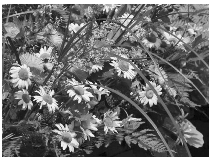
Jāņu zāles Doma laukuma tirgū.