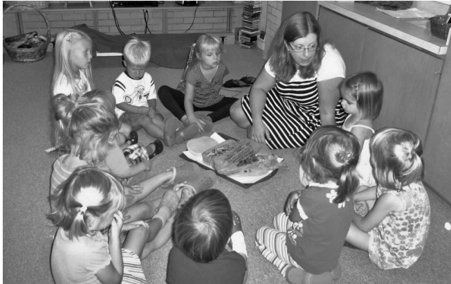
Andārte ar bērniem aplīti.

6201 W. Peterson Ave. / Chicago, IL 60646, tālr.: 773-308-4977