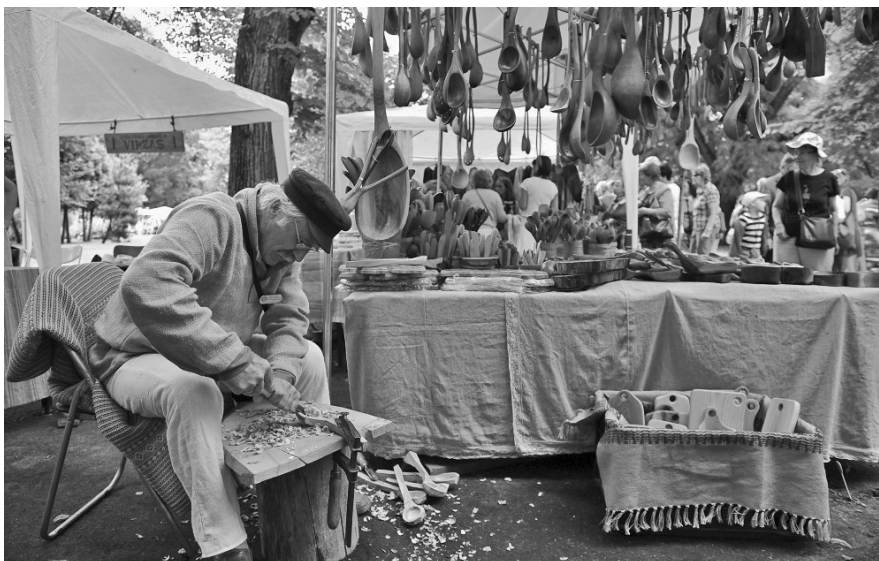
Vērmanes dārza tirgū varēja pat pirkt uz vietas ražotu preci.

Visu svētku nedēļu biju aizņemts ar kultūras smelšanos. Doma laukumā, Esplanādes un Vērmaņa dārzos bija uzceltas vairākas pagaidu skatuves, un visās šajās