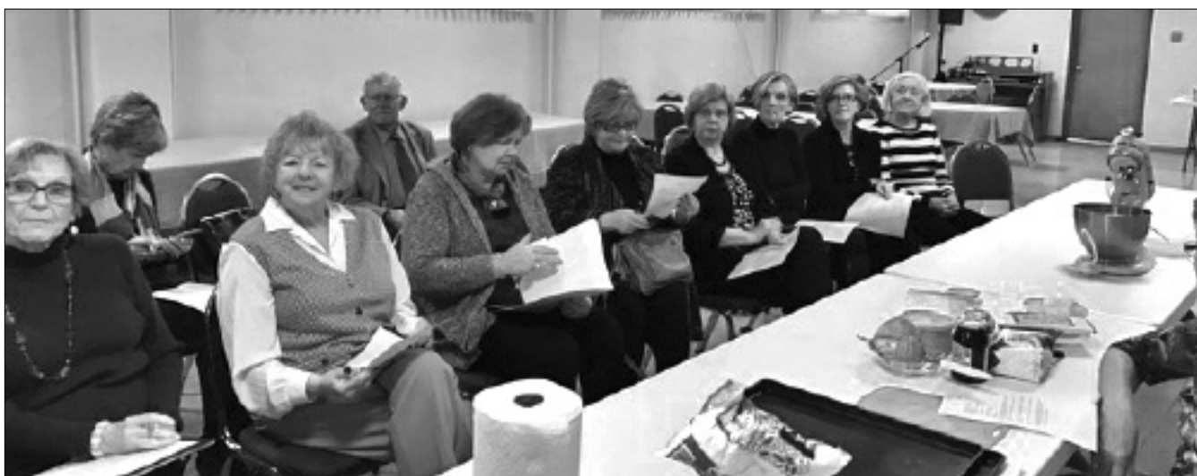
Pavārklases – Aleksandra kūkas dalībnieki Sv. Pēterļa draudzes lejas stāvā.