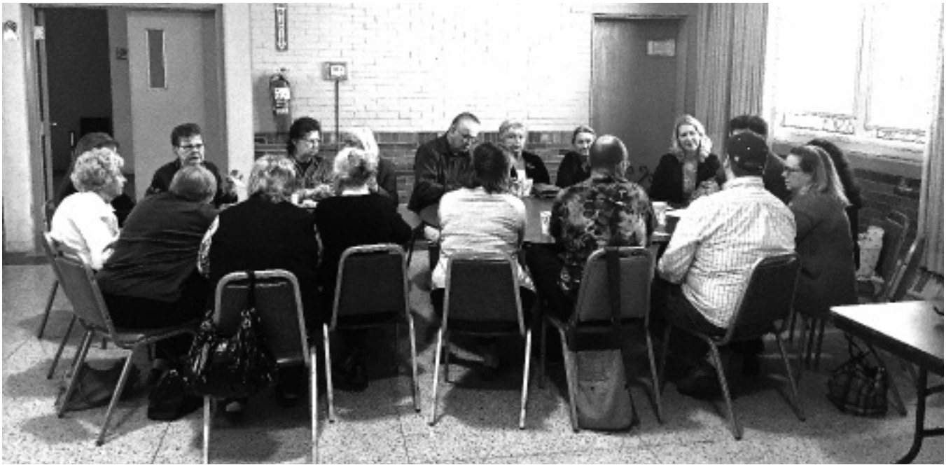
Darba grupas Tautas sapulces laikā. Tautas sapulces dalībnieki 18. februārī tika sadalīti vairākās grupās un pārrunāja kādu no uzdotajiem jautājumiem.