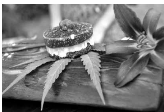
Vegāniskā siera kūka ar avenēm: vidū kokosrieksti un Indijas rieksti, pamatnē dateles, saulespuķu sēklas un nātres.