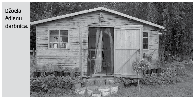
Džoela ēdienu darbnīca.