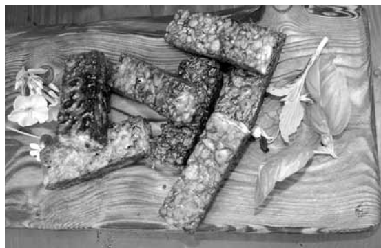
Indonēziešu sojas vai graudaugu ēdiens tempe latviskā variantā.