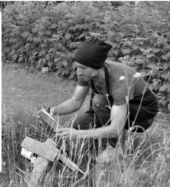
Džoelam Burdallam no Anglijas Latvija kļuvusi par dvēseles zemi.