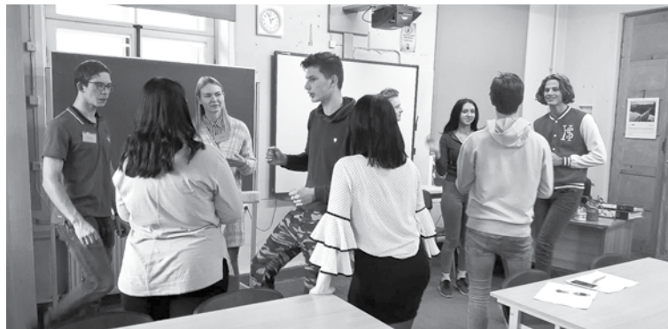
Projekta nodarbība tehnikumā. Vecākie audzēkņi darbā ar jaunākajiem.

Vadības programma SLEVET balstās uz kaskādes veida mācīšanās un ilgtspējības principiem. Programmas sākumā tiek apmācīta pirmā grupa – vecāko kursu audzēkņi. Kad tie mācības ir beiguši, viņi kļūst par mentoriem citām, jaunāko kursu, grupām. Savukārt skolotāji ir koordinatori, kuri apmācību pārbauda, atbalsta audzēkņu gatavo-