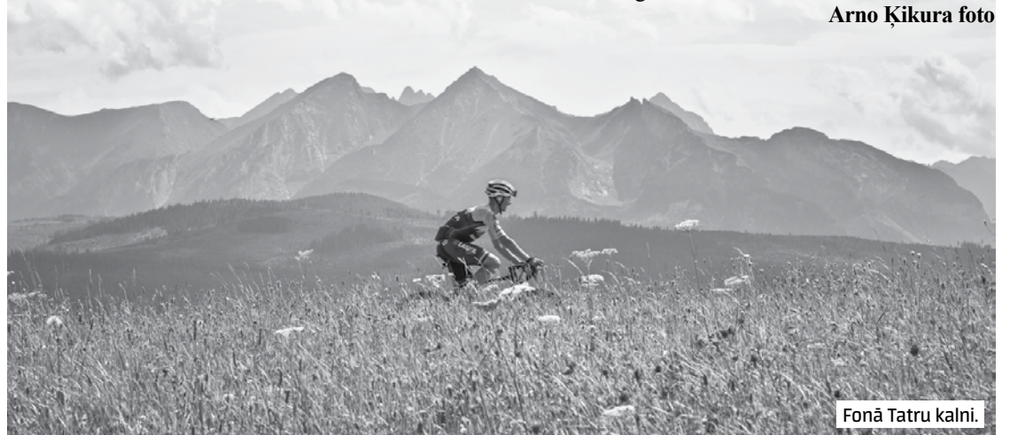
Fonā Tatr kalni.