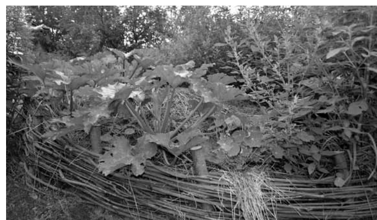
Apalās dobes – ērts veids dārzu audzēšanai.