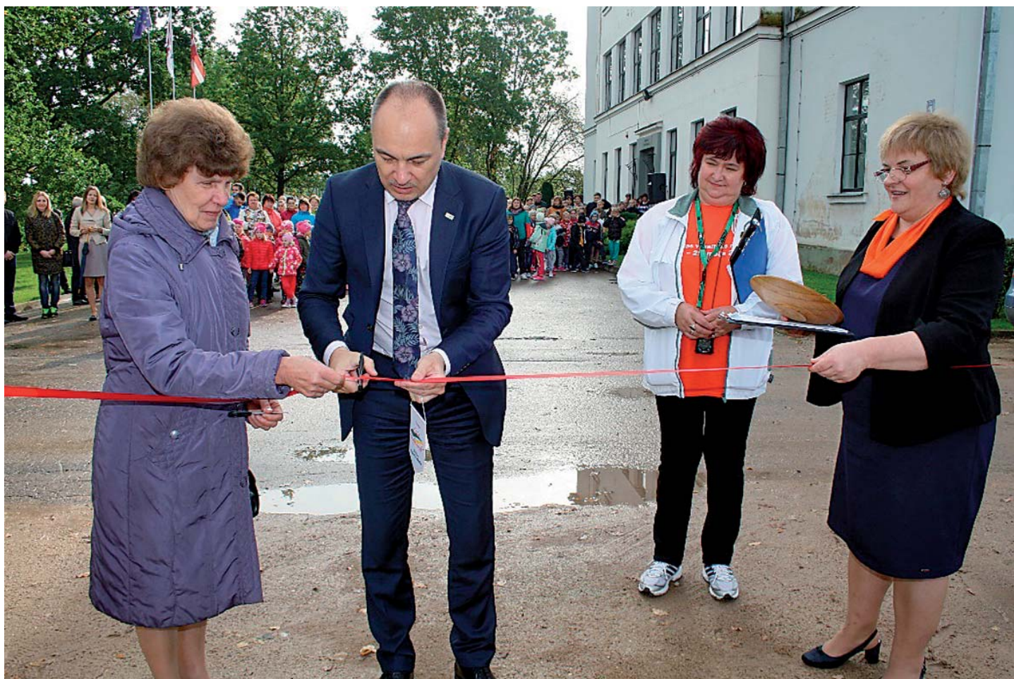
Svinīgi atklāj atjaunoto Aknīstes vidusskolas stadionu.