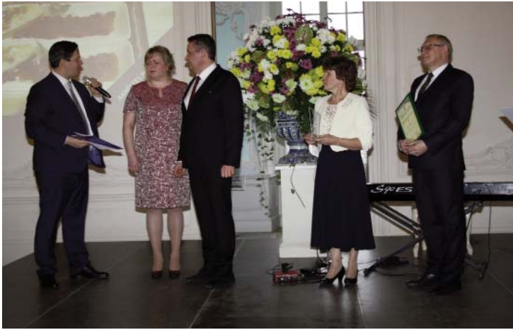
Turpinājums no 1.lpp.

IK "Alens S" veiksmīgi pilnveidojot uzņēmējdarbību, devis neizmērojamu ieguldījumu pašvaldības un novada attīstībā. Uzņēmums nodrošina piecpadsmit darba vietas, sniedzot ēdināšanas un celtniecības pakalpojumus. Pēc daudzu gadu nomas, nu privātīpašumā iegūtas kafejnīcas, viesību zāles un viesnīcas telpas. Tās ir izremontētas un gaumīgi noformētas. Kafējnīcā iespējams kārtīgi paēst, atzīmēt dažādus dzīves notikumus. Šogad tika atklāta viesnīca, kurā iespējams nodrošināt nakšņošanu 30 personām.