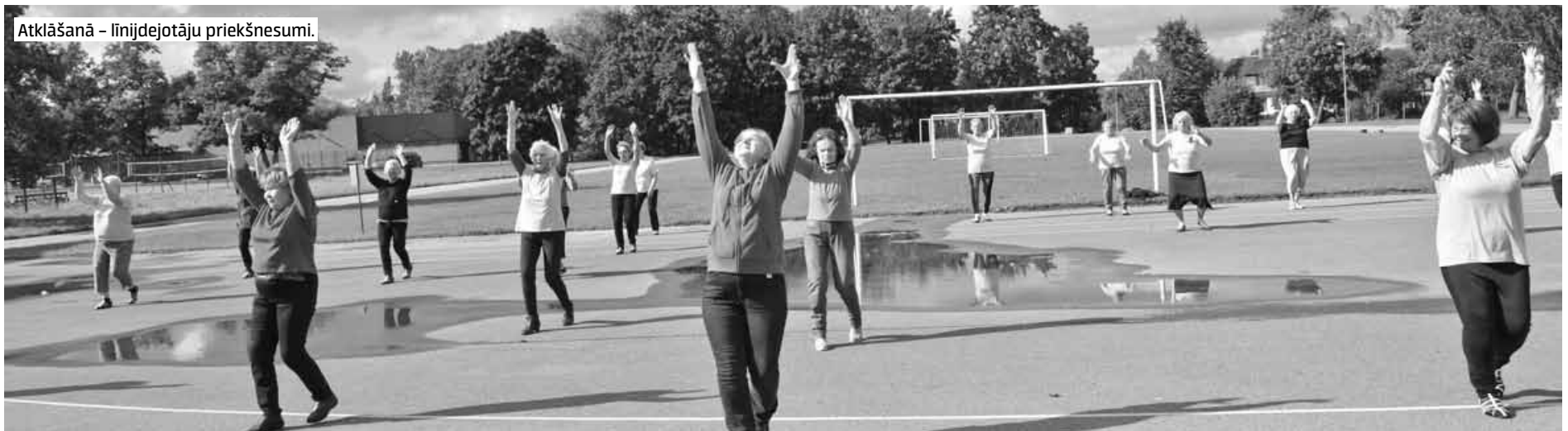
Atklāšanā – līnijdejošu priekšnesumi.

Novada senioru veselības un sporta dienā V.Plūdoņa Kuldīgas vidusskolas stadionā iesaistījās vairāk nekā 80 dalībnieku.