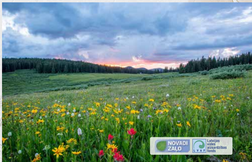
Avots: Dabiskās pļavas un ganības. Aizsargājamo biotopu saglabāšanas vadlīnijas Latvijā. 2017