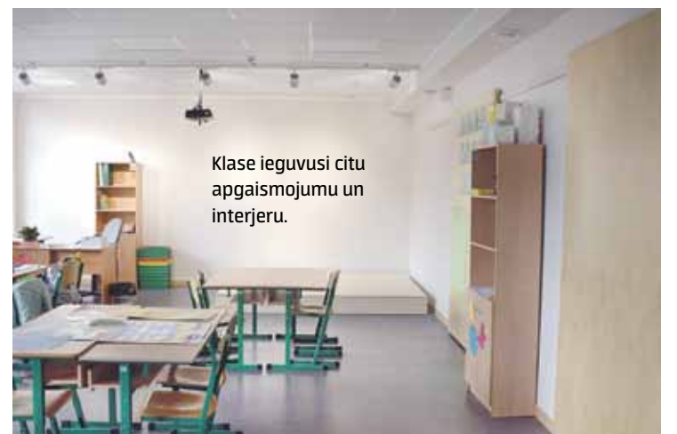
Klase ieguvusi citu apgaismojumu un interjeru.