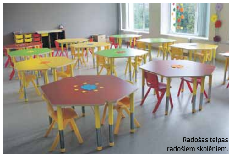
Radošas telpas radošiem skolēniem.