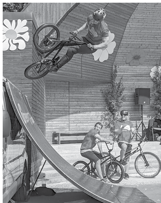
Ekstrēmā velokomanda Green Trials no Rīgas rādīja, ko spēj ar divriteni.