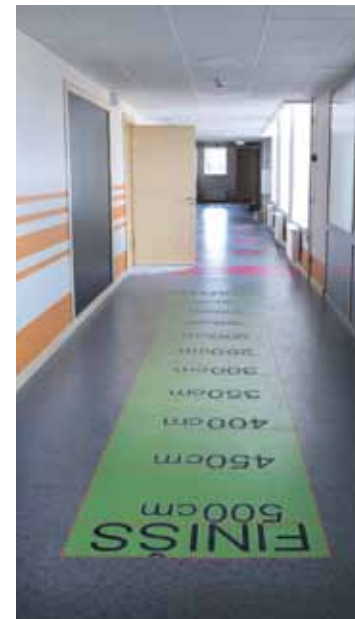
Pievilcīgāki kļuvuši gaitenī – tie ļauj arī kaut ko jaunu iemācīties.

Centra vidusskolas remonts sācies šajā vasarā. Pēc pašvaldības