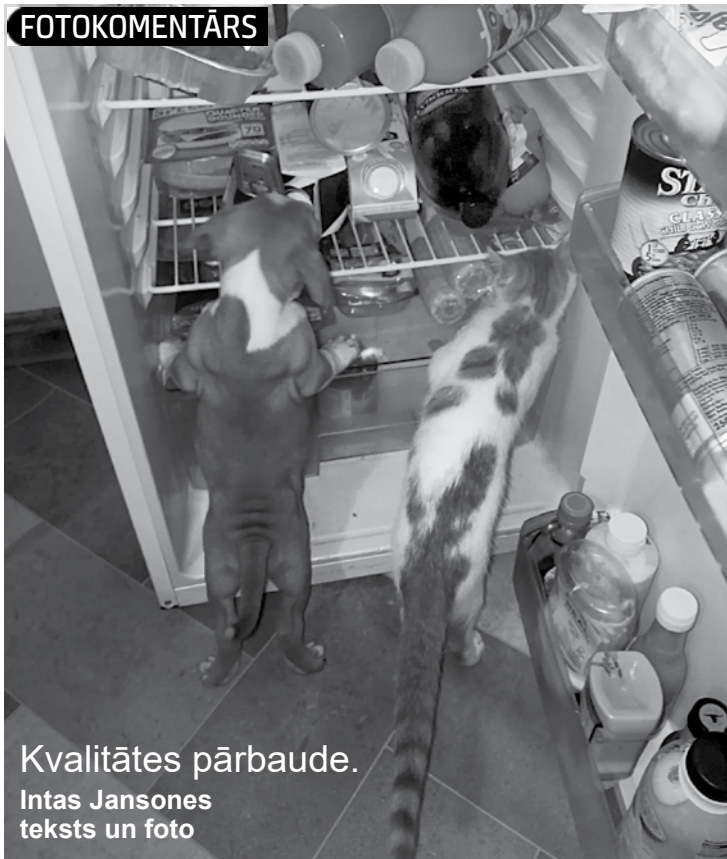
Kvalitātes pārbaude.