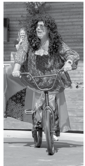
Čigāniete Zina šoreiz pārliecināja, ka ne tikai visu zina, bet arī prot mīt pedāļus.

slimojušajiem ar apliecinājumu un pārējiem. Neviens neiebilda un uz diskrimināciju nenorādīja. S. Gailuma piebilst, ka rendernieki esot saprotoši: veselība un drošība ir svarīgāka, tad arī varēs notikt pasākumi.