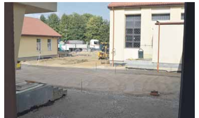
Tiek pārbūvēts pagalmis, un būs vēl viena ērta ieeja.

ziņām, no visiem trim mācību vides uzlabošanas projektiem tas ir visapjomīgākais. Taču šis mācību gads skolēniem un pedagogiem, kā arī tehniskajam personālam jāpavada citur. Vēl augusta vidū precīza plāna nebija, jo ilgi tika meklētas atbilstošas telpas, lai mazāk vajadzētu pārvietoties. Īpaši skolotājiem tas sarežģī darbu, ja jāskraida pa vairākām vietām, un tas nav labi arī no drošības viedokļa.