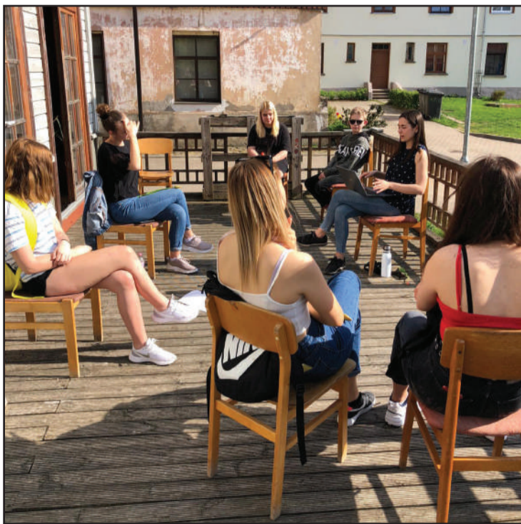
IDEJU MĀJAS jaunās identitātes veidošanas pasākums