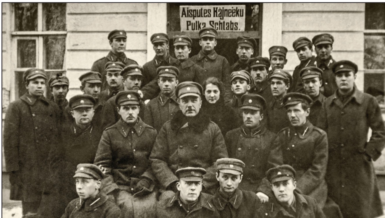
Atrastais vēsturiskais foto, kas ierosina dokumentālās filmas ideju

18.jūnijā, ievērojot visas epidemioloģiskās prasības, notika Aizputes novada domes finansētas dokumentālās filmas "Bermontiāde: Aizputes stāsts. 1919-1940" pirmizrāde. Dokumentālā filma ir vēsturisks stāsts par 10. Aizputes kājnieku pulku vēstures likločos. Filmas režisors - Bruno Šulcs.