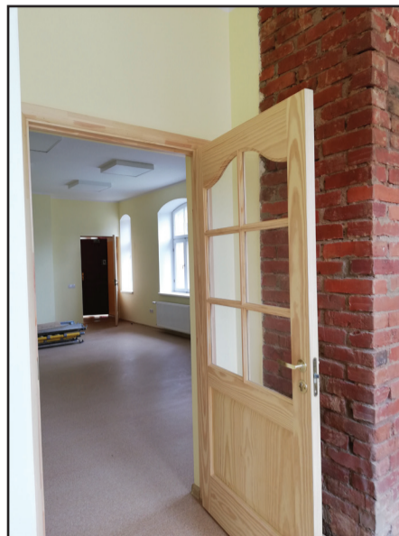
Telpas pēc remonta

Aizputes Mūzikas skola 2020. gada nogalē saņēma ziedojumu 5200,00 EUR apmērā no Vācijas Federatīvās republikas fonda "Rieven Stiftung" Vācijas luterāņu mācītāja Klaus Lofta uzdevumā. Par šo ziedojumu tika iegādāts profesionāls Itālijā ražots 120 basu akordeons