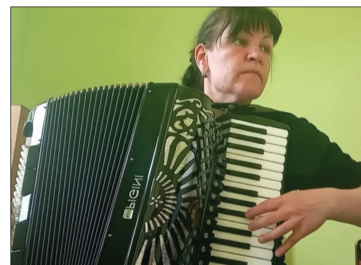
Mūzikas skolai jauns akordeons un izremontētas telpas >>> 4.lpp.