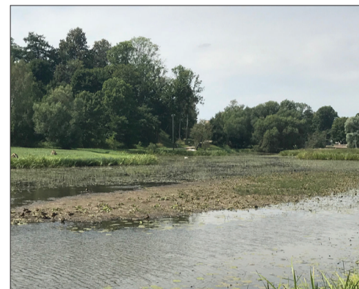
"Dzirnavu dīķis" iegūs jaunu elpu >>> 3.lpp.

Aicinām Aizputes novada tuvākos un tālākos iedzīvotājus pāršķirstīt vecvecāku albumus, varbūt izdodas atrast liecības par 10. Aizputes kājnieku pulku (bilbes, vēstules u.c.) un dalīties ar šīm liecībām Aizputes novadpētniecības muzejā, lai izveidotu izstādi par 10. Aizputes kājnieku pulku.