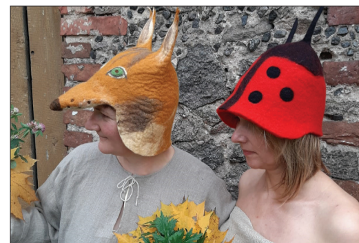
Notiks meistarklases vilnas veļšanā un masku taisīšanā