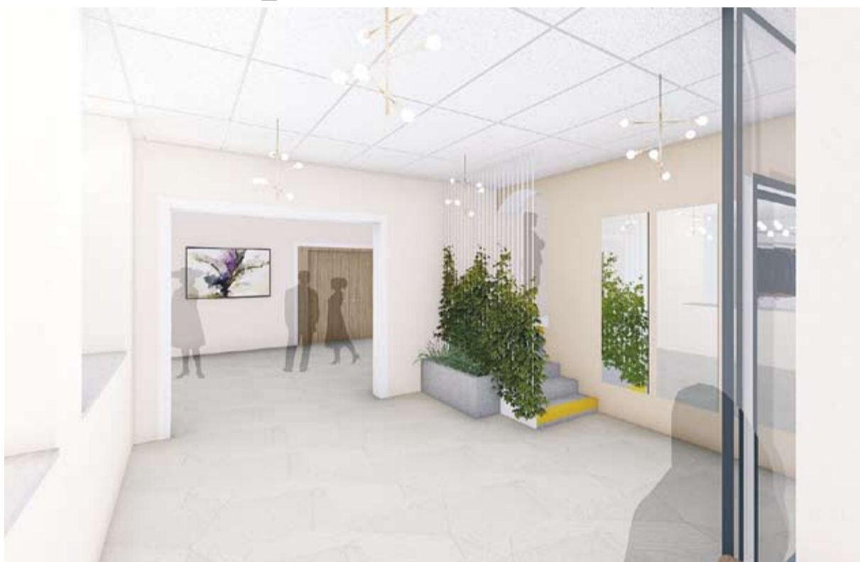
SIA „Arhitektūras dizaina studija” rasējums.

2021. gada 10. februārī Alojas novada dome un SIA „Arhitektūras dizaina studija” noslēdza līgumu par projekta izstrādi Vilzēnu tautas nama vestibīla un sanmezglas pārbūvei par kopējo līguma summu EUR 11962,06 ar PVN. Tautas namā 2020. gadā ir veikts skatītāju zāles kosmētiskais remonts. Šobrīd ir plānots renovēt ieejas halles, garderobes un sanitārā mezgla telpas. Šīs telpas ir ne tikai vizuāli nolietotas, bet