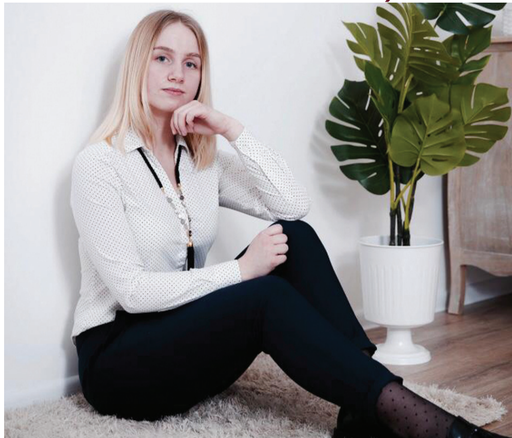
► Sākums 7. lpp.

– Ko šobrīd dari? Kāda ir tipiska tava nedēļas diena?