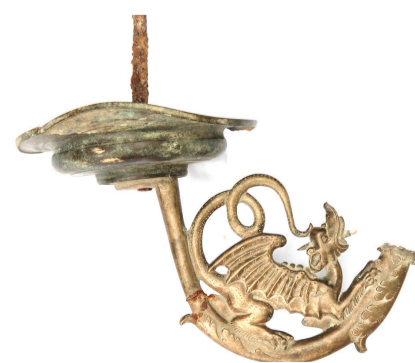
Talkā atrastais 17. gadsimta svečtura fragments ar pūķa tēlu.