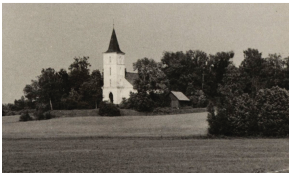
Lielaucē baznīca no Auces puses pirms 100 gadiem.