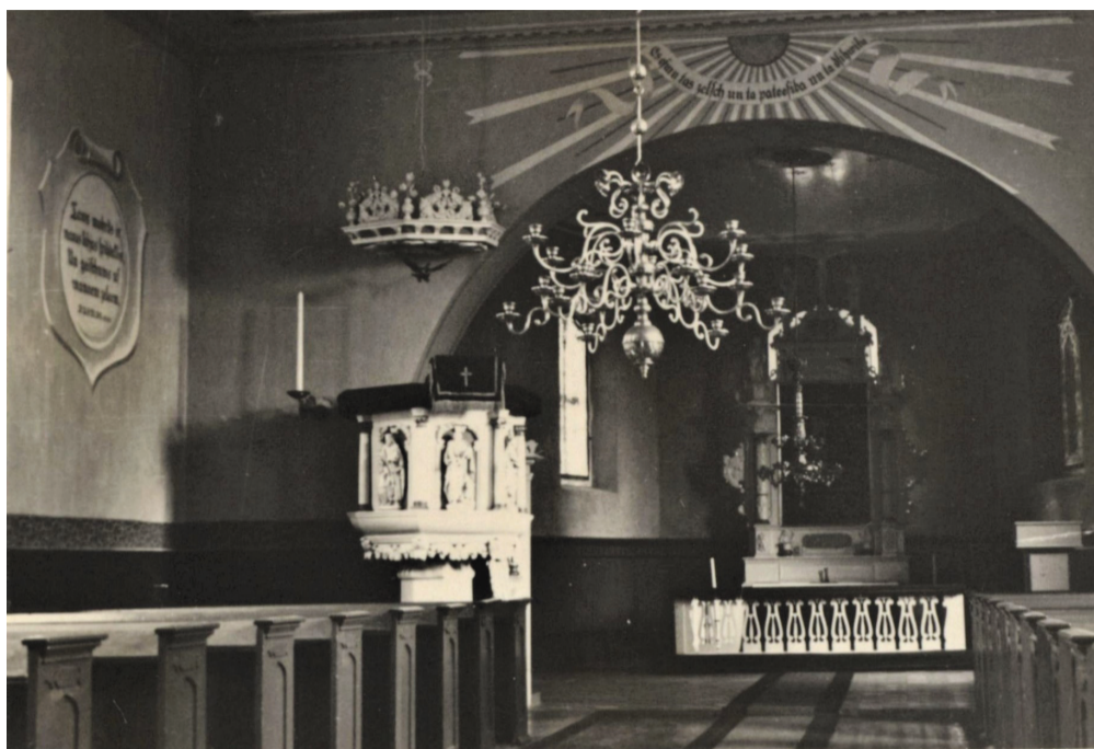
Lielaucē baznīcā koka soli ar 500 sēdvietām, divi kroņlukturi, Kurzemei neraksturīgi grezni altāris un kancele.

Tādējādi no baznīcas vērtībām saglabājušies ir tikai zvans un nupat atrastais svečturis. 1927. gadā zvānu izlēja vācu tēraudlīšanas