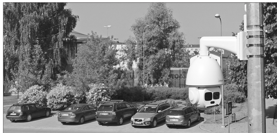
Papildus 65 jau esošajām videonovērošanas kamerām vairākās vietās Aizkraukles pilsētā un pagastā iegādāsies vēl 25 kameras.

Projektā LLI-457 "Dzīves apstākļu uzlabošana trūcīgajā pārrobežu reģionā, veicinot drošas un atbildīgas sabiedrības veidošanos"/"Droša sabiedrība" kopējais Aizkraukles novada pašvaldībai piešķirtais finansējums ir 118 083.97