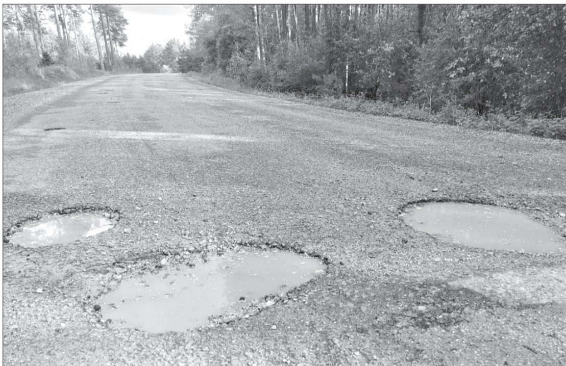
Pašvaldība regulāri saņem jautājumus par valsts autoceļa Piltene–Zlēkas raksturo bedres.