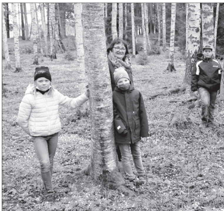
7. maijā iestādījām septiņus ozoliņus.

Pirmais savu ozoliņu iestādīja Aleksis Anševics.