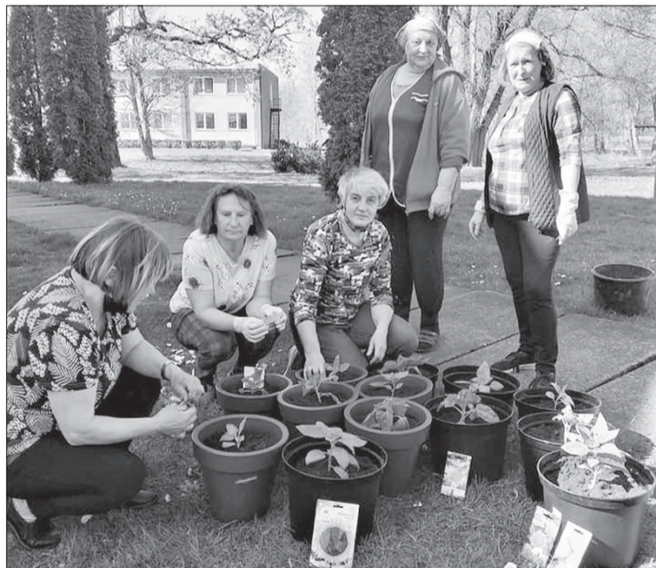
Piltenes vidusskolas tehniskās darbinieces saulgriezes iestādīja 15 podos.