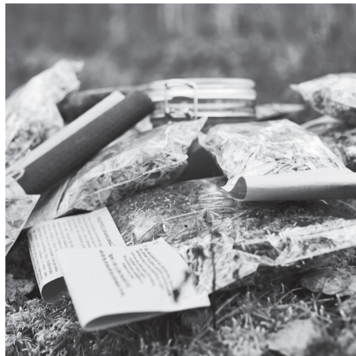
Z/s "Bitnieki" bišu ganību meža pļavās ievāktas zāļu tējas.