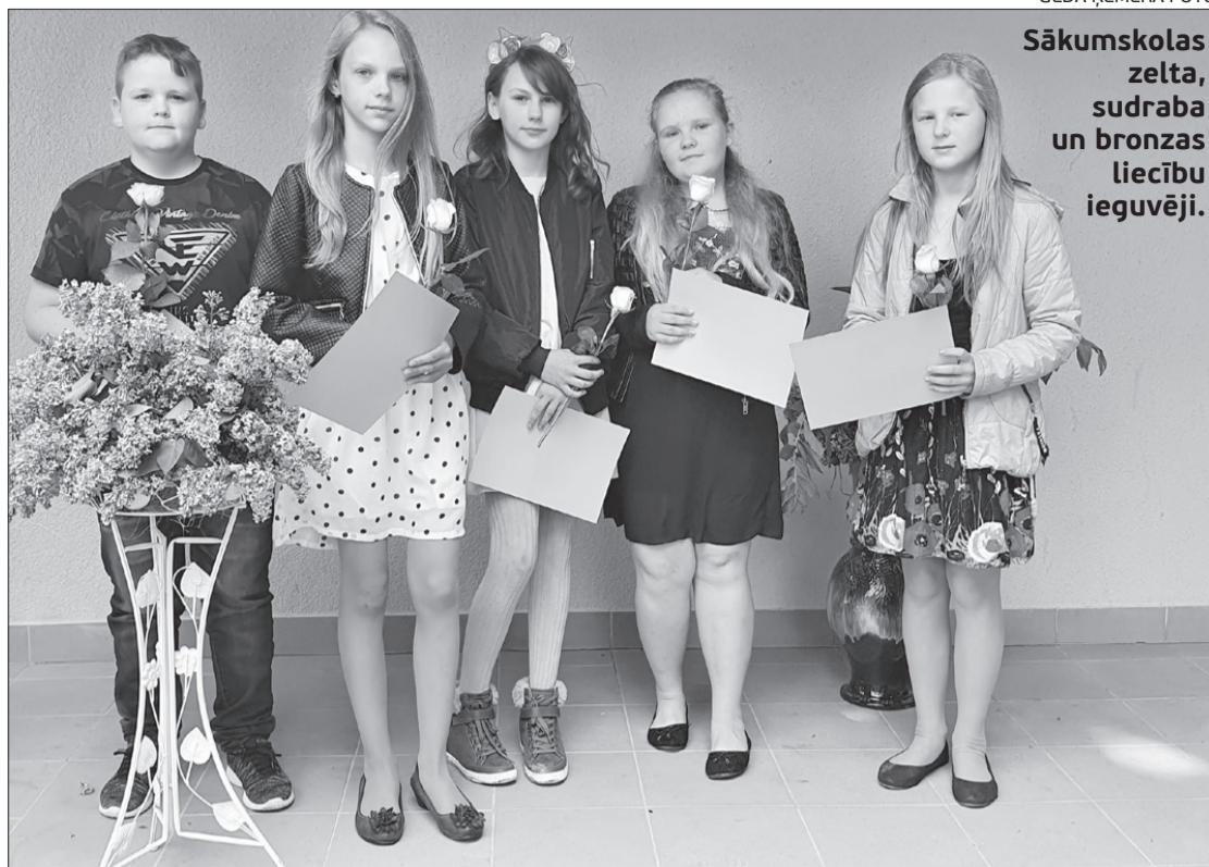
Sākumskolas zelta, sudraba un bronzas liecību ieguvēji.

"Viss atkarīgs no mums pašiem. Vai mēs esam kā komanda (skola, bērni un vecāki), kurai ir skaidra vīzija par uzvaru (sekmīgām atzīmēm), katrs parādām savu labāko "es". Trenerim (skolotājam) ir jāizskaidro, kā iegūt pēc iespējas labāku rezultātu, un jāmotivē cīņai. Vecāki ir kā līdzjutēji – nodrošina sportistiem mierīgus darba apstākļus un vitamīniem bagātu maltīti, atgādina par atpūtas pauzēm svaigā gaisā un pilnvērtīgu miegu. Viņi ir tie, kas nekad neļauj pagurt un mierina sakāves gadījumā. Attālinātais mācību process lika apgūt jaunās prasmes pašiem, izmantojot mobilo telefonu un veidojot stundas un