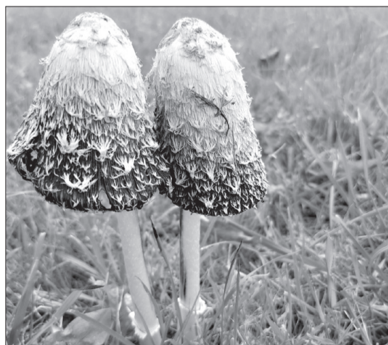
Tintenes. Latvijā sastopamas 23 sugas. Ēdamas ir divas no tām.