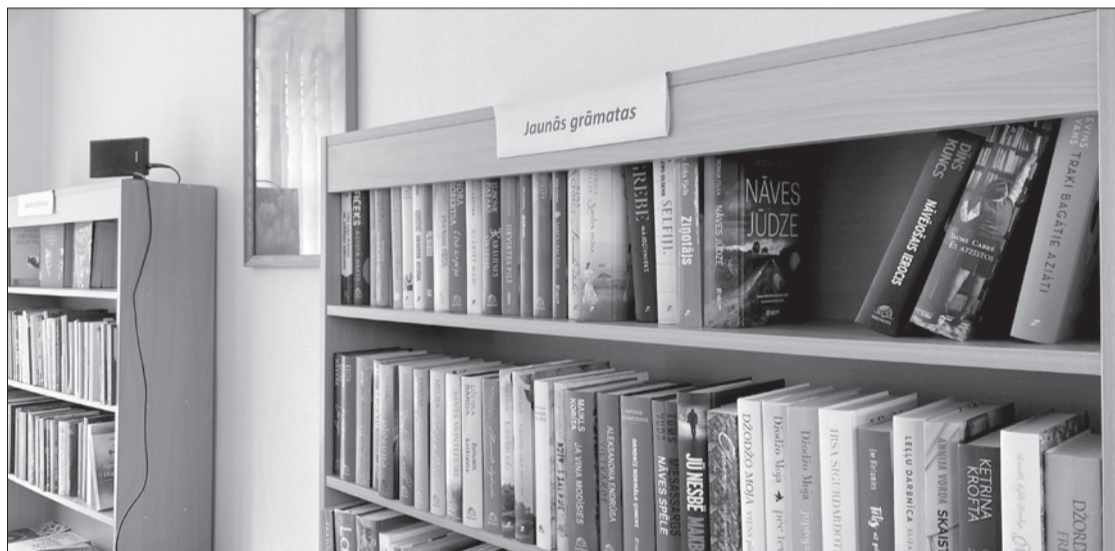
Pēc remonta Popes bibliotēkā iegādāti arī jauni plaukti.