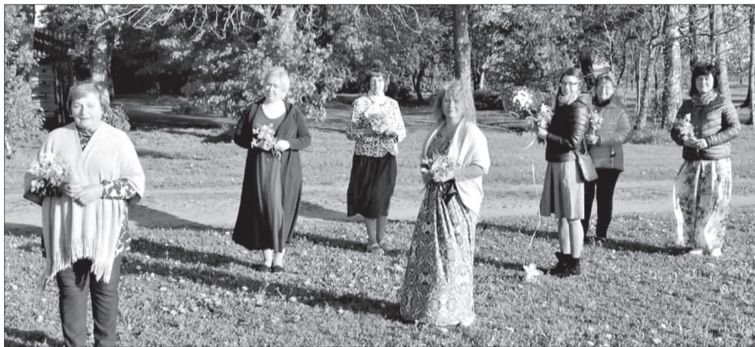
Gaviļniecības – sieviešu vokālā ansambļa “Saiva” dziedātājas.