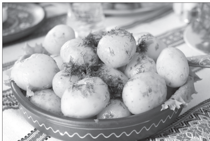
Novada iedzīvotāju iecienītākais ēdiens ir kartupeļi – vārīti, cepti, arī biežputra.