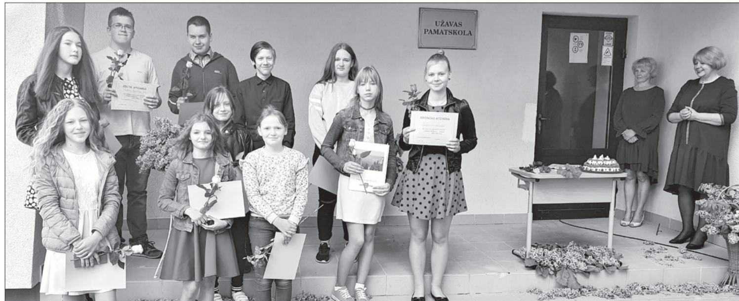
Labākie 5.-9. klašu audzēkņi.