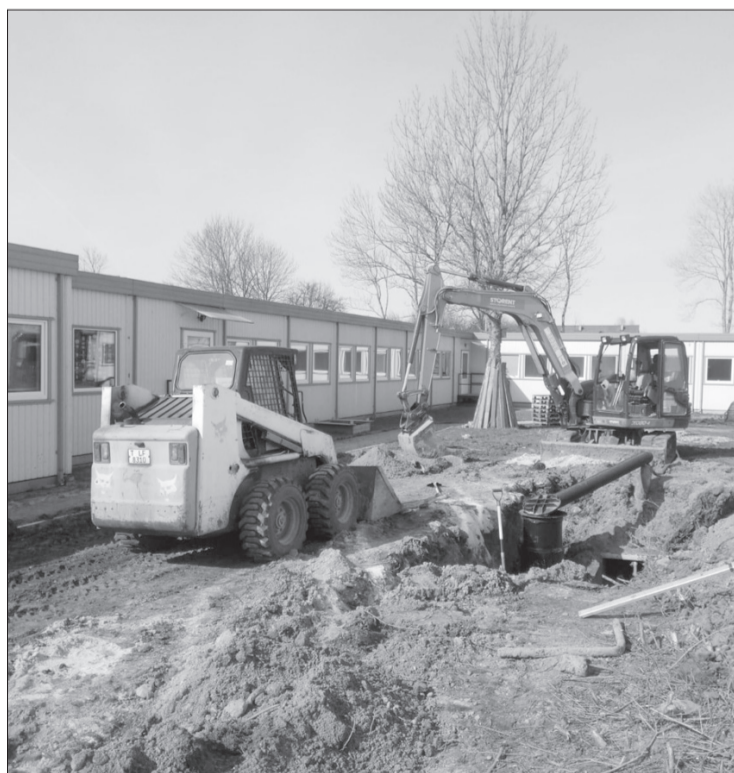
Ir uzsākta Tārgales skolas apkārtējās teritorijas labiekārtošana.

Atbalsta Zemkopības ministrija un Lauku atbalsta dienests