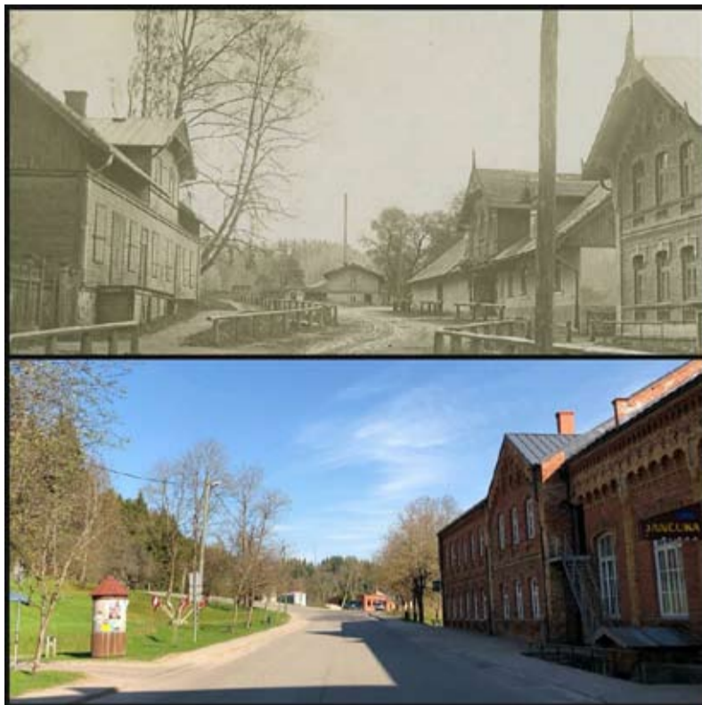
Līgatnes kultūras nams tagad un agrāk - 20. gs. sākumā. Pa labi - biedrības nams, Līgatnes krogs, tālumā - Anfabrika.