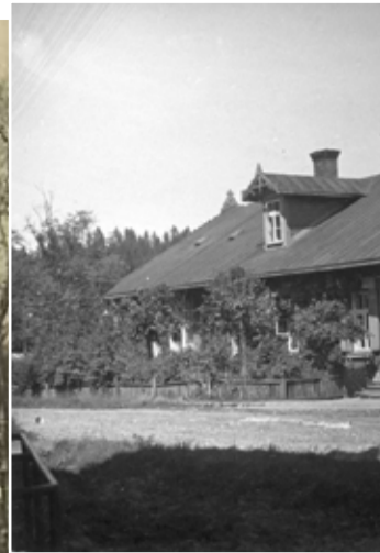
Aptiekas ēka, uz