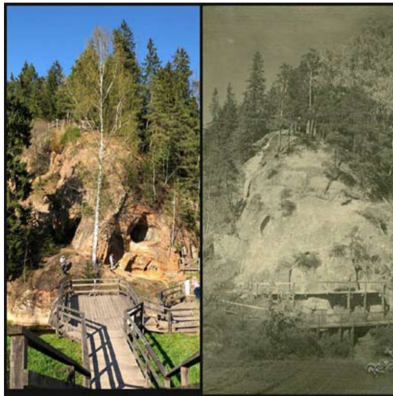
Lustūzis tagad un agrāk - 1930. gados.

izmantota otra Līgatnes papīra fabrikas bibliotēka, kura bija iekārtota bērnu un dzemdību namā "Wilhelma" pie "Slimnieku kases pie Līgatnes papīra fabrikas", ko 1924. gada 22. janvārī pārdēvēja par "Līgatnes papīra fabrikas slimnīcu". Bibliotēkai atjaunotajā kultūras namā tikušas ierādītas trīs telpas.