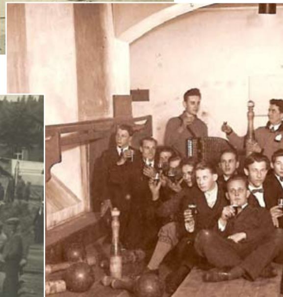
Bumbotavā, 1930. ga