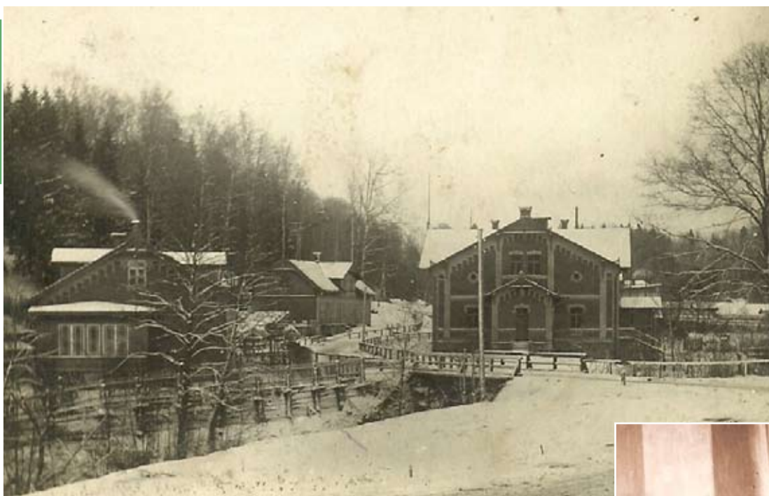
Līgatnē 1900. gadu sākumā. Pa kreisi - aptieka, vācu skola, pa labi – biedrības nams.

“1897. gadā – līdz ar Līgatnes papīra fabrikas Biedrības nama, jeb, kā tagad teiktu, kultūras nama celtniecības nobeigšanu, tā augšējā stāvā bijusi iekārtota bibliotēka un lasāmgalds. Bibliotēkā sākotnēji