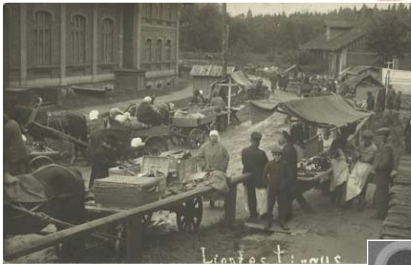
Līgatnes tirgus pie biedrības nama un aptiekas, 1930. gadi.