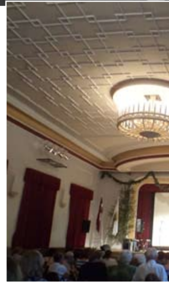
Līgatnes papīrfabrikai – 2000. Ra.