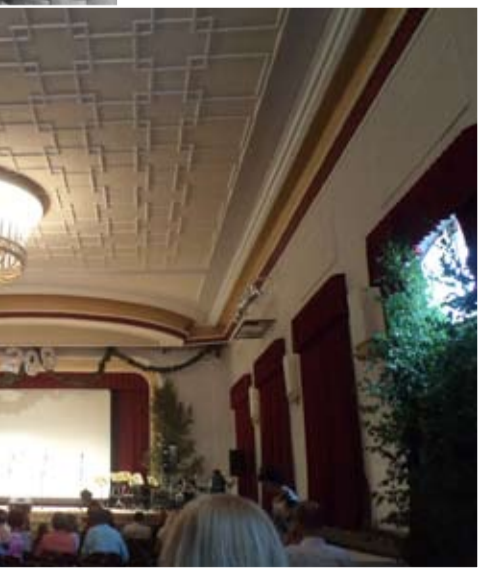
0. Lielās zāles lustras 2015. gada 8. augustā.

Kā redzam pēc kultūras nama augststāva plāna, tad blakus bibliotēkai bijusi iekārtota biljarda istaba. Kā rakstīts 1901. gadā izdotajā Rīgas rakstāmpapīru akciju sabiedrības hronikā, tad bibliotēka pastāvīgi tikusi papildināta. Nav zināms, cik grāmatu bibliotēkā bija 1944. gada 23. septembrī, kad vācu armija atkāpjoties kultūras namu izpostīja. Pēc Otrā pasaules kara, kultūras namu atjaunojot, tam uzcelts pagarinājums uz bijušā Līgatnes kroga pusē, un, kā redzam, tad toreizējās bibliotēkas telpa atradusies virs tagadējām foajē telpām uz upes pusē. 1950. gadā līdz ar kultūras nama atklāšanu tajā darboties atsākusi arī bibliotēka. Sākumā tās komplektēšanai