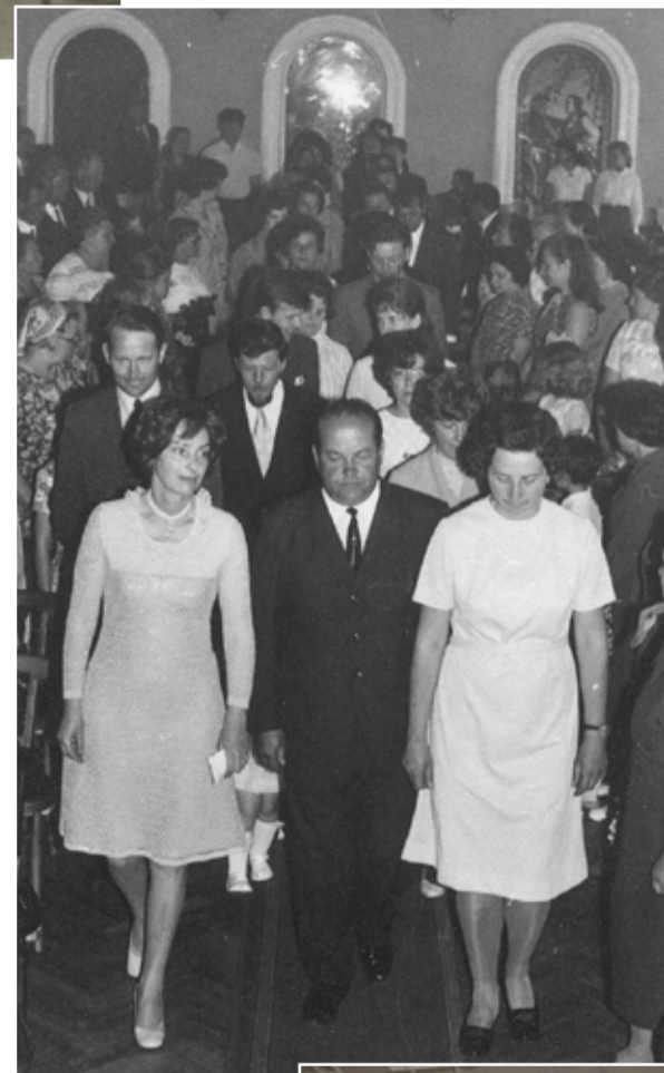
Bērības svētki kluba lielajā zālē. Vitražas, 1960. gadi.