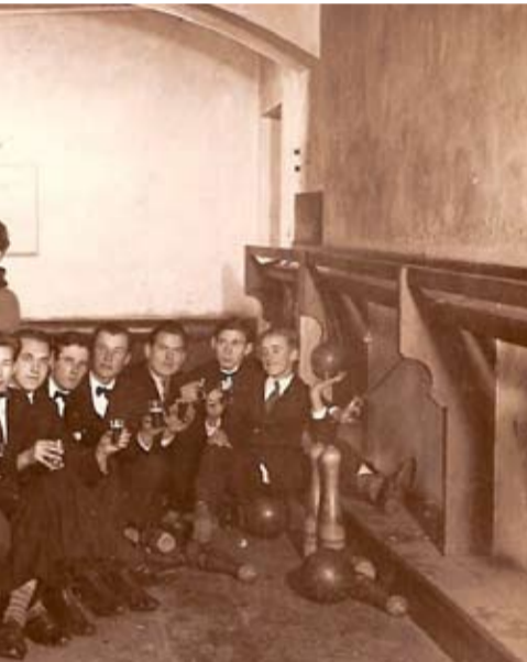
di. Līgatnes fotoarhīvs