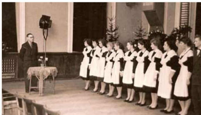
Līgatnes vidusskolas 3. izlaiduma žetonu vakars klubā 1961. gada 4. februārī.