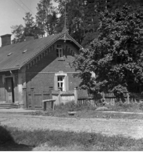
celta 1895. gadā. Foto līdz Otrajam pasaules karam. Līgatnes fotoarhīvs