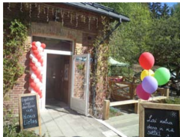
Līgatnes vīna darītavas veikaliņa atvēršana 2019. gada 18. maijā.

1944. gada septembra beigās vācieši promējot klubu daļēji sabombardēja. Vācu lidotājiem bija dots uzdevums sabombardēt visu Līgatnes ciematu un papīrfabriku - nomest trīs bumbas. Fabrikas teritorijā, koka piebūvē pie kantora ēkas tajos gados bija kroggalds, kura kontūra vēl tagad redzama uz kantora ziemeļu galu. Lai paglābtu fabriku un koka dzīvojamās mājas no sabombardēšanas, līgatnieši izgudroja plānu. Tika nokautas pāris cūciņas, kas tika audzētas kroggaldā vajadzībām turpat kanāla pakrastē, un saimnieces garšīgi pabaroja vācu lidotājus. Paēdis cilvēks ir labsirdīgs. Vienu bumbu nometa kaut kur pie tilta pār Līgatnes upi, aizdegās aptieka, kuru ar ūdens spainīšiem no ezera līgatnieši daļēji izglāba, un jaunuzbūvētā šaursliežu dzelzceļa līnija pie ezera. Otru bumbu nometa uz Anfabrikas, jo tur vairs papīru neražoja. Tika daļēji sagrauta Anfabri-