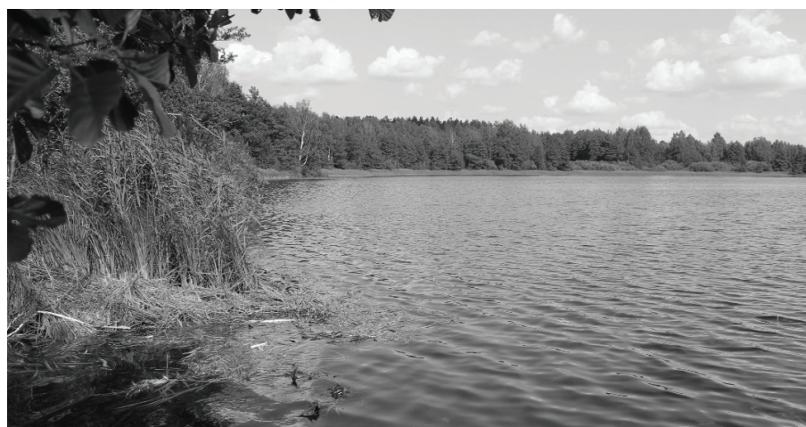
Šogad niedru pļaušana otro reizi tiks veikta septembrī, bet 2022.gadā un 2023.gadā to plānots veikt vienu reizi gadā.

stāvoklis, samazināsies dūņu slānis, stabilizēsies skābekļa līmenis, tiks novērsti zivju nosmakšanas riski. Jūtīgākās zivis skābekļa izmaiņām ir zandarti un līdakas, mazāk jutīgas ir karpveidīgās zivis. Tā kā Baltinavas novada dome 2020.gadā abos ezeros ielaida zandartu un līdaku mazuļus, ir ļoti svarīgi sekot, lai skābekļa līmenis ezeros nenokristu līdz riska robežai. Pļaušanas pakalpojumu veic SIA “Piekastes.lv”, līgumcena par četrām pļaušanas reizēm 20590,00 eiro bez PVN, 24913,90 eiro ar 21% PVN.