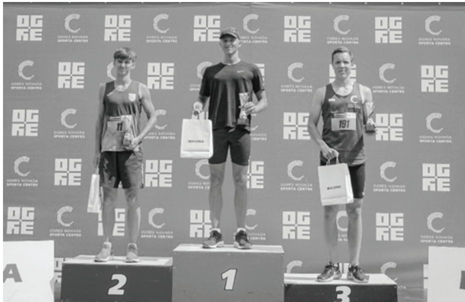
Balvu Sporta skolas audzēkņi apbalvošanas ceremonijā.