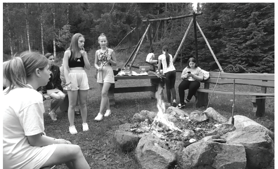
Nometnes dalībnieki katru vakaru pavadīja pie ugunsķura. Šo romantiku gan traucēja uzmācīgie dunduri, bet, kā zināms, tas ir tīras ekoloģijas apliecinājums.