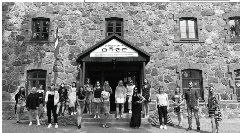
Brauciena laikā gūtā pieredze noteikti noderēs Balvu novada jaunatnes darba sistēmas veidošanai, jo idejas balstīsies uz reālu pieredzi un pārbaudītām vērtībām.

skaitis ir tāds kāds tas ir, kas lielā mērā ierobežo kvalitatīvu jaunatnes darba veikšanu, jo bieži vien lietvedības procesi, projektu izstrāde, dokumentācijas sagatavošana liedz tiešo komunikāciju ar jauniešiem, kas ir daudz svarīgāk. Apmeklētajos jauniešu centros daudz paveikts ar projektu finansējumu piesaisti un tā ir neatņemama jaunatnes darba sastāvdaļa, kas tiek darīts arī pie