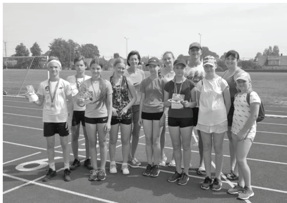
Balvu Sporta skolas audzēkņi.