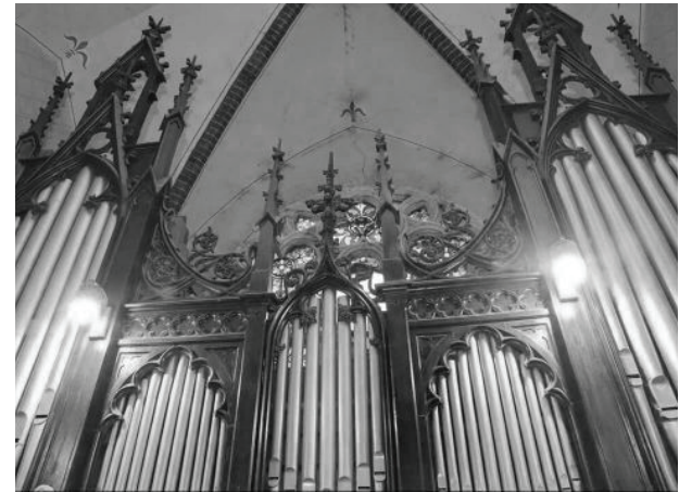
Viļakas Vissvētās Jēzus Sirds Romas katoļu baznīcas ērģeles. Arī Viļakas baznīcā norisināsies koncerts "Neredzamā klātbūtne" 2021. gada 31. jūlijā plkst. 16:00 .