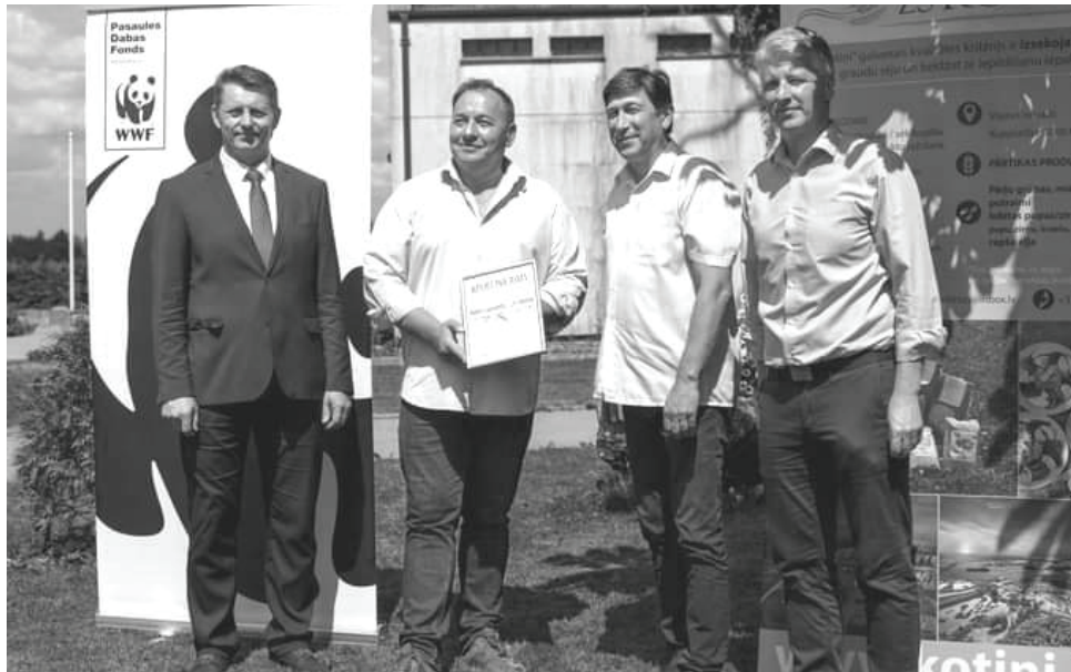
Z/S “Kotiņi” ir konkursa “Gada lauksaimnieks Baltijas jūras reģionā 2020/2021” uzvarētājs Latvijā.