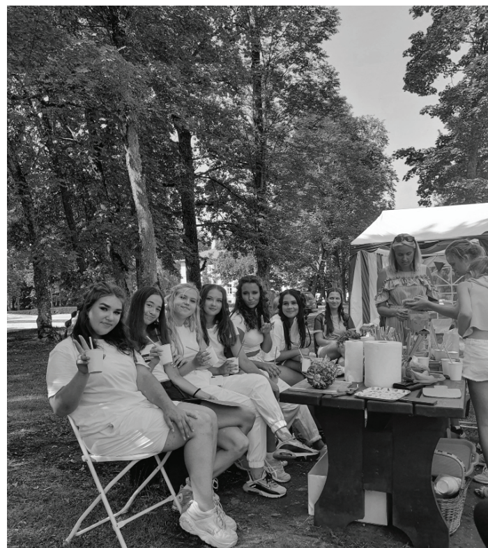
Aktivitātes dalībnieki ar interesi piedalījās smūtiju pagatavošanas meistarklasē.

Lai katram sava smūtiju garša un skaists vasaras pēdējais mēnesis!