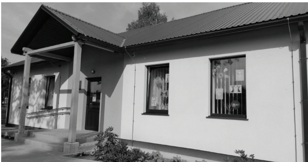
Apmeklētāju radošie darbi tiek izvietoti uz centra logiem, lai arī apkārtējie iedzīvotāji var priecāties par paveikto. Lai arī gaidīti tos apskatīt!