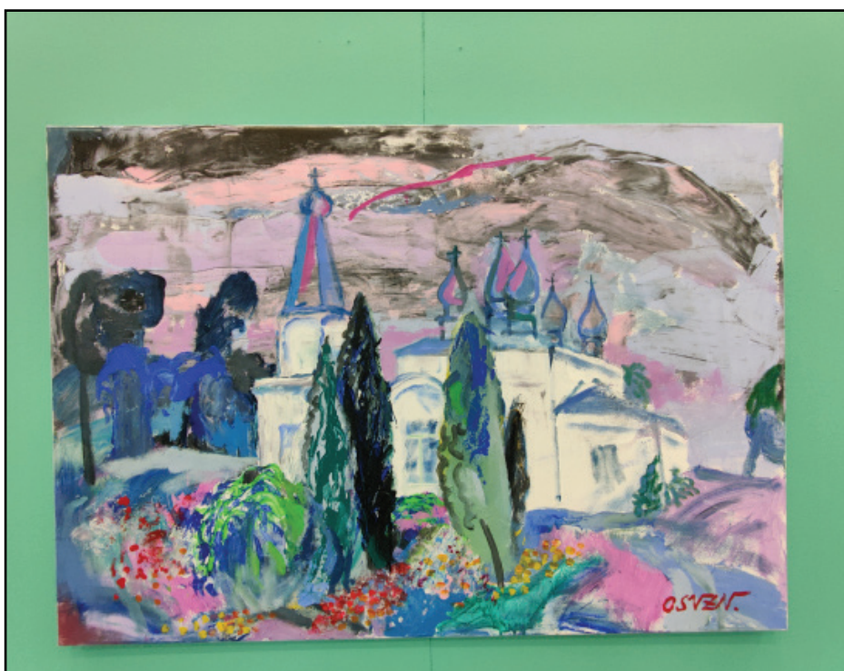
Darba autors: OSVALDS ZVEJSALNIEKS