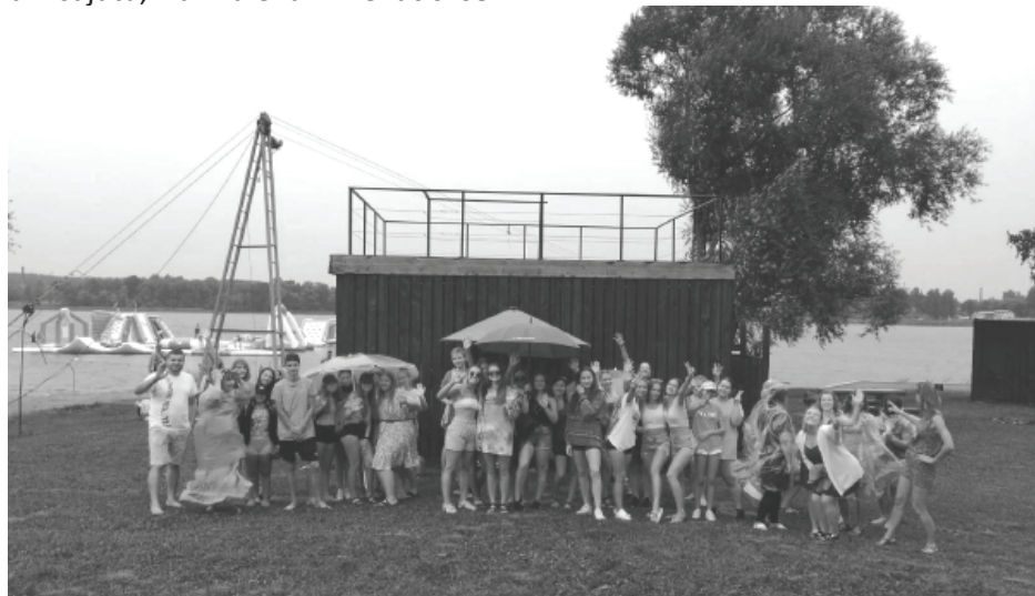
Pasākuma gaitu pavadīja lietus, kur bija sen gaidīts viesis Balvos, tāpēc tas nemazināja kopā būšanas prieku.

"Projekts īstenots Izglītības un zinātnes ministrijas Jaunatnes politikas valsts programmas 2021.-2023. gadam ietvaros"