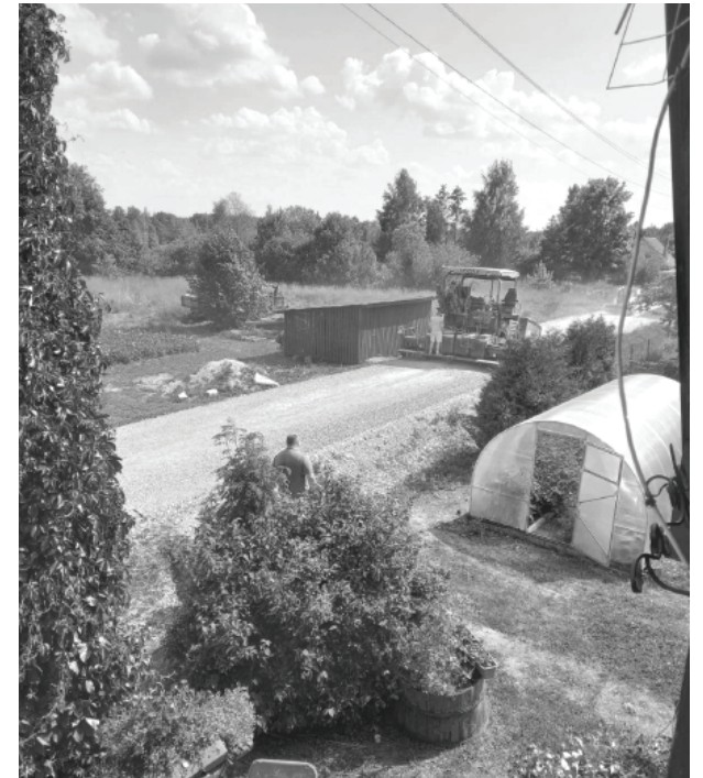
Krasta iela Viļakas pilsētā.

Līgums par būvuzraudzību noslēgts 14.04.2021. un spēkā līdz būvdarbu izpildes beigām.