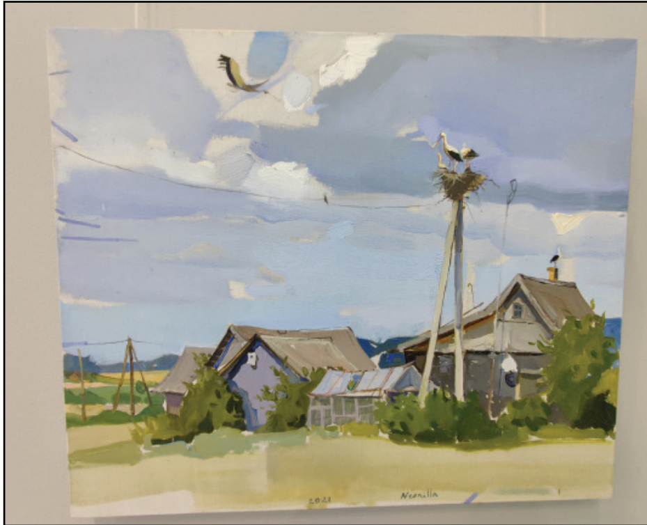
Darba autors: NEONILLA MEDVEDEVA