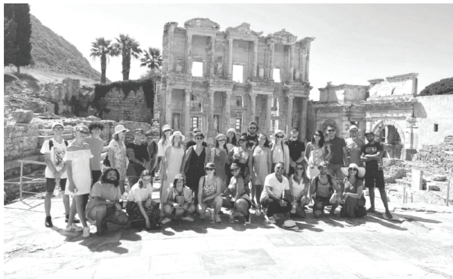
Visi projekta dalībnieki projekta gaitā tika ierauti dažādās radošās aktivitātēs, ar virs mērķi iedzīlējās dažādās ekoloģijas problēmās.

Aktivitāšu gaitā komanda atzina, ka iepriekš veiktie sagatavošanās darbi aktivitātēm ir paveikti lieliski, jo tika saņemti atzinīgi pateicības vārdi no vadītājiem un organizatoriem, jo aktivitātēs tika izmantotas dažādas metodes un paņēmieni, lai runātu interesanti par nopietnām lietām un apzinātu cilvēku attieksmi pret dabu no dažādiem Eiropas reģioniem. Ilgtspējīga saimniekošana ir rūpes par dabu un planētas nākotnes veidošana šodien. Vai mēs neradām par daudz atkritumu ikdienā, vai es lietoju vairākkārt lietojamus maisiņus, krūzītes un citas ikdienā nepieciešamās lietas un neradu kalnu atkritumu katru dienu, vai es pārstrādāju kompostējamus atkritumus un dodu iespēju viņiem atsākt dzīvi? Šie jautājumi projekta dalībniekus pavadīja katru dienu, jo pasaules ekoloģiskā situācija ir katra privāta atbildība katru dienu. Katras valsts "ekocilts" prezentēja ekoloģisko situāciju savā zemē, liekot aizdomāties un salīdzināt savas valsts risinājumus. Priecēja tas, ka visas valstis stāstīja par dabas resursu izmantošanu enerģijas