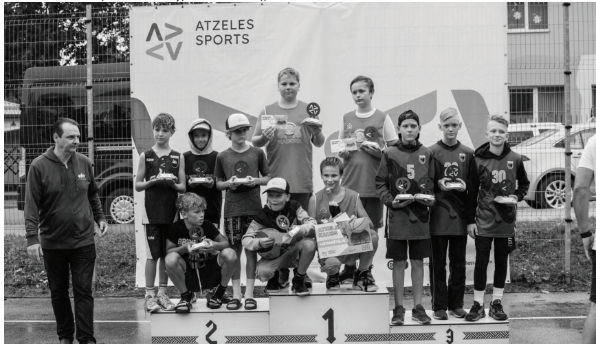
Godalgoto 3.vietu finālā U12 /2009.gadā dzimuši un jaunāki/ (kopā par spēcīgākās komandas titulu cīnījās 14 komandas) – izcīnīja "Balvu kingi".

Open /2004.gadā dzimuši un vecāki vīrieši/ (kopā par spēcīgākās komandas titulu cīnījās 21 komanda) finālā startēja BK "Lazdukalns" un BK "Lazdukalns 2". Paldies ikvienai komandai un ikvienam sportistam, kurš pārstāvēja Balvu novadu Atzeles 3x3 basketbola sacensībās.