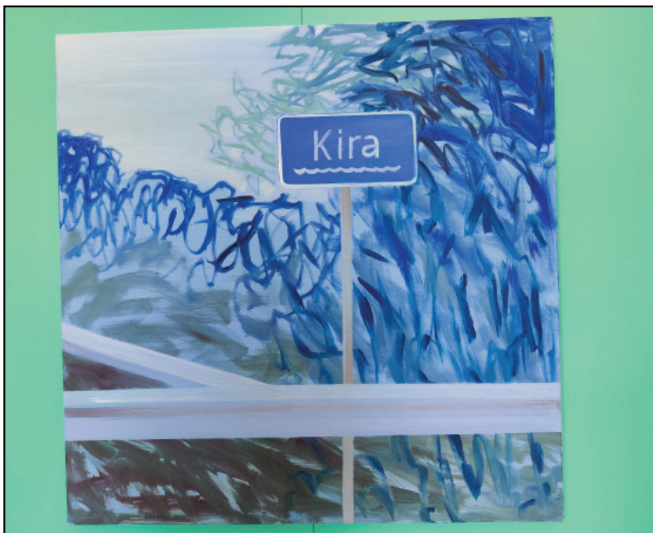
Darba autors: KALLI KALDE