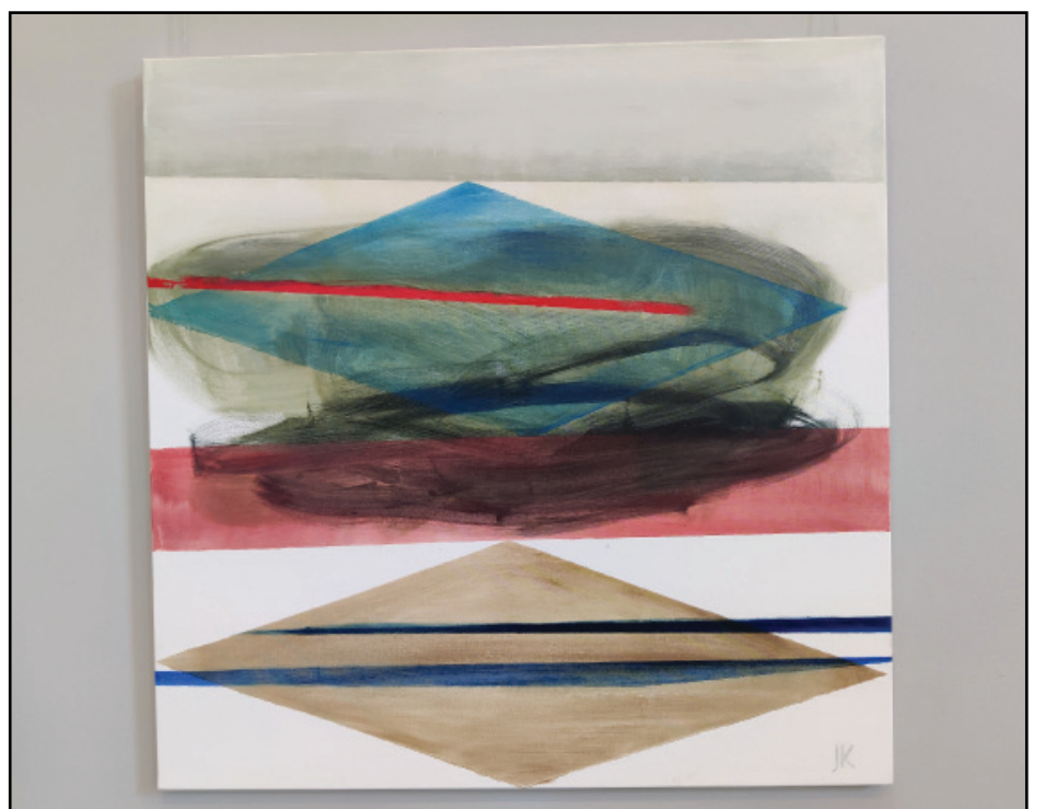
Darba autors: JĀNIS KUPČS

BALVU NOVADA ZIŅAS Iznāk 1 reizi mēnesī Izdevējs: Balvu novada pašvaldība Reģ.Nr.90009115622 Adrese: Bērzpils iela 1A, Balvi.