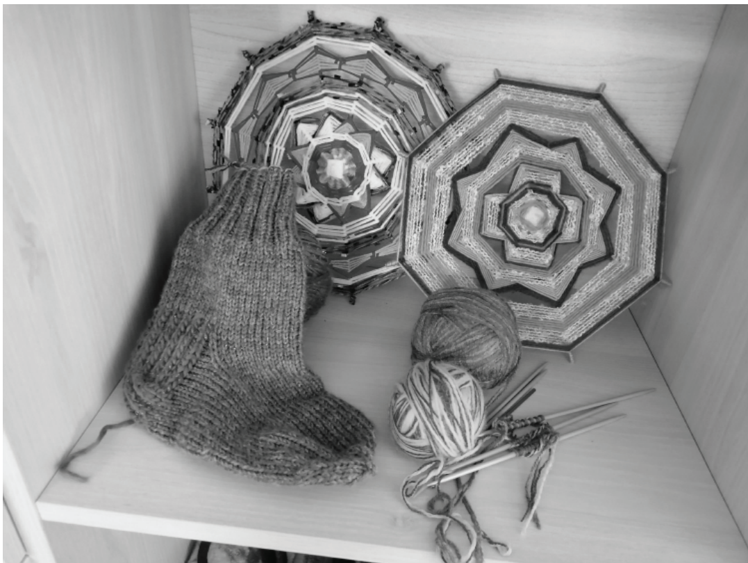
Lai klienti varētu adīt sitas zeķes ziemai, vispirms nepieciešams sagatavot dziju. Šajā procesā ar prieku iesaistās arī tie klienti, kur adīt neprot – sākumā tiek sagādāti nevajadzīgi džemperī, tie tiek izārdīti un dzija satīta kamolos. No otrreiz izmantojamās dzijas tiek veidotas skaistas mandalas.

sagatavot dziju. Šajā procesā ar prieku iesaistās arī tie klienti, kur adīt neprot – sākumā tiek sagādāti nevajadzīgi džemperī, tie tiek izārdīti un dzija satīta kamolos. No otrreiz izmantojamās dzijas tiek veidotas skaistas mandalas. Mazākie centra apmeklētāji aktīvi darbojas ar papīru un krāsām. Centra Sociālā darbiniece dalās pieredzē ar filcēšanas mākslu un māca klientiem dažādus filcēšanas darbus. Mazākie centra apmeklētāji aktīvi darbojas ar papīru un krāsām.