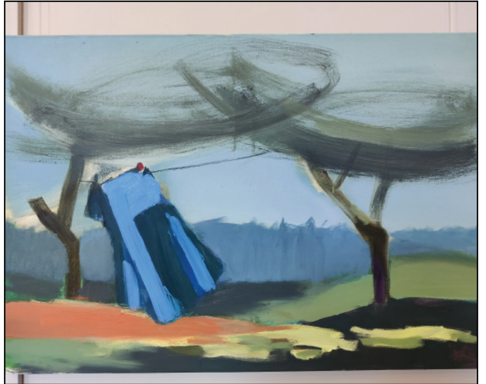
Darba autors: IEVA RUPENHEITE