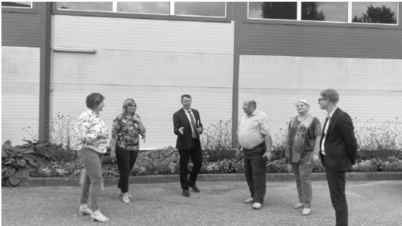
Pirms 2022. gada pašvaldības budžeta plānošanas, svarīgi izvirzīt katras teritorijas prioritātes un veicamos darbus, un sarunas gaitā tās izskanēja.

Daudzu gadu garumā, gan pirms 2009.gada reformas, gan pēc tās, esot jau Balvu novadā, ir veikts mērķtiecīgs darbs, lai būtu