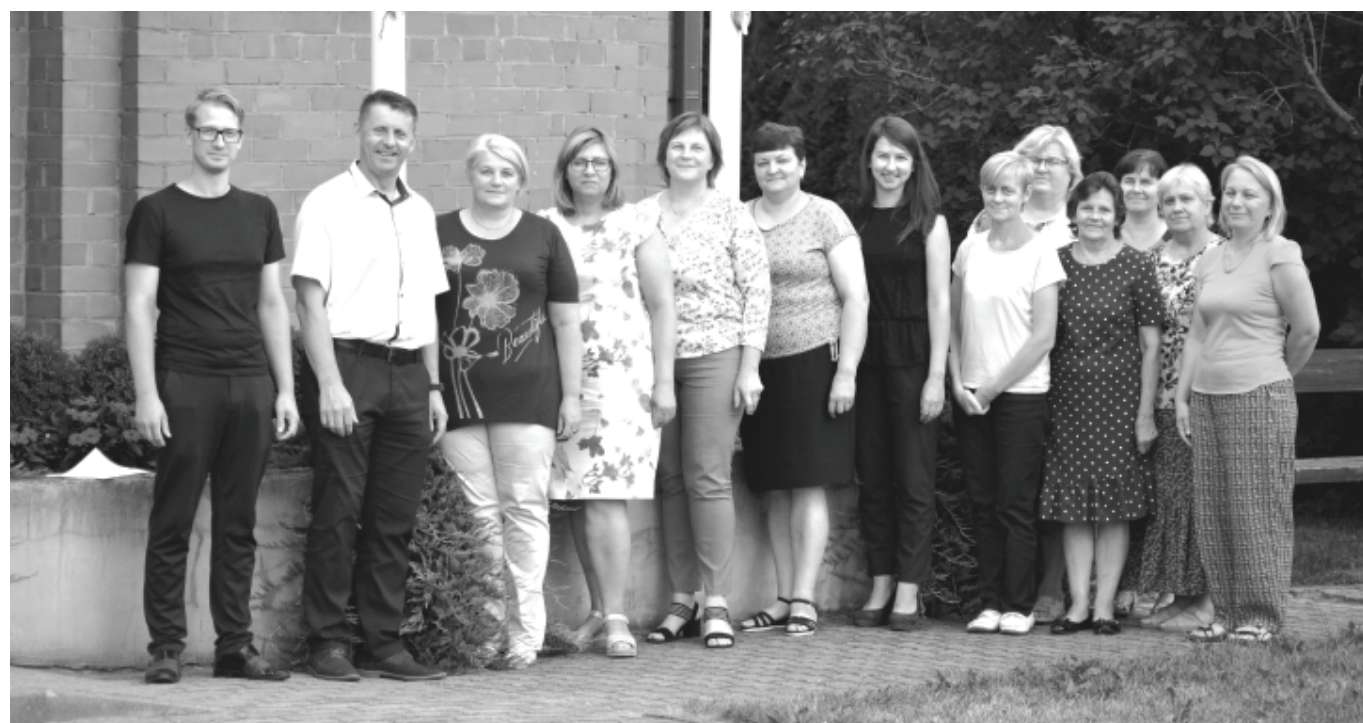
Tikšanās laikā tika diskutēts par būtiskiem jautājumiem, kas skar dažādu pakalpojumu sniegšanu iedzīvotājiem.