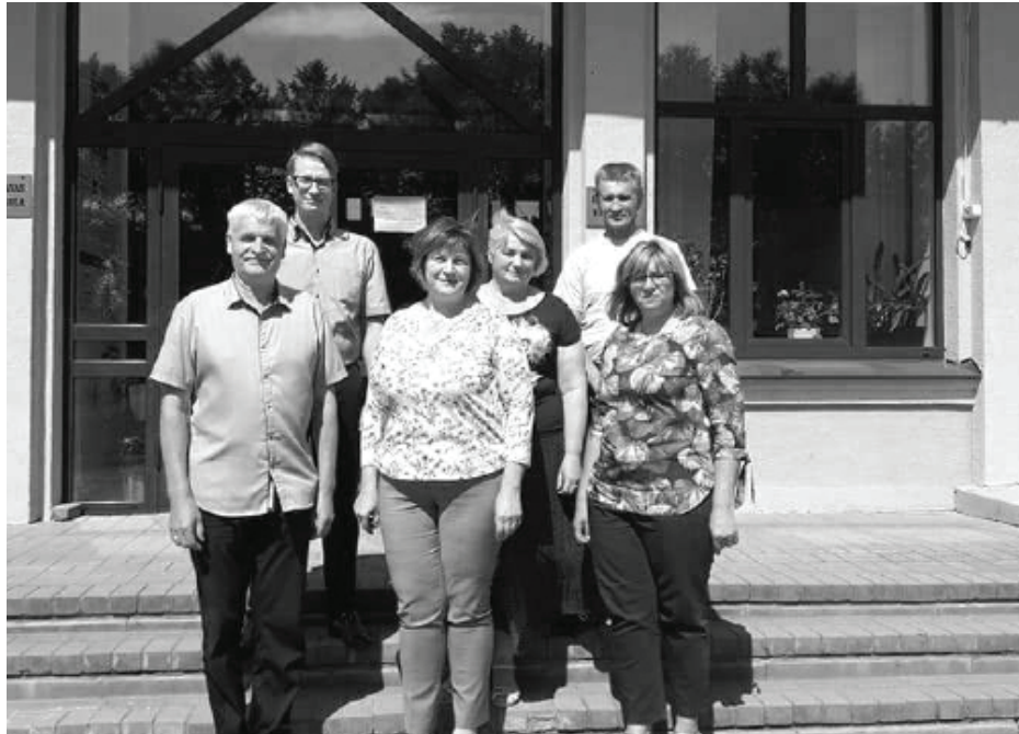
Baltinavas vidusskolas direktors sniedza ieskatu risināmajos jautājumos, kā, piemēram, skolēnu pārvaldījumu saglabāšana, brīvpusdienu nodrošināšana visiem skolēniem, atbalsts vidusskolas posma saglabāšanai un nodrošinājums ar atbalsta personālu.