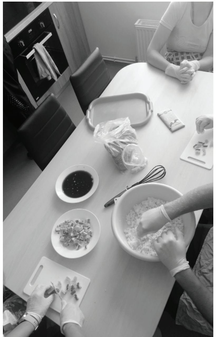
Lai klientiem pilnveidotu dzīves prasmes, tiek organizētas arī kulinārās nodarbības- gatavotas kūkas, cepti cepumi, siets Jāņu siers.