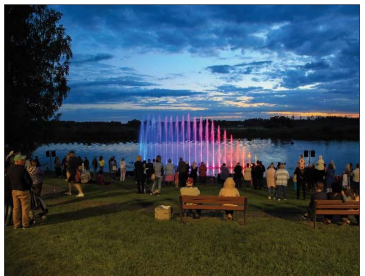
■ 4. un 5.jūnijā Daugavā pie Līvānu Stikla un amatniecības centra ikviens interesents varēja apskatīt košo vides objektu "Muzikālās strūklakas upē"