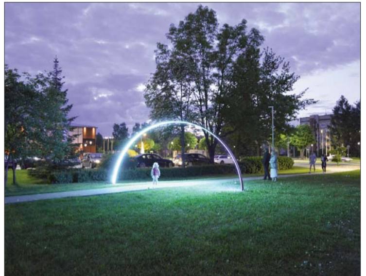
■ Svētku ietvaros pie Līvānu 1.vidusskolas ozoliem tika uzstādīts vides objekts "Latgales vārti", kas ir interaktīva gaismas arka, kas diennaktis tumšajā laikā veido dinamisku krāsu šovu. Šis vides objekts būs apskatāms visu vasaru.