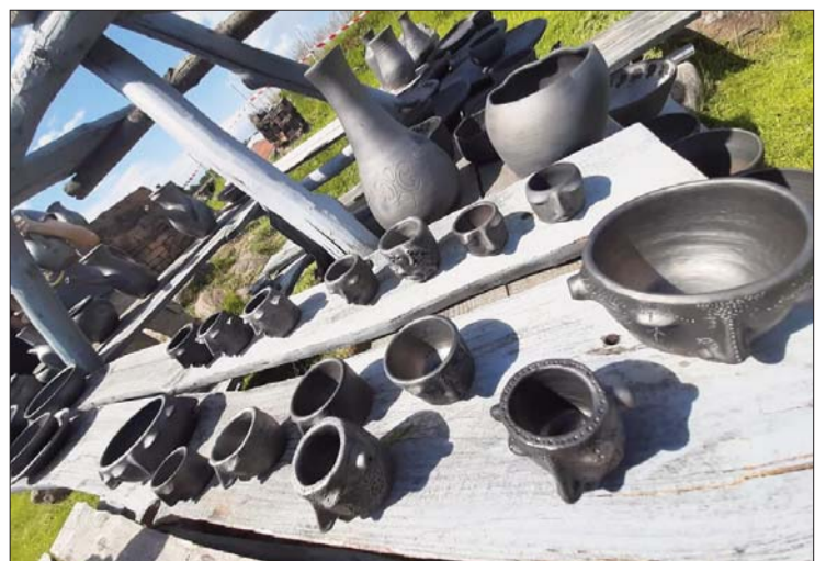
■ Svētku ietvaros tika kurināts Līvānu Stikla un amatniecības centra keramikas ceplis, un brīvdabas izstādē bija apskatāmi keramikas cepla, stikla un amatniecības darbi