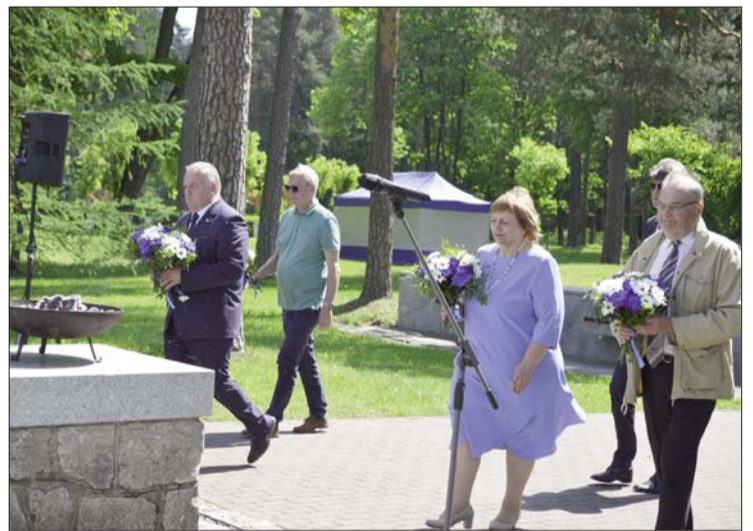
■ 7.jūnijā Līvānu Goda pilsoņi un Līvānu novada domes vadība nolika ziedus pie Līvānu Atbrīvošanas pieminekļa