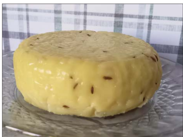
■ Jāņu siera receptes izmēģināja Līvānu novada KC pārstāve Sanita Pinupe