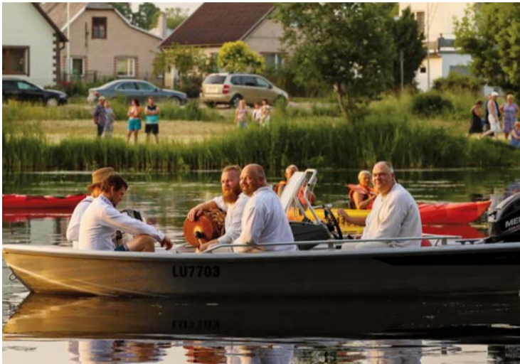
■ Līgo priekšvakarā folkloras kopa "Rūžupis veiri" muzicēja peldot laivā pa Dubnas upi

Lai saulgriežos uzkrātais spēks dod enerģiju jauniem, labiem darbiem un dabas miers vairo cilvēcību un saskaņu sabiedrībā!