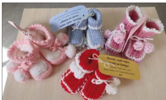
■ Brīvprātīgo adītāju uzadītie zābaciņi, kas tiks dāvināti jaundzimušajiem

Jau vairāk kā desmit gadus, un arī šogad, Līvānu biedrība "Baltā māja" Līvānu novada Dzimtsarakstu nodaļai dāvā brīvprātīgo adītāju darinātos pirmos zābaciņus, kurus saņem katrs jaundzimušais Līvānu novada mazulis. Šī ir viena no biedrības ilggadējām labdarības akcijām ar nosaukumu "Mazais, audz stīprs, vesels, un laimīgs!", kas notiek pateicoties brīvprātīgajam darbam. Adītājiem dzija tiek nodrošināta no piesaistītā finansējuma – pasākuma sponsors jau daudzus gadus ir SIA "Līvānu kūdras fabrika". Paldies Baltajai mājai un visām čaklajām adītājām par zābaciņus ieadīto sirdssiltumu!