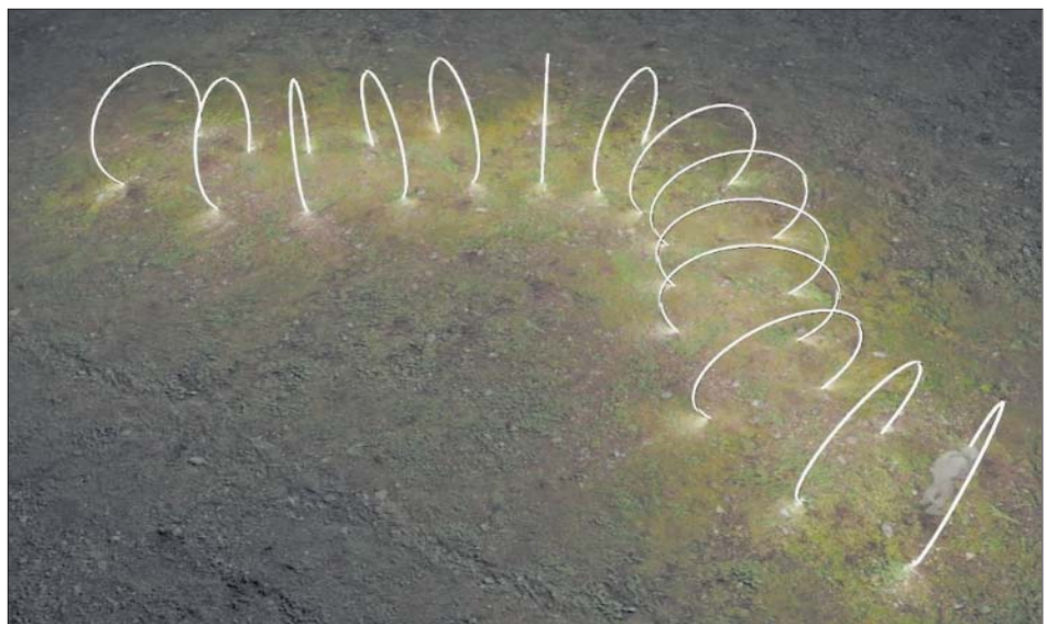
■ Vides objekta idejas vizualizācija

Vides objekta "Gaismas vārtu ceļš" izveides izmaksas saskaņā ar piedāvājumu sastāda 8687,42 EUR (ieskaitot PVN), piesaistes projekta izstrādes izmaksas sastāda 1815,00 EUR (ieskaitot PVN), objekta kopējās izmaksas 10502,42 EUR. Līvānu novada uzņēmēji šī vides objekta izveidei ir ziedojuši 8000 EUR, līdz ar to izstrūkstošā finansējuma daļa sastādīja 2502,42 EUR. 5.jūnija sēdē domes deputātu vairākums lēma piešķirt izstrūkstošo finansējuma daļu.