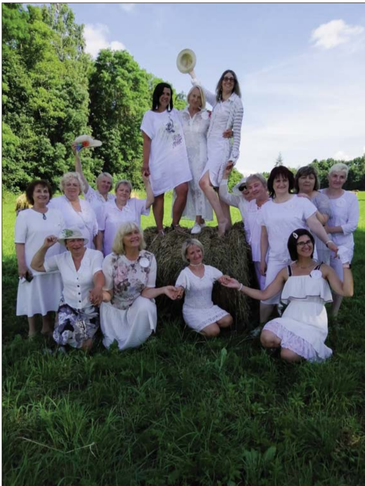
■ Līvānu novadā notika Vislatvijas Zaigu salidojums

Mums izveidojusies tāda tradīcija, ka "jaunā" Zaiga, kura