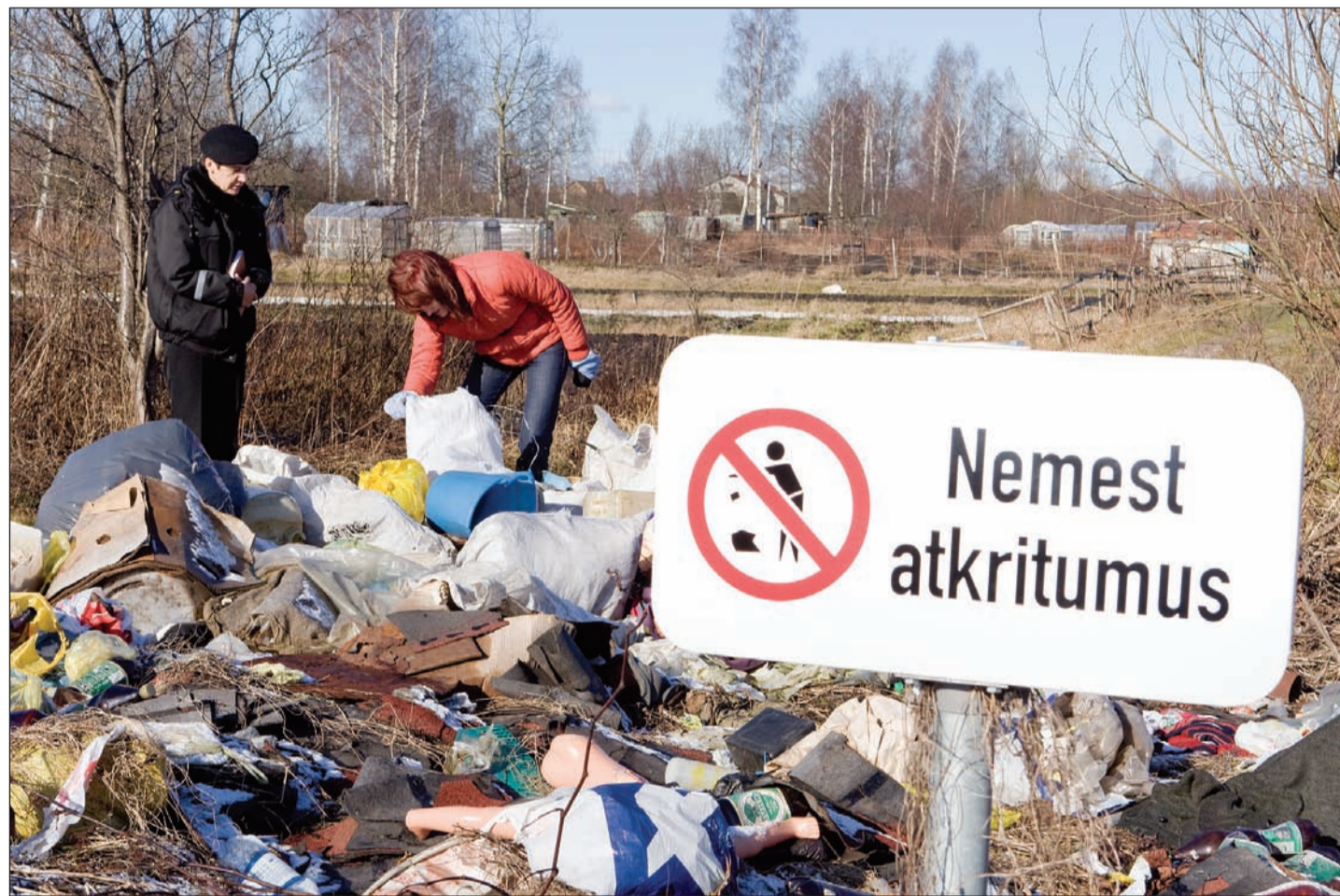
Pašvaldības aģentūra «Pilsētsaimniecība» nelegālo atkritumu izgāztuvi 1. līnijā likvidējusi jau vairākkārt, taču atkal un atkal iedzīvotāji pamanās tur radīt jaunus atkritumu kalnus. Minētās izgāztuves likvidēšana pašvaldībai varētu izmaksāt 500 – 600 latus.