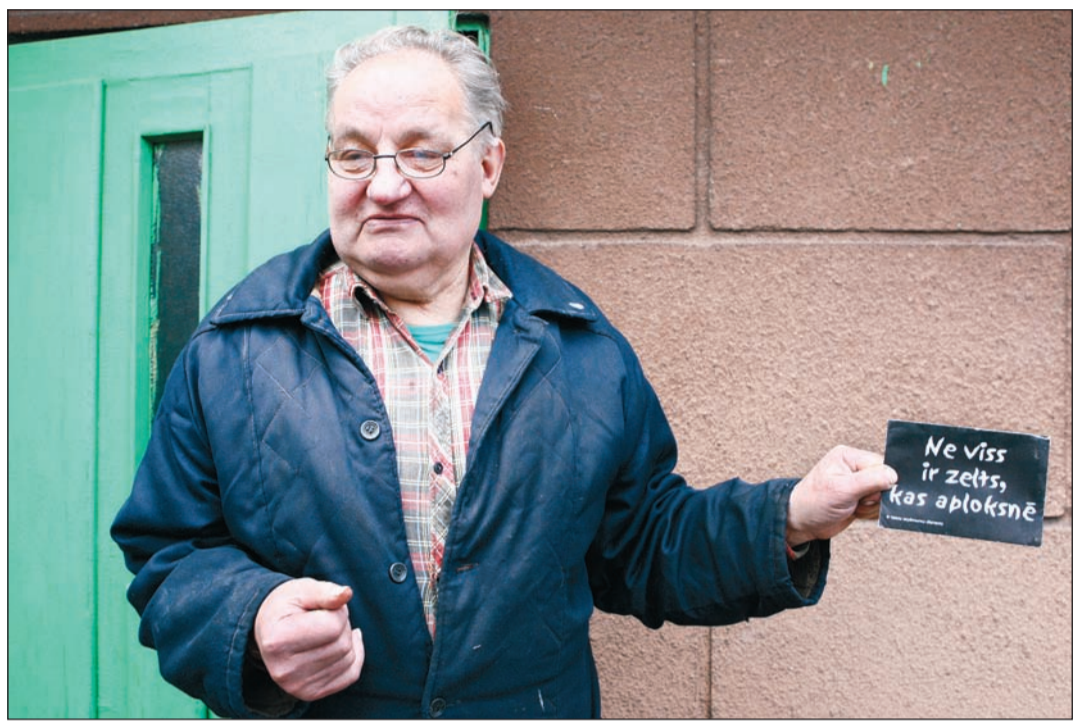
Strādājošais pensionārs Elsteris joprojām nesaprot, kāpēc VID viņam savulaik nosūtījis «melnā aploksni» – sākumā viņš pat dīvaino aploksni baidījies atvērt, domājot, ka tā varētu būt sprādzienbīstama.

VID par mani zina visu. Mani izbrīnu radīja tas, kā melnā aploksne bez manas dzīves vietas adreses atradās manā pastkastītē.