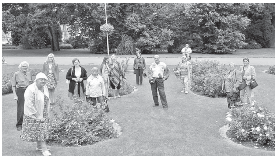
Ekskursijas dalībnieki Bulduru dārzkopības vidusskolas pagalmā.

Turpinot Viesītes novada Elkšņu pagasta rokdarbu un mākslas pulciņa pieaugušajiem un bērniem „Savam priekam” iesāktā projekta „Zvaigžņu sega Latvijai” realizāciju, 9. augustā trīspadsmit Viesītes novada iedzi-