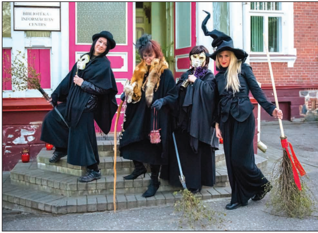
Valpurģu nakts dalībnieces Jērcēnmuižā