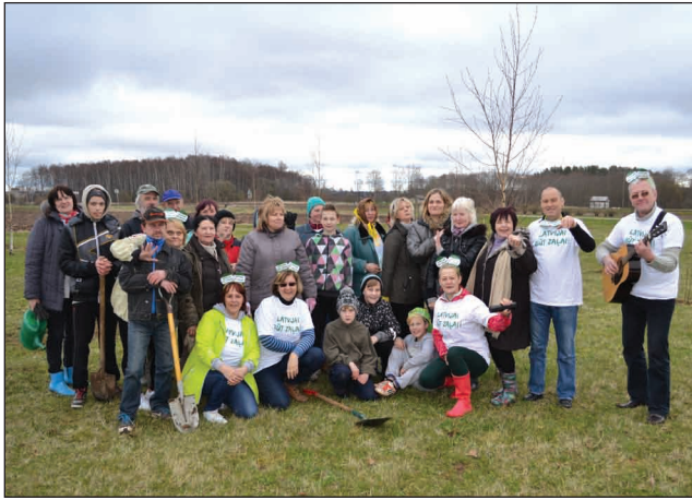
Lielās Talkas dalībnieki Plāņos