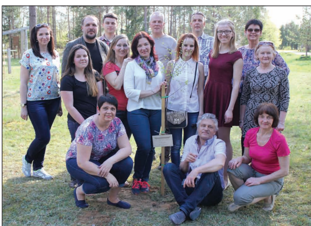
Kora "Rītu puse" dalībnieki pēc birzītes stādīšanas