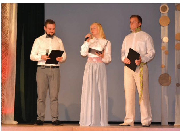
Koncerta "Spēka dziesmas Latvijai" vadītāji