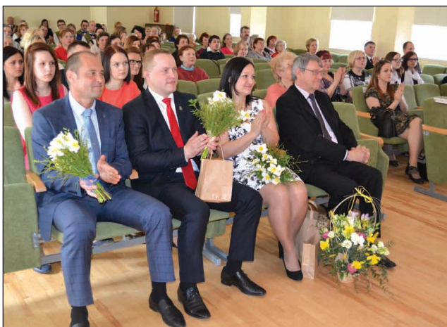
Triju novadu vadītāji Baltā galdauta svētkos Strenčos