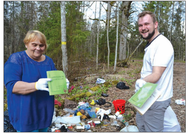
Kultūras darbinieki sakopj Spicu tilta apkārtni