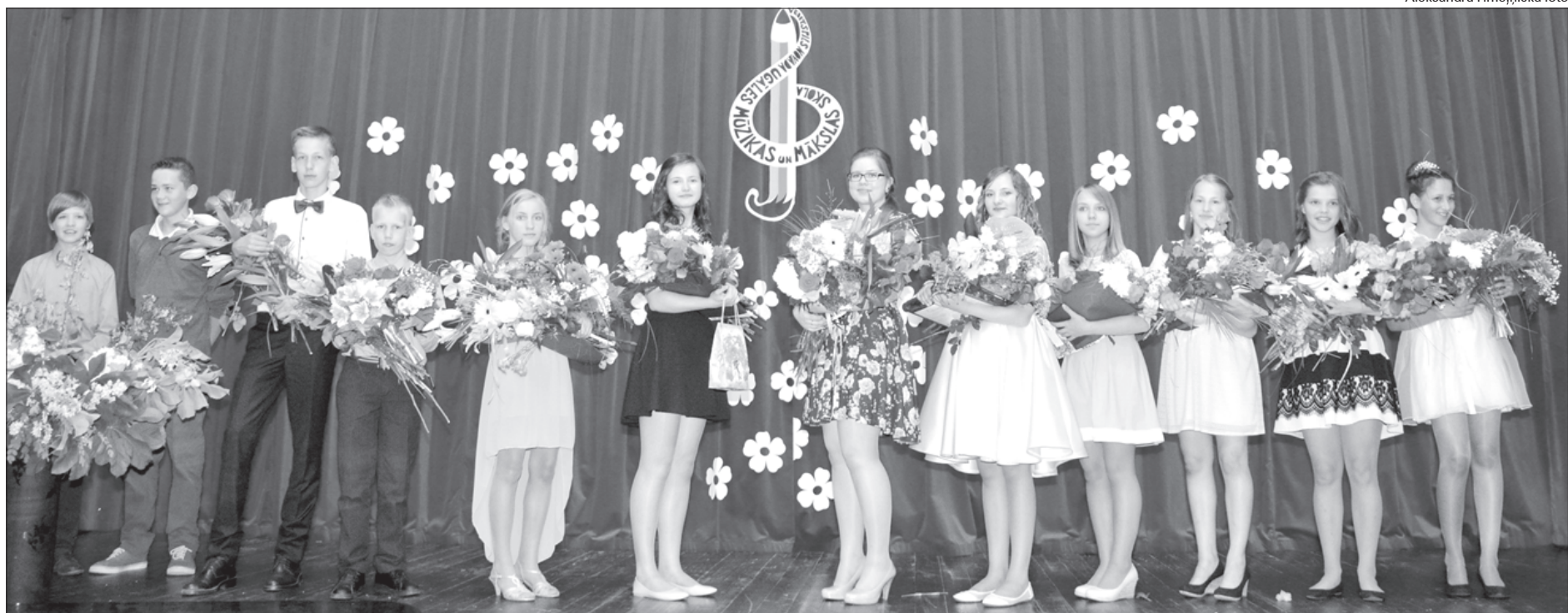
Radošie Ugāles Mūzikas un mākslas skolas absolventi.