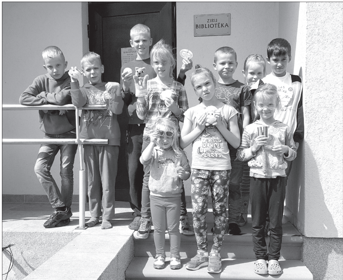
Pasākuma dalībnieki saņēmuši balviņas.

Bija uzdevumi par bibliotēkas krājumu un grāmatām. Bērniem vajadzēja atrast piecas grāmatas, kuru nosaukumos minēti dzīvnieki. Enciklopēdijās bija jāsameklē pareizās atbildes uz jautājumiem. Pieaugušo lasītāju krājumā bija jāatrod konkrēta grāmata un jāuzraksta, cik tajā ir lappušu. Bija jāatrod un jānosver bibliotēkas vissmagākā un visvieglākā grāmata. Tad bija jāatrod, cik Imanta Ziedoņa un Ojāra Vācieša dzejas grāmatu bibliotēkā ir pieaugušajiem. Bērni noskaidroja, cik žurnālu bibliotēka abonē, kas sākas ar burtu "i". Daži bija atjautības