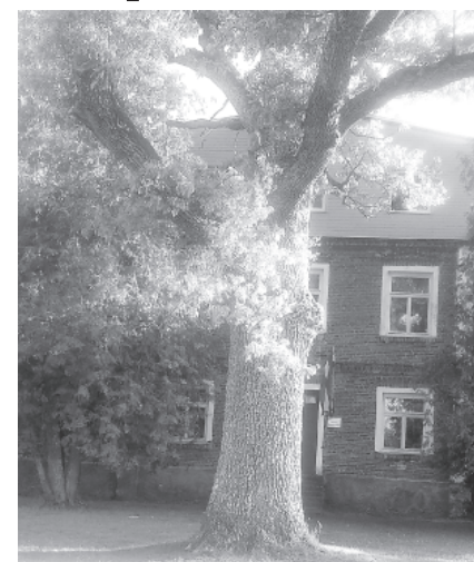
Radošajās darbnīcās bērni vairāk iepazīna dabas objektus.