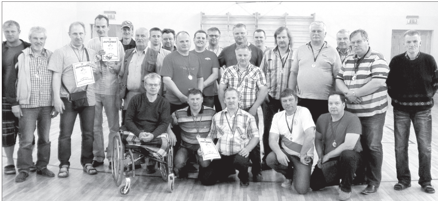
Novada aktivākie zolītes spēlmaņi.