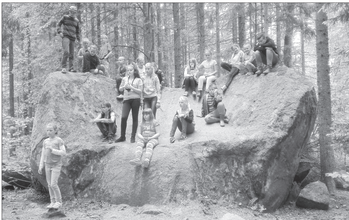
Atrasts viens no Tārgales pagasta dižakmeņiem.

No 6. līdz 10. jūnijam Tārgales pamatskolā notika Ventspils novada pašvaldības finansētā radošā darbnīca "Iepazīstam Tārgales pagastu. No Lodes līdz Miķeļtornim".