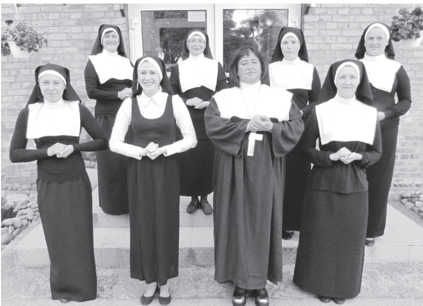
Atraktīvais mūķeņu koris.