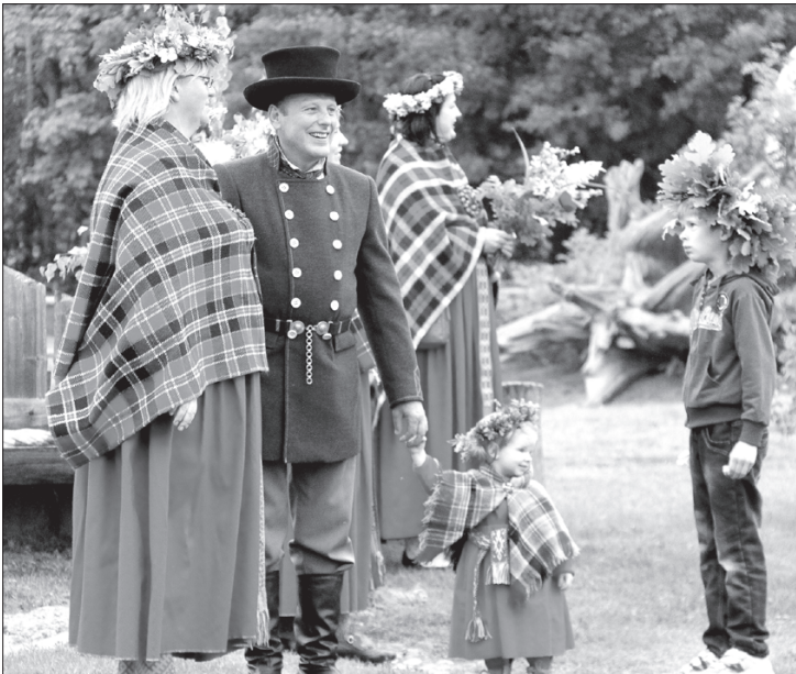
Svētku svinētāji tērpušies goda rotā – svētki prasa savu.