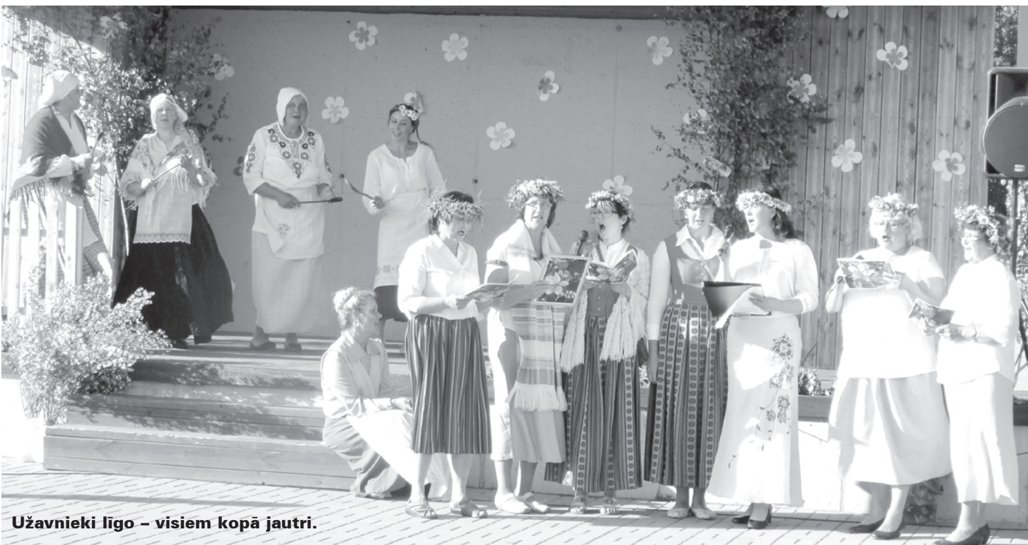
Užavnieki līgo – visiem kopā jautri.