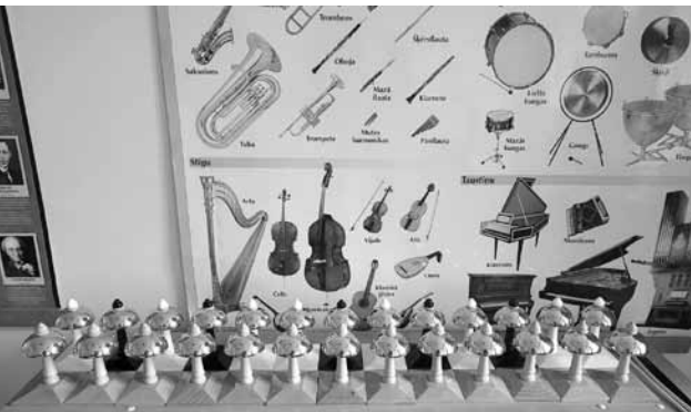
Vilgālē gan pirmsskolas grupās, gan sākumskolas klasēs izmanto Montessori metodes. Nesen iegūts jauns materiāls muzikai – zvaniņi.