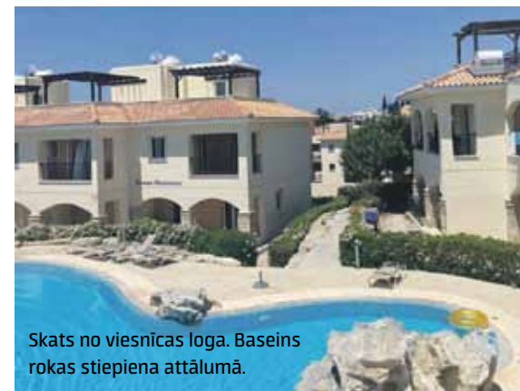
Skats no viesnīcas loga. Baseins rokas stiepiena attālumā.