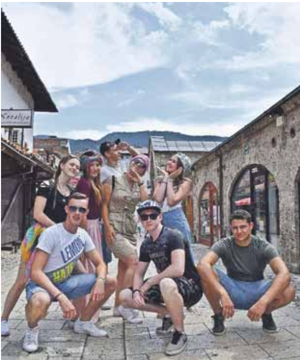
Kolektīvs atpūšas Bosnijas pilsētā Sarajevā.