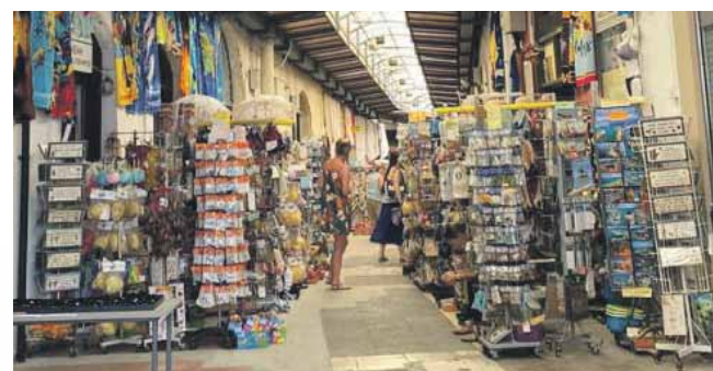
Pafas tirgus. Tirgotāji izpletušies arī ārpus saviem veikaliņiem.