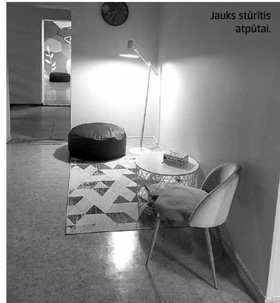
Jauks stūrītis atpūtai.