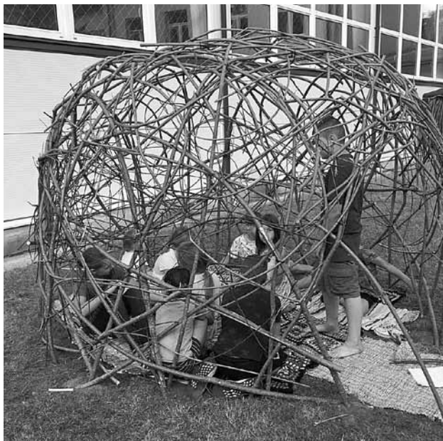
Vilgāles sākumskolas bērni paši sev uzbūvējuši klūgu māju.