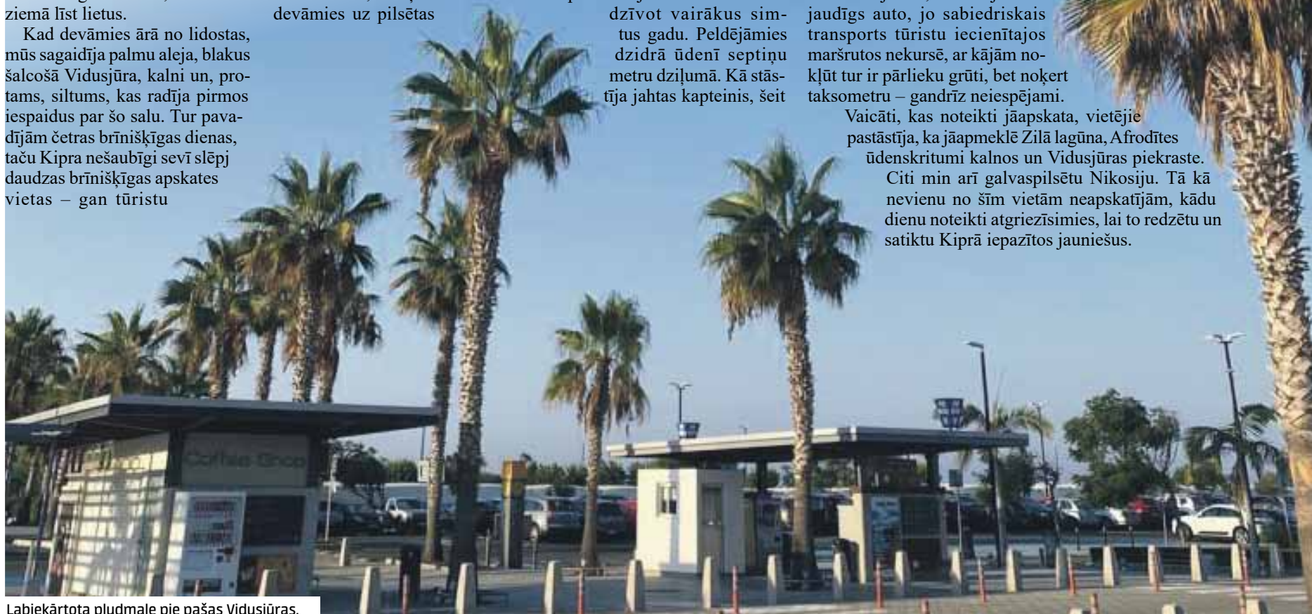
Labiekārtota pludmale pie pašas Vidusjūras.

Citi min arī galvaspilsētu Nikosiju. Tā kā nevienu no šīm vietām neapskatījām, kādu dienu noteikti atgriezīsimies, lai to redzētu un satiktu Kiprā iepazītos jauniešus.