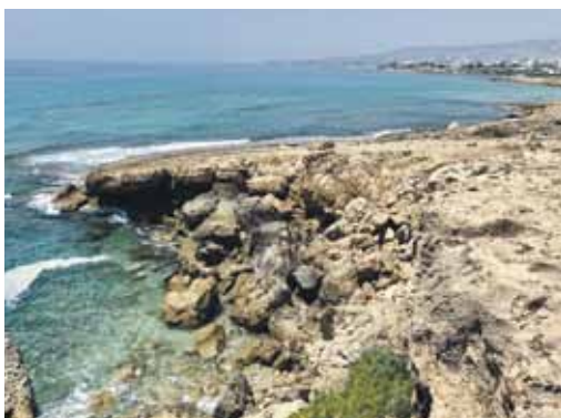
Pārgājiens gar Vidusjūru. Kalni, tirkīztilais ūdens un klinšains krasts.

Otro dienu iesākām ar peldi viesnīcas baseinā, tad – 15 km pārgājiens gar Vidusjūru. Jūras krasts Pafas apkārtnē ir klinšains, taču tirkīztilais ūdens, kalni un palmas veido apbrīnojamu ainavu. Mūsu ceļš beidzās smilšainā pludmalē, kur izbaudījām jūras silto ūdeni un sildījāmies saulē. Atgriezāmies viesnīcā, taču Kiprā pavadījām tikai četras dienas un vēlējamies šajā paradīzē izbūvēt ik mirkli, tādēļ vakarā devāmies uz pilsētas