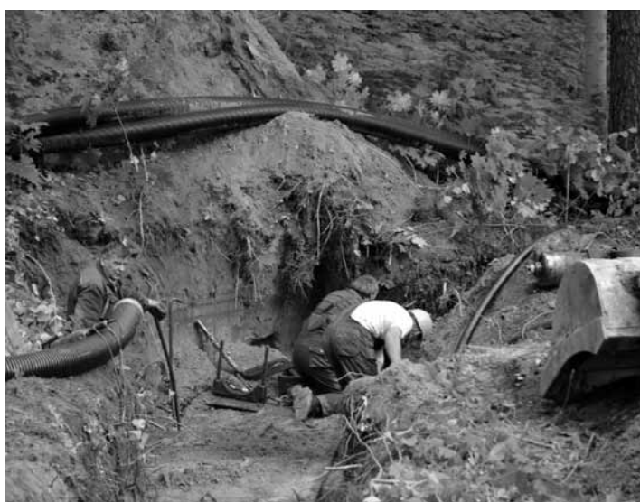
Lai Priedainē siltumtrases pārbūvi pabeigtu līdz apkures sezonai, talkā saukts uzņēmums Grobiņas SPMK , kas sarežģītos apstākļos Kuldīgas siltumtīkliem palīdz ierakt jaunās caurules.

„Darbs iekavējās galvenokārt projektēšanas un dokumentācijas dēļ,” skaidro A. Aniņš. „Tajā trases daļā, kas iet gar ielu, sarežģīta tas, ka nezinājām, kas un kur