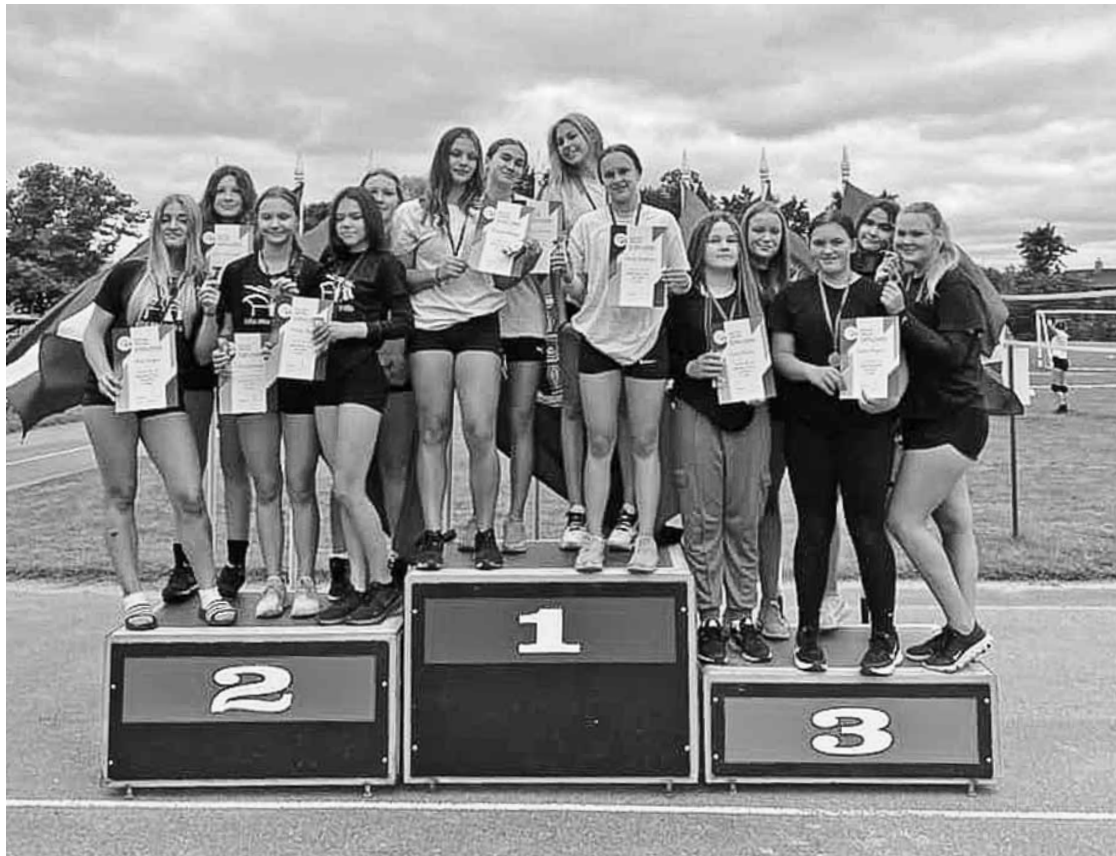
Kuldīgas vasaras spēlēs U15 grupā medaļas izcina mājinieces – sporta skolas volejbolistes.

Kuldīgas atklātajās vasaras spēlēs volejbolā piedalījušās 42 meiteņu un zēnu vienības.