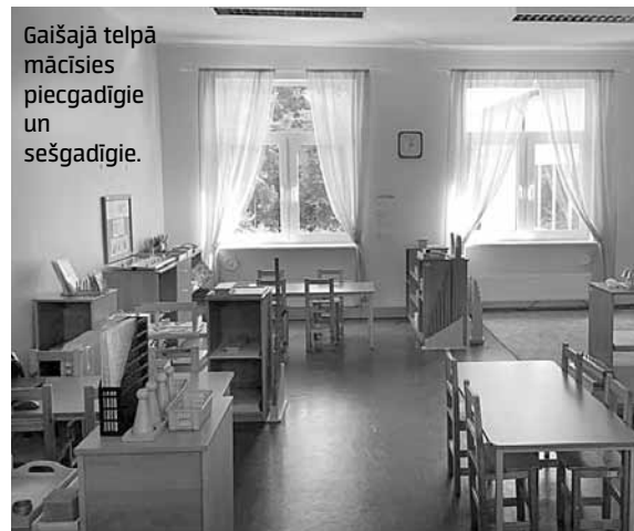
Gaišajā telpā mācīsies piecgadīgie un sešgadīgie.