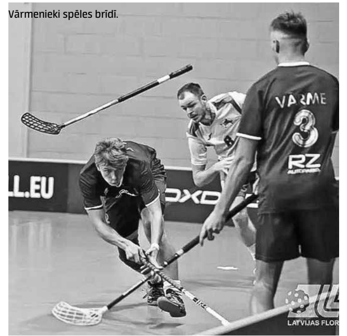
Vārmes florbolisti pēc uzvaras turnīrā Latvian Open .

Florbola turnīrā Latvian Open Valmierā 13 komandu konkurencē uzvaru izcīnījis klubs Vārme .