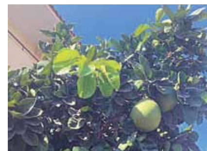
Uz ielām aug dažādi eksotiski augļi, piemēram, pomelo.

centru apskatīt, kā dzīvo vietējie, jo viņi uz ielām iznāk tikai vakarā. Paēdām restorānā un devāmies mājās. Interesanti, ka visur, kur ieturējām maltīti, mūs apkalpoja īpašnieki, viņi arī pastāstīja par vietu, kurā atrodamies, un izrādīja milzīgu cieņu.