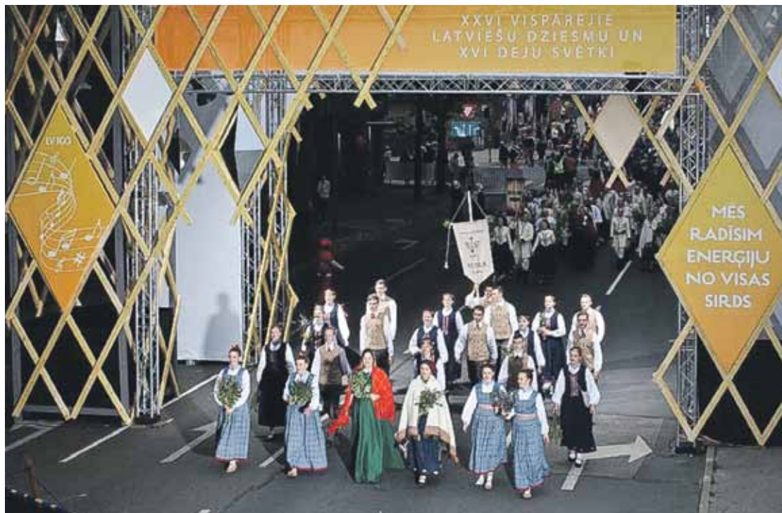
Kuldīgas Austra Dziesmu un deju svētku gājienā 2018. gadā.

Šie svētki piecu gadu laikā esot spilgti notikumi. Austrai visas zvaigznes nostājušās pareizajās vietās, jo vadītājam darbs bijis ļoti viegls: nevienu nav vajadzējis pierunāt, un bijis redzams, ka deļotāji nevis vienkārši grib aizbraukt uz svētkiem un tos piedzīvot, bet