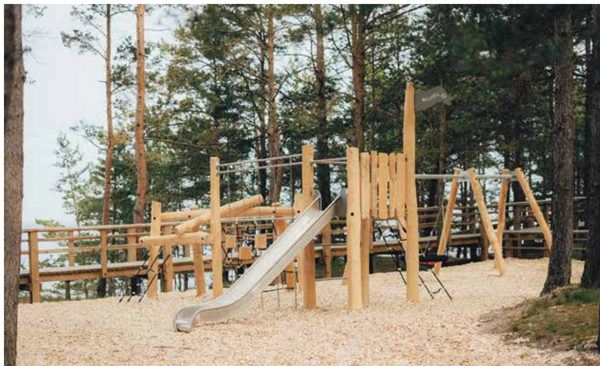
Atjaunots rotaļu laukums Baltajā kāpā.