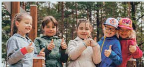
Saulkrasti – pilsēta arī bērniem