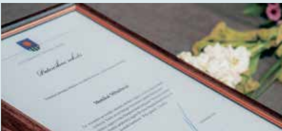
Svinīgi godināti novada skolēni un viņu pedagogi