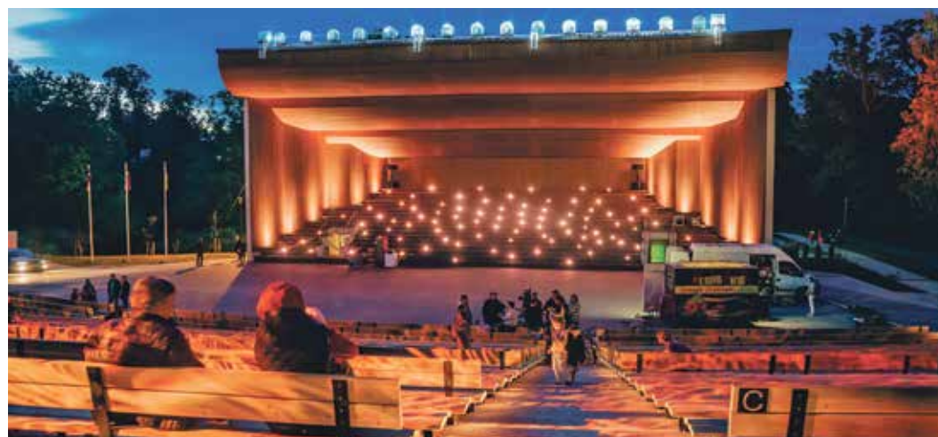
Līdz ar tumsas iestāšanos estrādes apmeklētājiem bija izdevība baudīt kaut ko neparastu: skatot tādiem latviešu kora mūzikas skaņdarbiem kā „Sauls. Pērkonis. Daugava” un „Pūt, vējiņi!”, estrāde izgaismojās visā krāšņumā, košajām projekcijām veidojot dažādu gaismu kombinācijas.

Neibādes parkā uzstādīti jauni gaismekļi, atjaunoti celiņi, kā arī novietoti soliņi, atkritumu urnas un velostatīvi. Apzaļumošanas darbu laikā izveidoti stiprinātā zāliena segumi, kuros gada siltajos mēnešos parkā izvietot pagaidu tirdzniecības vietas, kā arī iekopts zāliens un