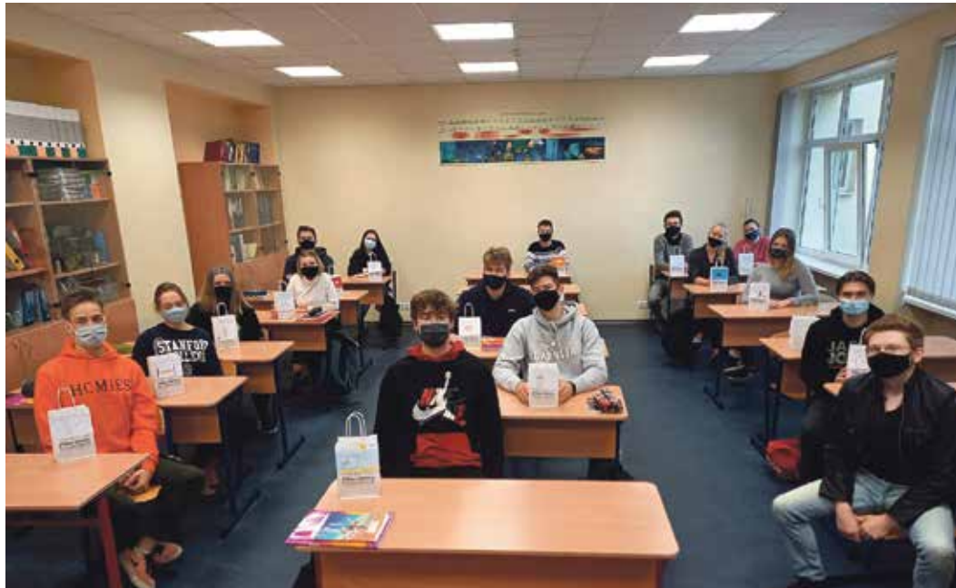
Zvejniekiema vidusskolas 12. klases Pēdējais zvans.

● 8. maijā skolēni piedalījās vairākās aktivitātēs: 1.–12. klase pārbaudīja savas zināšanas par Eiropu „Eiropas eksāmenā 2021”.