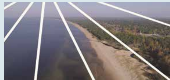
Piedalies jaunā Saulkrastu novada veidošanā!