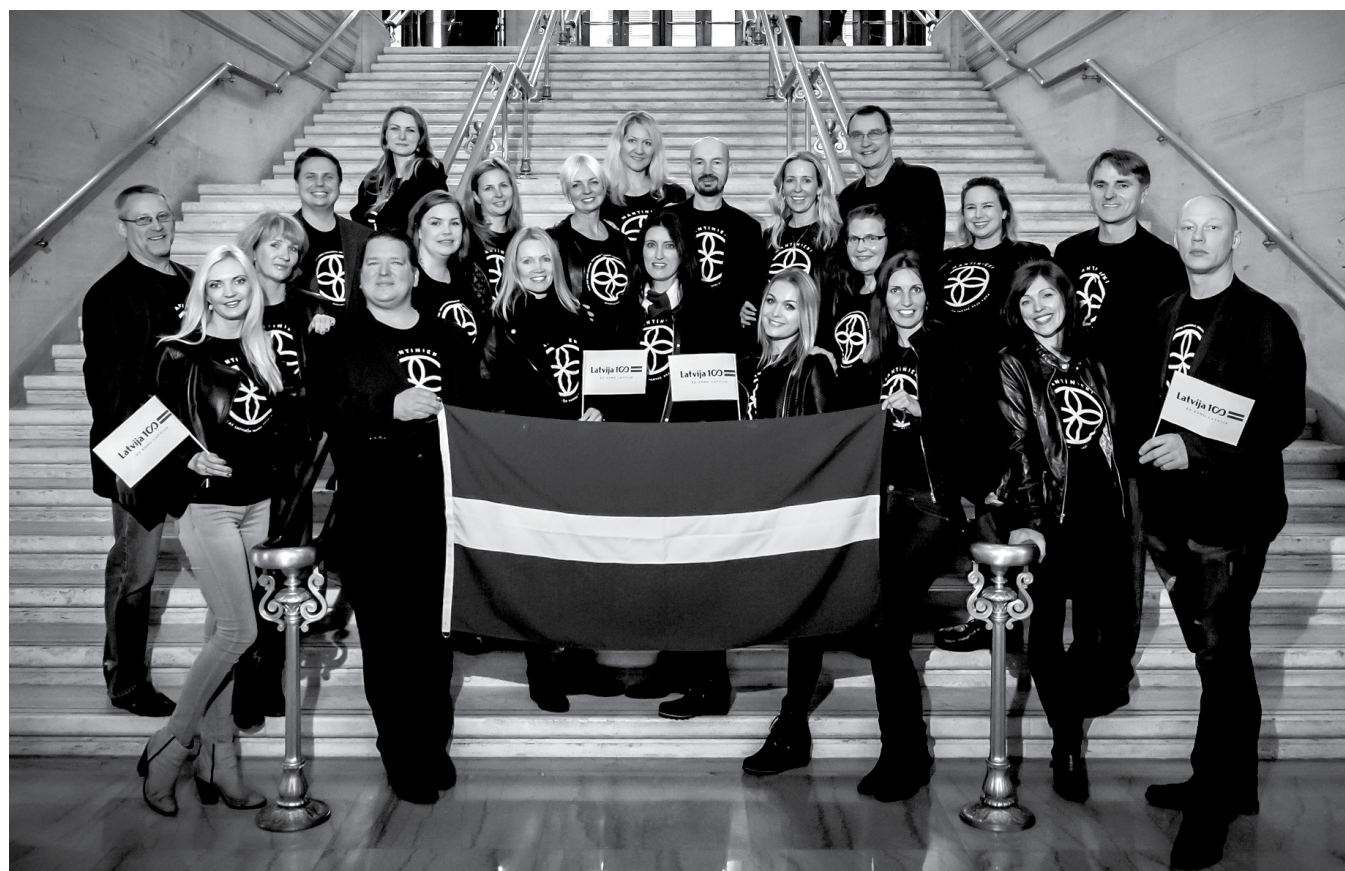
Čikāgas latviešu tautasdeju kopa ceļā uz Latvijas 100gadl.