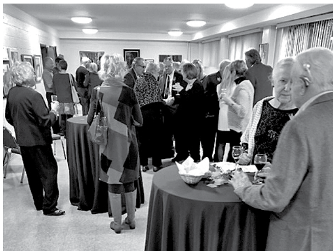
Pie glāzes vīna un uzkodām.