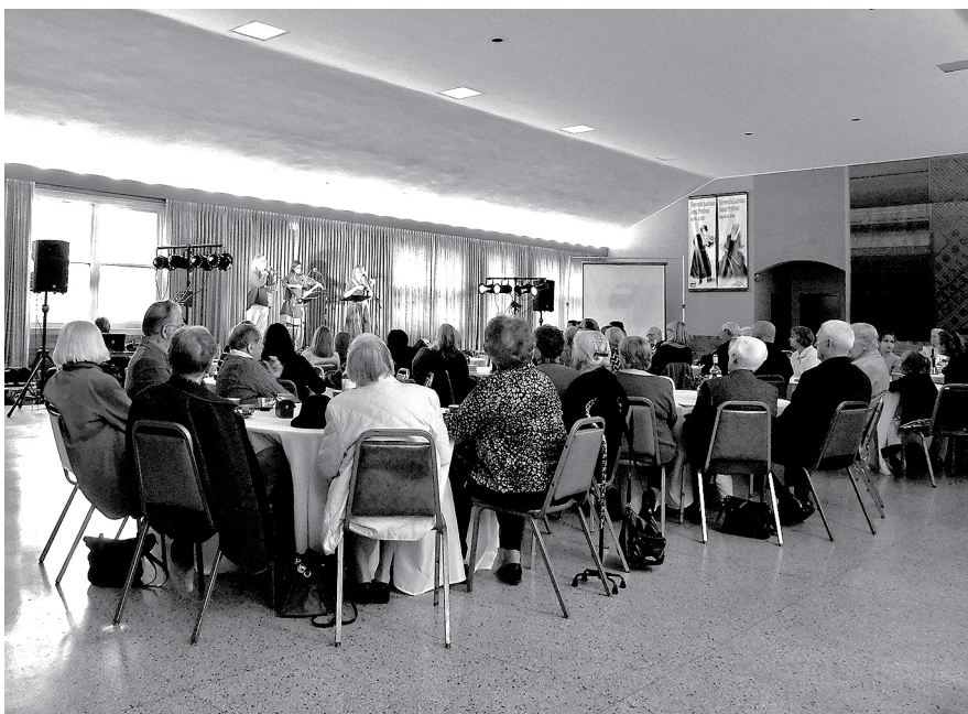
Daļa koncerta klausītāju.