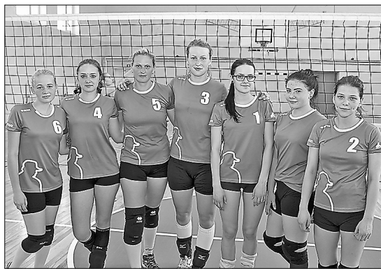
Самые сильные команды на открытом чемпионате Риебинского края по волейболу в 2016 году – «Ливанское лесное хозяйство» и «Левен».

Более месяца в Риебинской средней школе, в которой полностью обновлено покрытие пола, проходил открытый чемпионат края по волейболу среди мужских и женских команд.