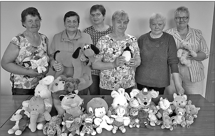
Участницы общества сеньоров «Рибеиню Варавиксне» вместе с собственными игрушками для детей.

В мае «Общественный центр «Личи»» начал акцию «Путешествие мягких игрушек», пригласив пожертвовать мягкие игрушки, которые не жалко подарить детям. Общество сеньоров «Рибеиню Варавиксне» также приняло участие в этой акции, собрав своими силами 30 мягких игрушек, которые были доставлены в кризисный центр «Личи».