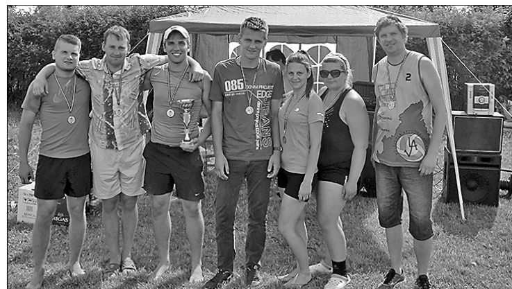
Команда «Пипариньш» одержала победу в волейболе в рамках спортивного праздника дня Петериса в Силокалнсе.