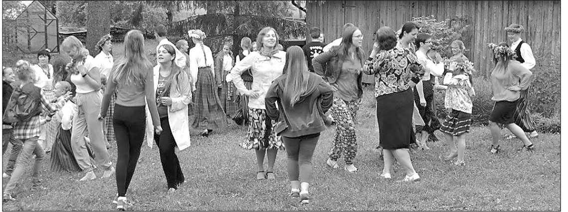
После дегустации домашнего сыра, все пустились в весёлый латгальский танец.

17 июня этого года, после обеда, примерно 70 человек отправились в биологическое крестьянское хозяйство «Юри» в Рушонской волости, чтобы начать празднование дня Лиго. Мероприятие организовывал Риебинский и Прейльский ТИЦ края в рамках проекта программы дней «Латгальской культуры 2016» – «Хлеб – моё богатство».