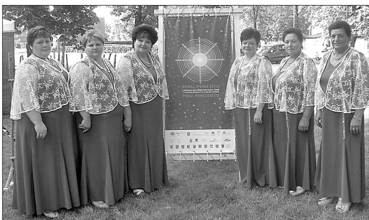
Привлекательные участницы вокального ансамбля «Запевочки» на первом фестивале латышской культуры «Рупи, рупи сītu».

С 1 по 3 июля в Даугавпилсе и во всем регионе Латгале по инициативе представителей консультативного комитета негосударственных организаций национальных меньшинств Министерства культуры ЛР, прошёл первый фестиваль латышской культуры «Рупи, рупи сītu» (Rūpi, rūpi sietu), который организовало общество «Южнолатгальский центр поддержки НГО» в сотрудничестве с Латгальским регионом планирования, отделом культуры Даугавпилсской городской думы, Латвийским национальным центром культуры и Европейским центром меньшинств (Германия).