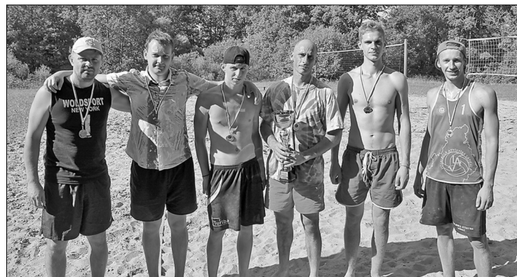
Волейбольные дуэты, занявшие почётные места в турнире по пляжному волейболу «Яни 2016» (слева): «Риебине», «ЛМС» и «ВАЛ».

В соответствии с положением, команды были разделены в две подгруппы, в которых, соревнуясь между собой, были выявлены по три самые сильные команды. 6 самыми сильными командами оказались: «Виктория», «Ветераны», «ВАЛ», «Риебине», «Краслава» и «ЛМС». В соревнованиях за долгожданные места, борьбу продолжили команды «ЛМС» и «Риебине», которые обошли в четвертьфинале команды «Краслава» и «Ветераны».