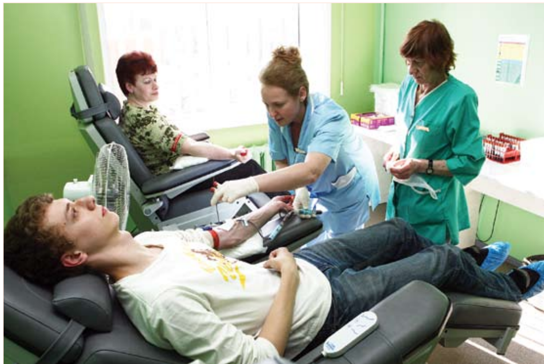
Asins sagatavošanas nodaļas uzdevums galvenokārt ir ar asinīm nodrošināt Jelgavas pilsētas slimnīcu, un pašlaik ziedotāju aktivitāte ir pietiekama, lai tas arī izdotos. Pēdējā laikā par donoriem kļūst aizvien vairāk jaunieši, taču netrūkst arī tā sauktais «zelta fonds» – cilvēki, kas asinis nodevuši pat krietni vairāk nekā 100 reizes.

Drīzāk gan pietrūkst kaut kas konkrēts, piemēram, rēzus negatīvās asinis,» teic S.Dzērve, bet E.Ašurko papildina, ka svarīgi, lai rezervē allaž būtu 0 grupas