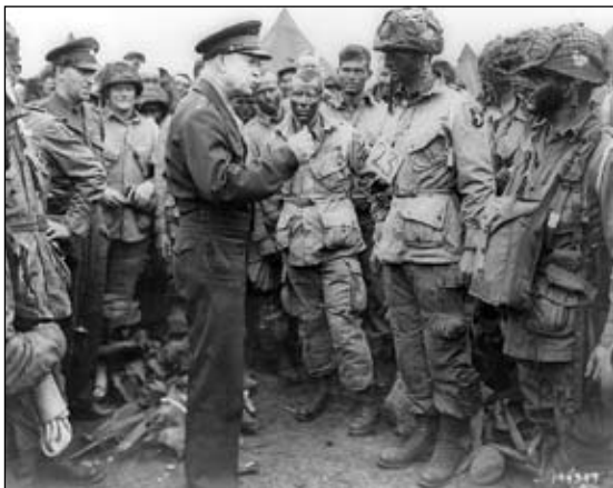
Высадка союзников в Нормандии, Омаха-бич, 1944 год».

Сразу после капитуляции Германии правда о значимости ленд-лиза и второго фронта еще была жива. Но наступившая затем эпоха «холодной войны» позволила главным идеологическим противникам – СССР и США – в очередной раз переписать мировую историю. В итоге американские школьники до сих пор уверены, что именно их страна разбила войска Гитлера. А мы, будучи в их возрасте, считали, что СССР практически в одиночку победил Германию. Но времена меняются, и есть надежда, что истинное лицо Второй мировой со временем откроется всем.