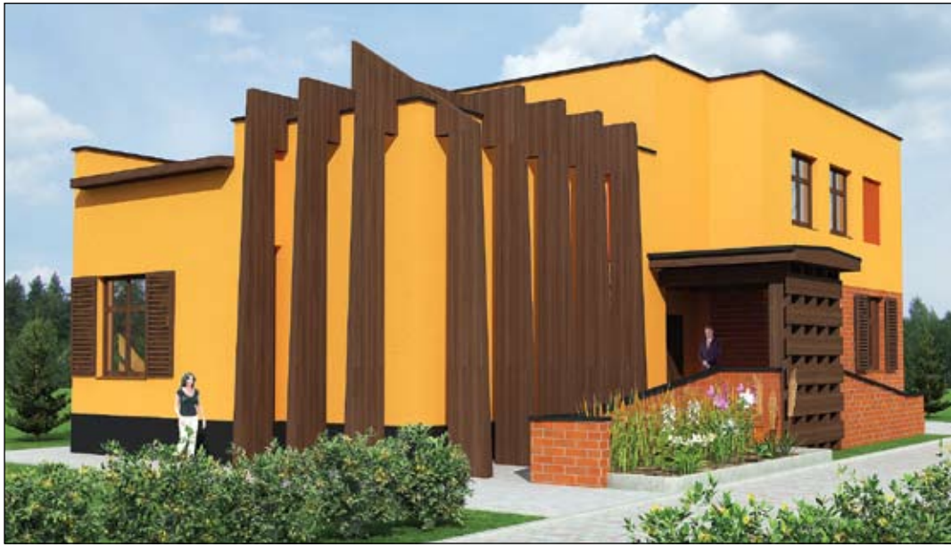
Katoļu ielā – tepat Jelgavas centrā – jau līdz Ziemassvētkiem taps katoļu baznīcas klosteris, kur darboties varēs sešas māsas. Klostera ēkas skice