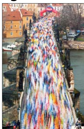
Izstādē «Czech Press Photo» eksponētas 60 fotogrāfijas no dažādiem Čehijas un Slovēnijas spīgtākajiem pagājušā gada notikumiem profesionālu žurnālistu acīm.

Šāds fotokonkurss Čehijas un Slovēnijas Republikās norisinās jau kopš 1995. gada. Tā mērķis ir sniegt iespēju sabiedrībai kļūt par iepriekšējā gada ievērojamāko notikumu aculieciniekiem – tā, kā tos saskata profesionālie žurnālisti, kā arī motivēt viņus savā ikdienas darbā atrast personīgu pieeju, tādā veidā stimulējot paša fotogrāfijas medija attīstību. «Czech Press Photo» dod iespēju publicēt arī tās fotogrāfijas, kas kaut kādu iemeslu dēļ nav atradušas savu vietu laikrakstu un žurnālu lappusēs. Šai izstādei, kurā eksponētas 60 fotogrāfijas, darbi izvēlēti no 228 fotogrāfu 3104 uzņēmumiem. Tāpat kā katru gadu, arī šogad tās atspoguļo pagājušā gada ievērojamākos notikumus šajās valstīs, kļūstot par dzīves spoguļi. Izstādes or-