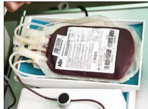
Vienā reizē cilvēks ziedo 450 mililitrus asiņu plus 30 mililitrus analīzēm. Starp citu – asins ziedošana ļauj arī regulāri sekot līdz savam veselības stāvoklim, jo analīzes tiek veiktas bez maksas.