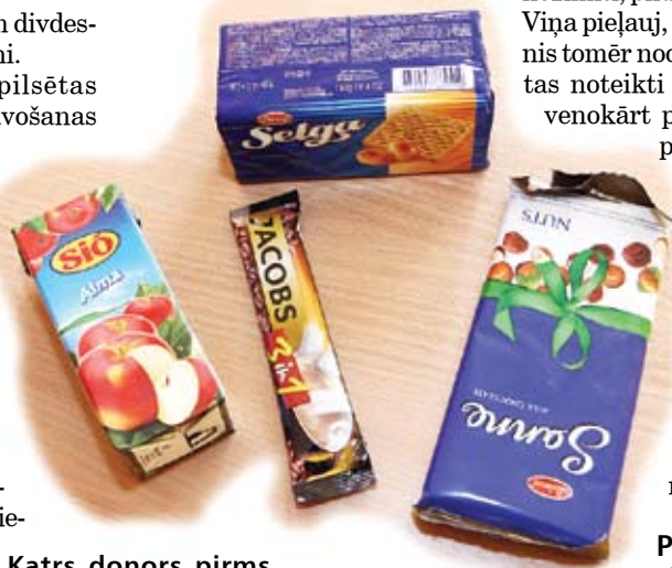
Katrs donors pirms asins ziedošanas tiek pacienāts ar saldu tēju vai kafiju un var nobaudīt tā saucamās donoru brokastis: cepumus, sulu, šokolādes tāfelīti, kā arī kafiju «trīs vienā». Šim mērķim katram donoram atvēlēts lats.

Taču arī Jelgavas pilsētas slimnīcas Asins sagatavošanas nodaļai ir savs «zelta fonds» – cilvēki, kas asinis nodod regulāri. «Mūsu «zelta fonds» ir apmēram 5000 cilvēki, kas asinis ziedojuši kā trīs četras, tā pat 120 un vairāk reizi,» S.Dzērve piebilst, ka tieši viņi ir vislabākie, jo atšķirībā no pirmreizējiem donoriem viņiem visas nepieciešamās analīzes veiktas vairākkārt, zināms viņu veselības stāvoklis, kas sniedz drošības sajūtu. Ja nepieciešamas kādas konkrētas grupas asinis, kādam no viņiem droši var piezvanīt