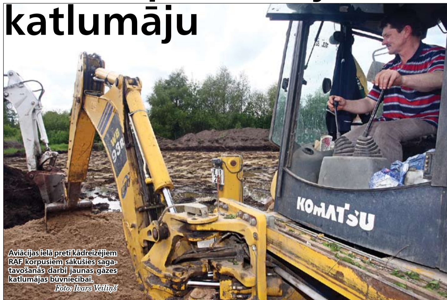
Aviācijas ielā pretī kādreizējiem RAF korpusiem sākušies sagatavošanās darbi jaunas gāzes katlumājas būvniecībai.