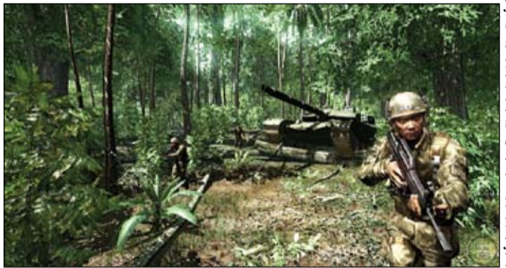
Cinīties virtuālajā pasaulē un iznīcināt pretinieku ir stilīgi, bet tikai retais no jauniešiem atzīst, ka būtu gatavs karavīra gaitas iepazīt armijā – tas jau esot pa istam un draudi ir reāli.

Šajā klasē noteikti nevalda bara sindroms un neviens no skolēniem nav gatavs akli sekot kādam tikai tāpēc, ka viņš ir no- teiktas situācijas līderis. «Ir jau bijis reizēm tā, ka paliek žel kāds, ko paši vai kāds cits sācis apcelt.