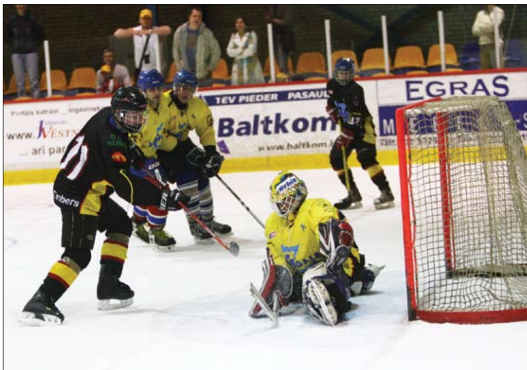
Jau tradicionāli sezonas noslēguma pasākumā vecāko grupu hokejisti samēroja spēkus ar vecāku izlasi. Spēlē pārliecinošu uzvaru guva jaunieši, tomēr vecāki «atspēlējās», uzvarot soda metienu sacensībā. Rezultātā – draudzīgs neizšķirts.

Šajā vecuma grupā jaunie zemgalieši čempionāta pamatturnīrā izcīnīja pirmo vietu. Kopumā tika gūtas deviņas