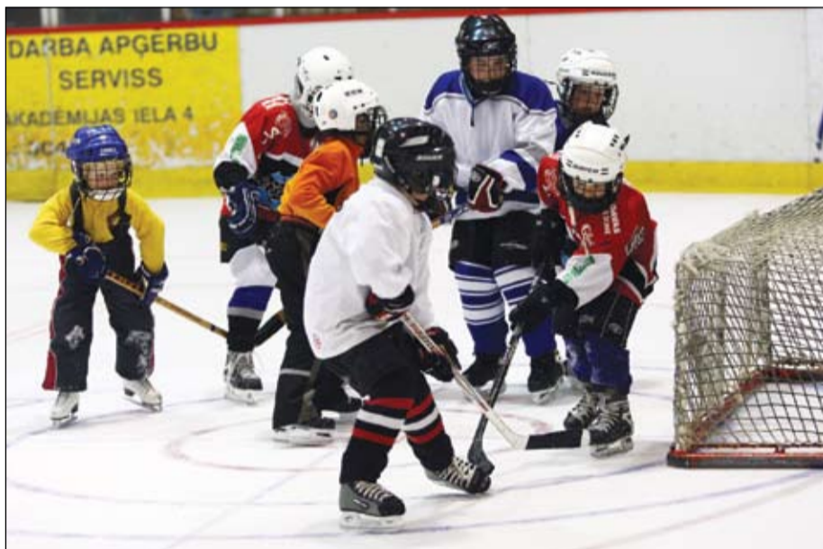
Iespēja uzspēlēt kopā ar vecākiem tika dota arī pašiem mazākajiem piecus līdz sešus gadus jaunajiem hokejistiem, kuri vēl tikai apgūst spēles pamatmaņas.

Komandas tagad izmanto nelielu atelpas brīdi, bet jau tūlīt pēc Līgo svētkiem uz atjaunotā Jelgavas Ledus halles ledus sāks gatavoties jaunajai hokeja sezonai.