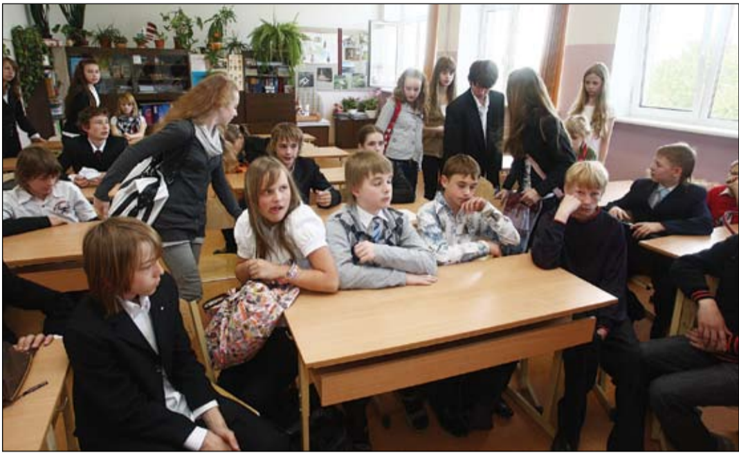
Jelgavas 3. pamatskolas 6.b klases skolēni nav tie, kas klusitēm bikstītu cits citu un nebūtu gatavi izteikties paši. Viņi visi labprāt iesaistās diskusijā par to, kāpēc arvien biežāk Latvijas skolās dzirdam faktus par bērniem, kas cieš no vienaudžu fiziskās vai emocionālās vardarbības.

«Skolā ar mani neviens nevarēja tikt galā – visi domāja, ka esmu nevaldāms trakulis: skolotājus neklausīju, stundās visu laiku ārdījos, klases biedrus apsaukāju. Un tad mani vienkārši aizveda pie psihologa. Sākumā, protams, nobjios – domāju, ka tas ir tas pats, kas psihene, un tūlīt mani sāks ārstēt. Bet izrādījās pavisam citādāk. Atceros, ka psihologs